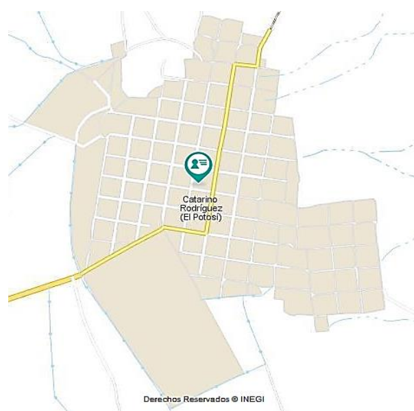
Figura 2. Ejido “El Potosí”