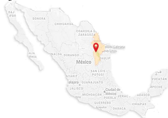
Figura 1. Ubicación de Nuevo León

Originalmente, “eran 272 ejidatarios y se conformaron en 12 unidades, variando el número de socios de cada unidad” (anexo 3, entrevista 2), se comenzaron a distribuir las tierras, “conforme iba necesitando el ejidatario un pedazo de tierra se le iba donando (anexo 3, entrevista 2).