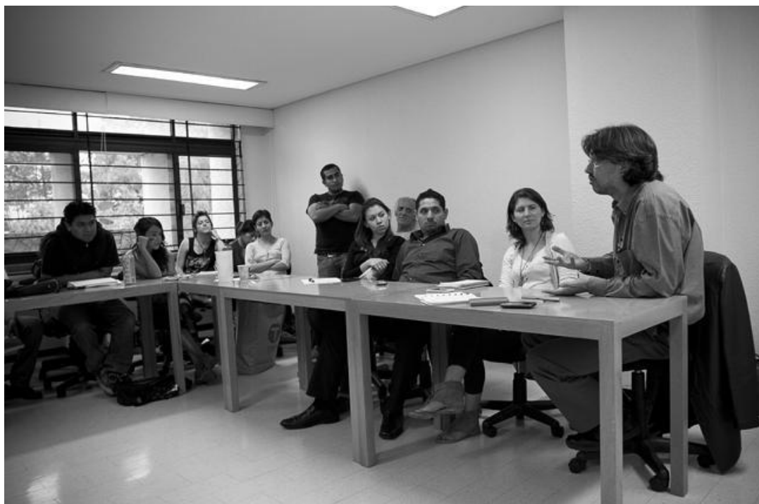
Seminario Permanente de Sociología Audiovisual. 1 de junio de 2012. Aula 1 del Instituto de Investigaciones Sociales de la UNAM.

La audiencia del seminario ha sido multidisciplinaria, procedente de diversas instituciones vinculadas al estudio de lo social, conformada tanto por investigadores especialistas en los temas abordados, como por estudiantes, documentalistas y fotógrafos. Las sesiones han tenido lugar en el Centro de Estudios Sociológicos de la UNAM, en el Instituto de Investigaciones Sociales de la UNAM y, actualmente, en el área de posgrado de la Facultad de Ciencias Políticas y Sociales de la UNAM.