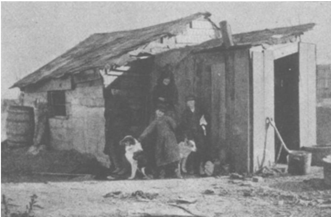
Figura 1. Fotografía de F. W. Blackman en “The Smoky Pilgrims”, American Journal of Sociology, 1897. Obtenida de la versión electrónica del artículo.

estudio de caso realizado por F. W. Blackmar de sobre dos familias en Kansas (Chaplin, 1994: 201). El artículo de Blackmar incluye nueve fotografías realizadas por él, con el fin de apoyar el argumento sobre: “los males de la ciudad no se limitan a los entornos urbanos” (Chaplin, 1994: 204). Así, Blackmar es uno de los primeros sociólogos en emplear a la fotografía como instrumento de denuncia en una publicación académica.