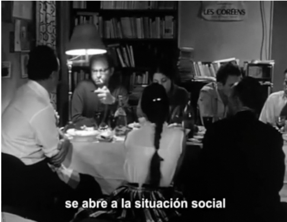
Fotograma del documental Crónica de un verano . En la escena se aprecia un grupo focal moderado por los realizadores: el antropólogo Jearn Roush y el sociólogo Edgar Morin.