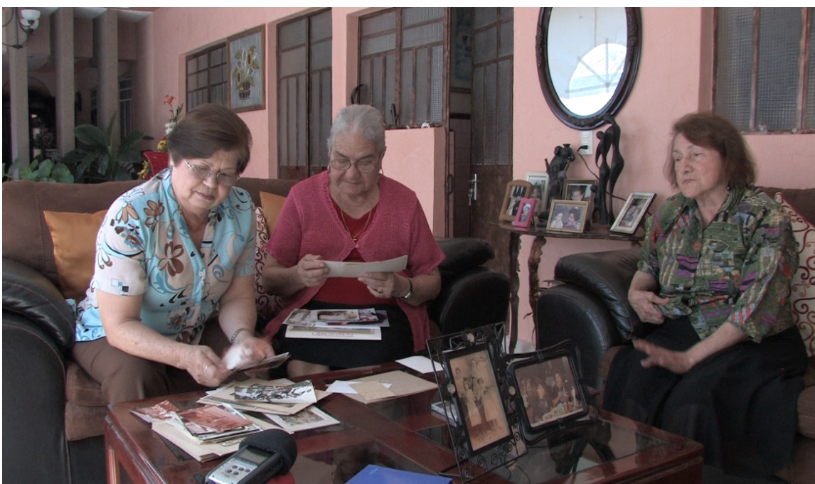
Fotograma: Entrevista con foto evocación para la investigación –realización del video documental Aguillilla y Redwood City , una producción del Laboratorio Multimedia para la Investigación Social.

La foto evocación ( photo elicitation ) es una técnica enmarcada en los métodos colaborativos. Esta implica la incorporación de fotografías como detonadores de la memoria y los sentimientos en entrevistas. Según Harper, las partes del cerebro que procesan las imágenes están mucho más evolucionadas que las que procesan la información verbal, por lo que las entrevistas con imágenes pueden ser mucho más profundas.