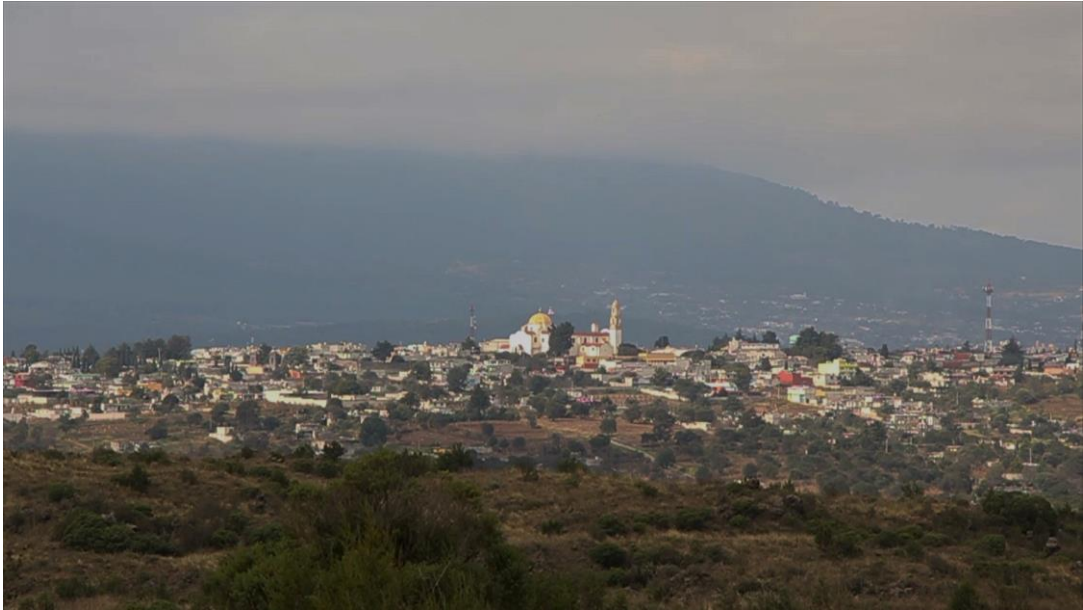
San Salvador El Seco. 2017 Punto F: f/14 Tiempo de exposición: 1/125 s Velocidad ISO: 100 Distancia focal: 55 mm