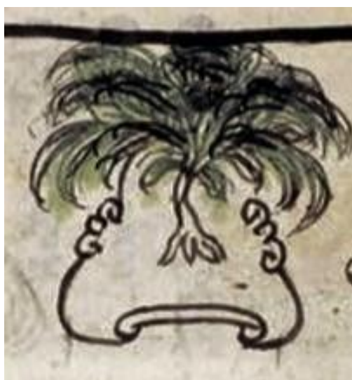
Topónimo de Cuauhyavalolco siglo XVI

Es importante conocer los datos extraídos del manuscrito, han perdurado por más de 760 años, de manera particular es un encuentro con algo que va más allá de un texto, es reconocerse descendiente de culturas que reunieron saberes muy valiosos, con ellos refuerzo mi identidad.