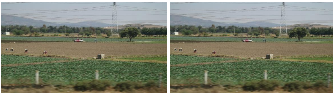
Camino hacia San Salvador El Seco, Puebla. Fotogramas, 2016.

La primera vez que visité San Salvador quedé maravillado, abrí mi percepción al máximo. Al acercarme de manera física al poblado, observé muchos terrenos cultivados con hortalizas como col, brócoli, variedades de lechugas, vegetales; múltiples hectáreas de siembra, eso me alegró el corazón, ver que es tierra fértil, productiva y de mucho trabajo. En la sección 3. 1. 2. continúo con la segunda fase al acercarme a los habitantes.