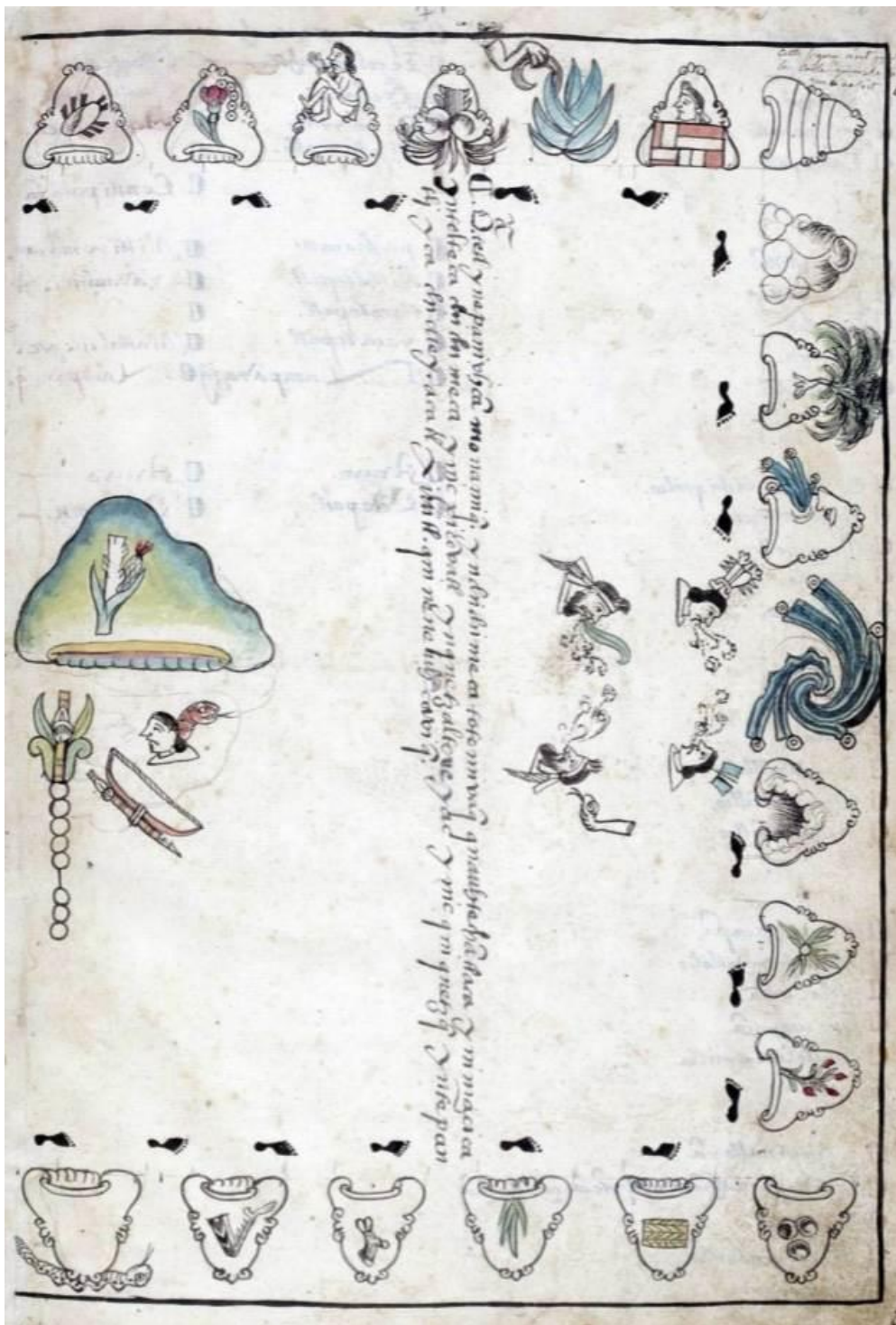
Documento de tierras y Señoríos de Cuauhtinchan. Topónimo de Cuauhyavalco significa en la redondez montuosa o lugar cercado de arboledas. Localizado hacia la esquina superior derecha del mapa, al lado derecho del monte de piedras.