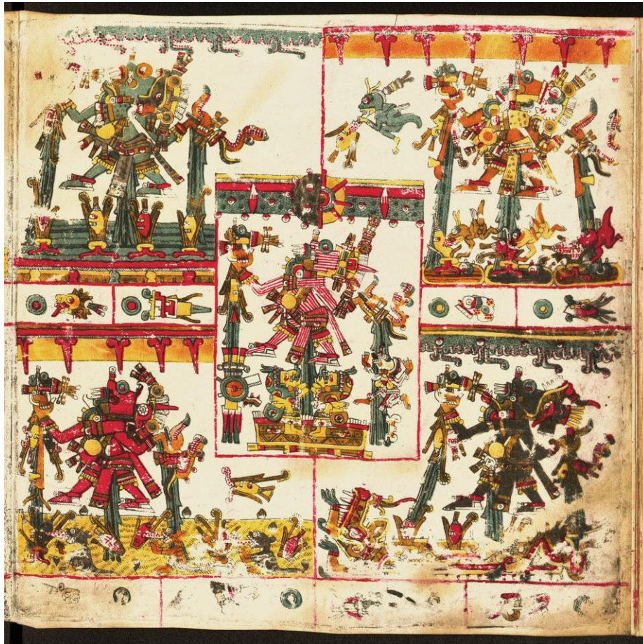
Lámina 27 del Códice Borgia o Yoalli Ehecatl Representación de los cuatro rumbos, en relación a los cambios de ciclos. Esquina inferior derecha Cipactli, esquina superior derecha llegan las plagas, esquina superior izquierda agua abundante, esquina inferior izquierda sequedad cuando las tuzas comen los restos de la plantación del maíz.

Tolteca Chichimeca, encontré las mismas palabras dentro de los manuscritos en los que se hizo mención a la región a la que perteneció en la antigüedad San Salvador El Seco, se le llamaba Cuauhyavalolco.