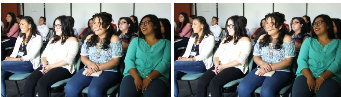
Alumnas de la licenciatura en turismo presenciando la proyección del audiovisual. Universidad Tecnológica del Centro de Veracruz, Cuitláhuac, Ver. Fotogramas, junio 2018.