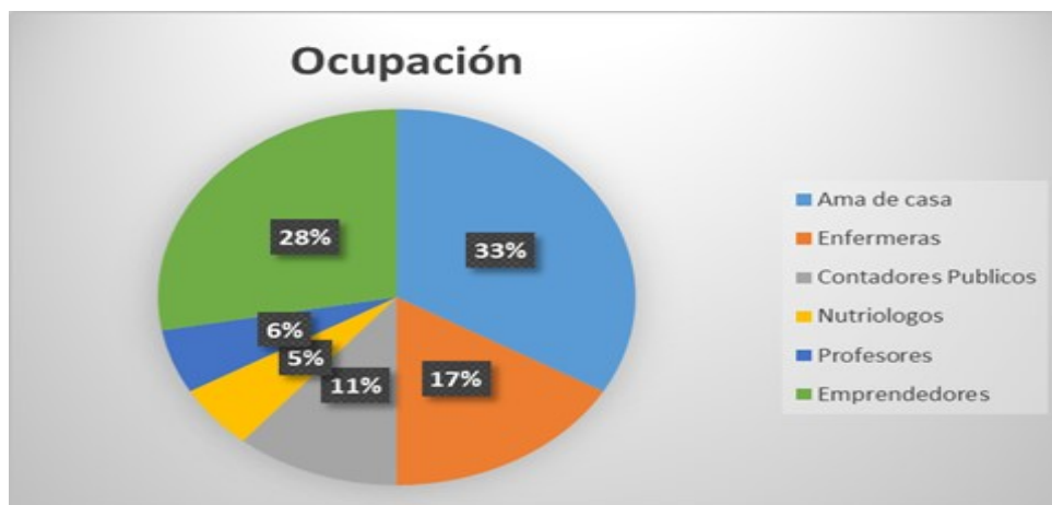
GRÁFICA 1. Ocupación

En la gráfica 1 observamos que el 33% de las participantes son amas de casa, seguido de un 28% aquellas que laboran en oficios no profesionales, un 17% de las participantes son enfermeras, 11% contadores públicos, 6% profesores y en un 5% nutriólogos.