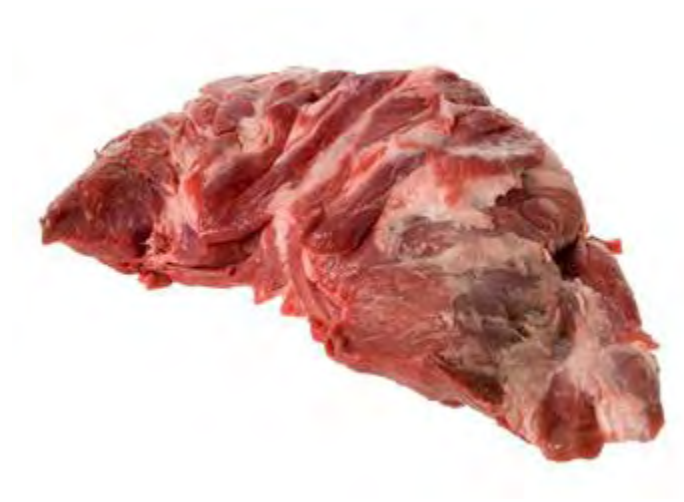
Figura 8.- CORTES DE LA CARNE DE JABALÍ. CUELLO

El cuello o pescuezo es un corte muy económico y muy apropiado para hacer guisos, estofados, fondos, ya que proporciona un exquisito sabor al conjunto y es muy jugoso y tierno.