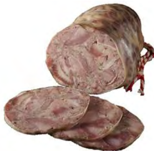
Figura 7.- CORTES DE LA CARNE DE JABALÍ. CABEZA Fuente: Blueberg. Saboreando a la argentina Detalles sobre las carnes de caza mayor en Argentina

Por lo general se la cocina entera, ya sea al horno o a la parrilla. Contiene mucha carne y distintas texturas, lo que es muy versátil.