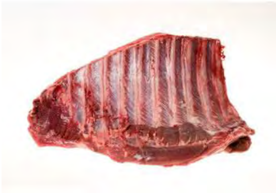
Figura 11.- CORTES DE LA CARNE DE JABALÍ. COSTILLAR

Especiales para hacerlas enteras a la parrilla. Con mucho sabor y buen aroma, contienen menos carne que las chuletas, pero de sabor intenso. Contiene grasa externa por lo que no se recomienda abusar de su consumo.