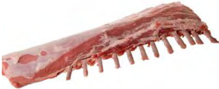
Figura 9.- CORTES DE LA CARNE DE JABALÍ. CHULETERO Fuente: Blueberg. Saboreando a la argentina Detalles sobre las carnes de caza mayor en Argentina