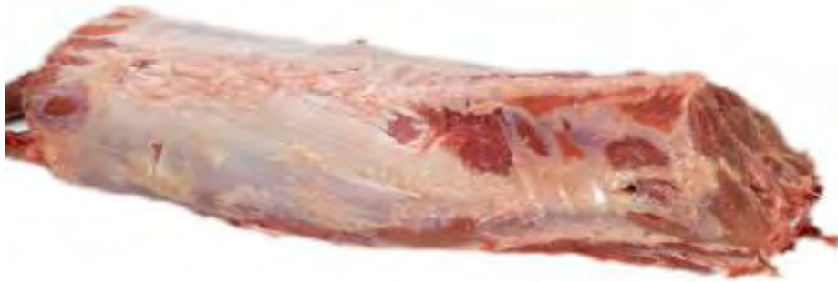
Figura 12.- CORTES DE LA CARNE DE JABALÍ. LOMO Fuente: Blueberg. Saboreando a la argentina Detalles sobre las carnes de caza mayor en Argentina