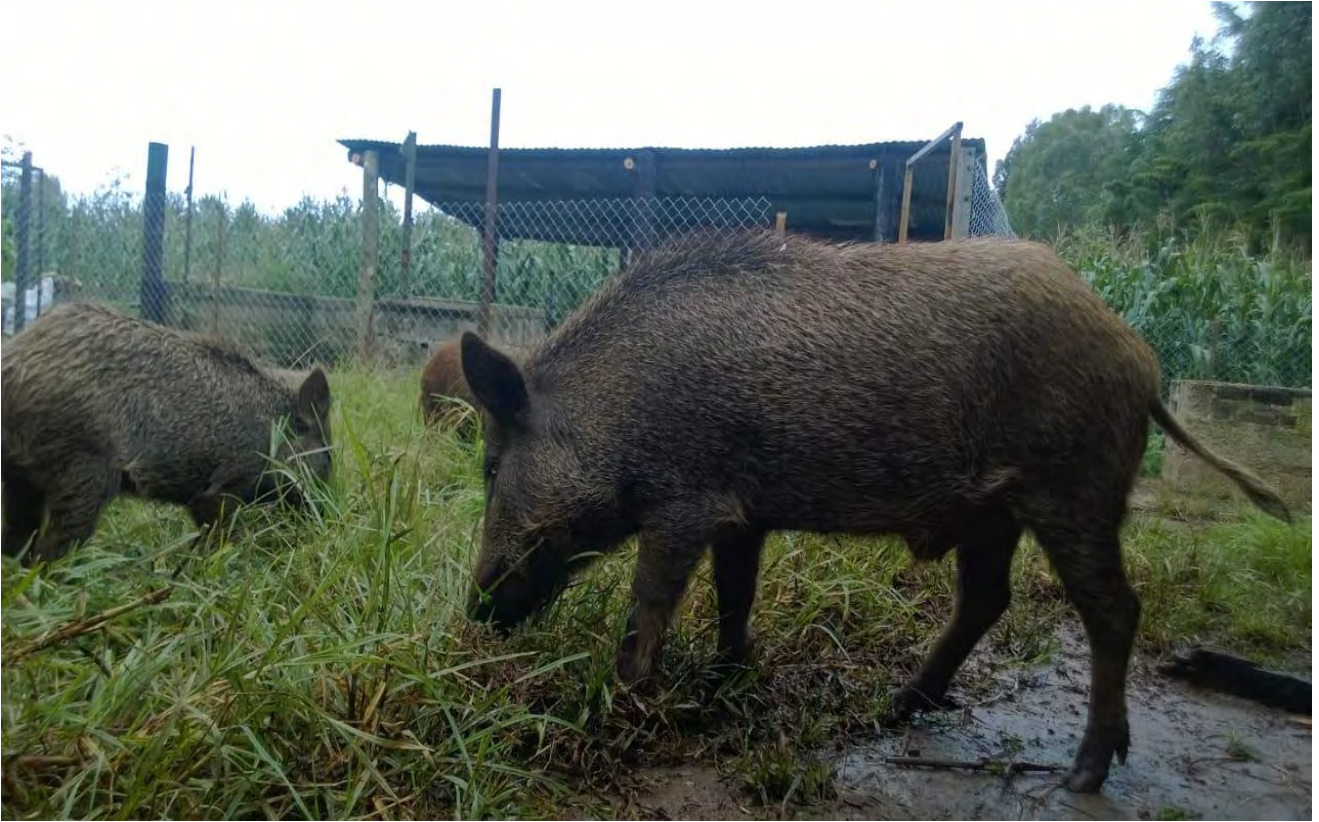
Figura 5.- JABALIES ADULTOS EN CAUTIVERIO