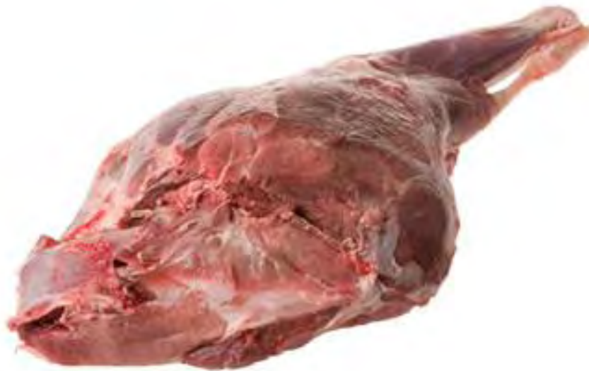
Figura 14.- CORTES DE LA CARNE DE JABALÍ. PIERNA Fuente: Blueberg. Saboreando a la argentina Detalles sobre las carnes de caza mayor en Argentina

La pierna o pernil entero es un corte muy sustancioso en cuanto a la cantidad de carne que presenta, generalmente se la cocina a la parrilla, pero también otros tipos de cocciones, también es de dónde se hacen los jamones