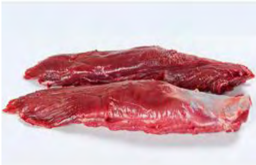
Figura 13.- CORTES DE LA CARNE DE JABALÍ. SOLOMILLO

Es la carne más magra del jabalí. No tiene grasa intramuscular y su color es intenso. De gran ternera y sabor, se caracteriza por sus variadas formas de preparación. Ideal para dietas de bajas calorías.