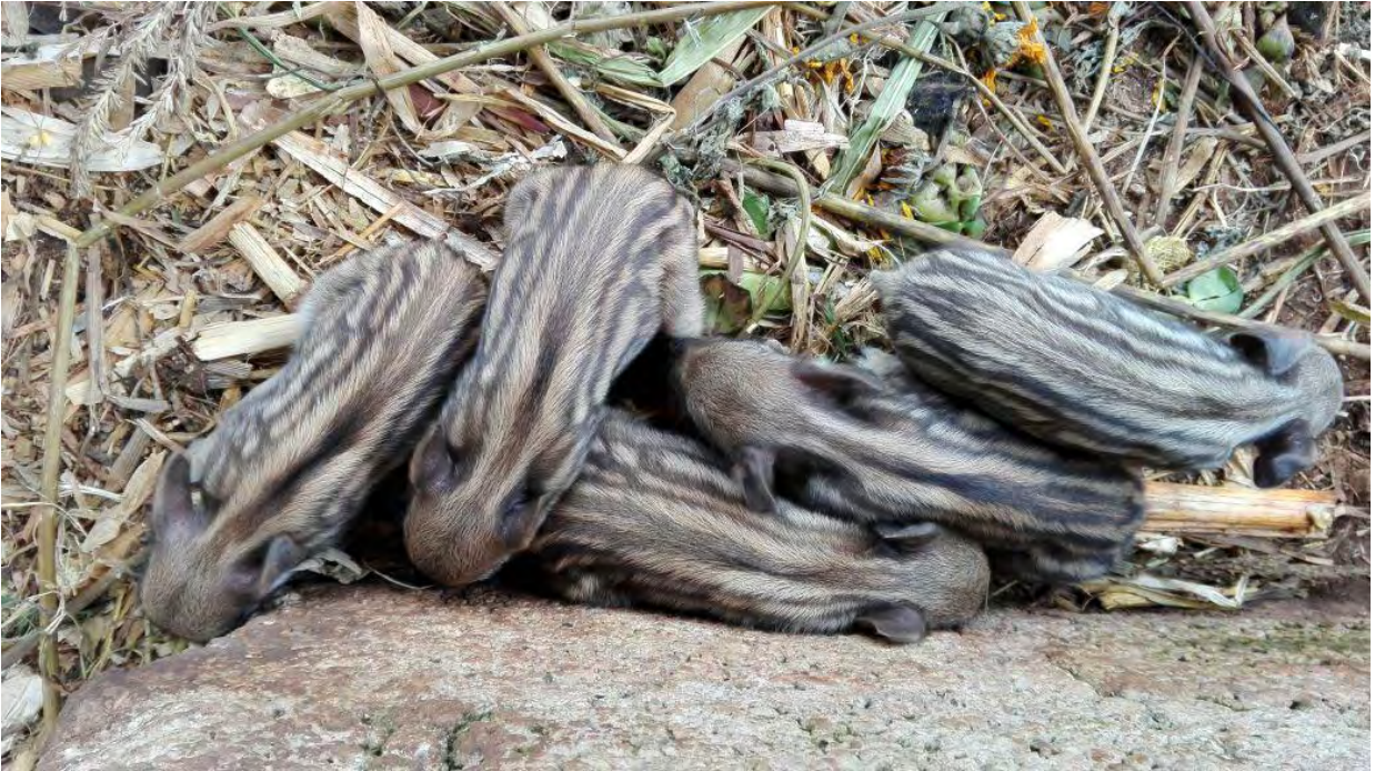
Figura 4.- CRIAS DE JABALÍ (JABATOS)