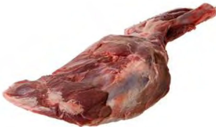
Figura 10. CORTES DE LA CARNE DE JABALÍ. PALETA

Corresponde a las patas delanteras. Su carne es ligeramente veteada con grasa exterior y o piel. Es ideal para hacer estofados, guisos o también cocinarla, entera, a la parrilla o al horno.