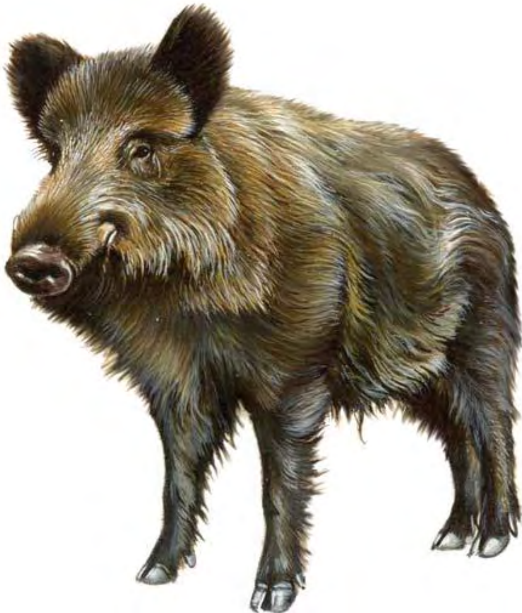
Figura 1.- JABALÍ (SUS-SCROFA)