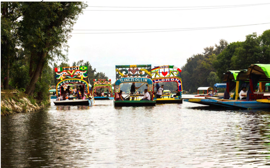
Año, 2018.