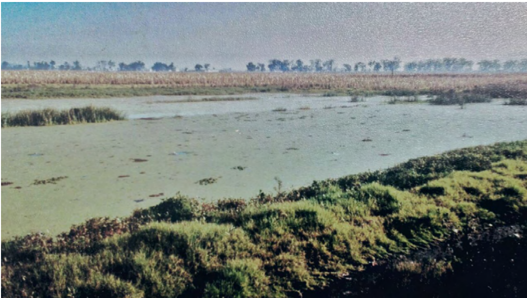
Foto 2. Suelo de Xochimilco

Año, entre 1910 y 1920.