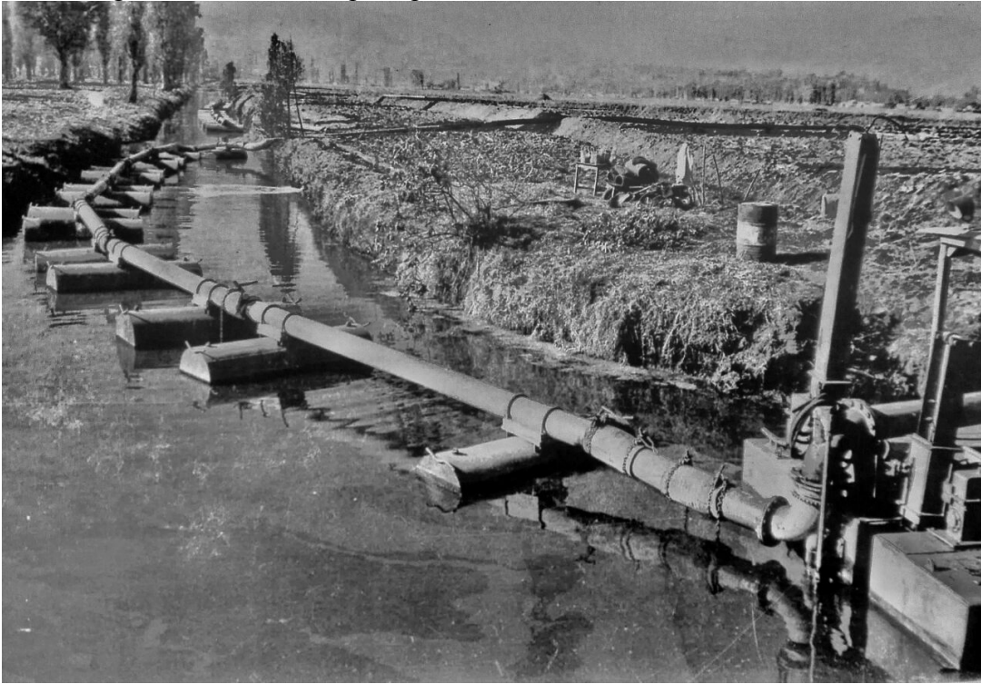
Foto 1. Agua entubada en la época porfiriana

Año, entre 1909 y 1910