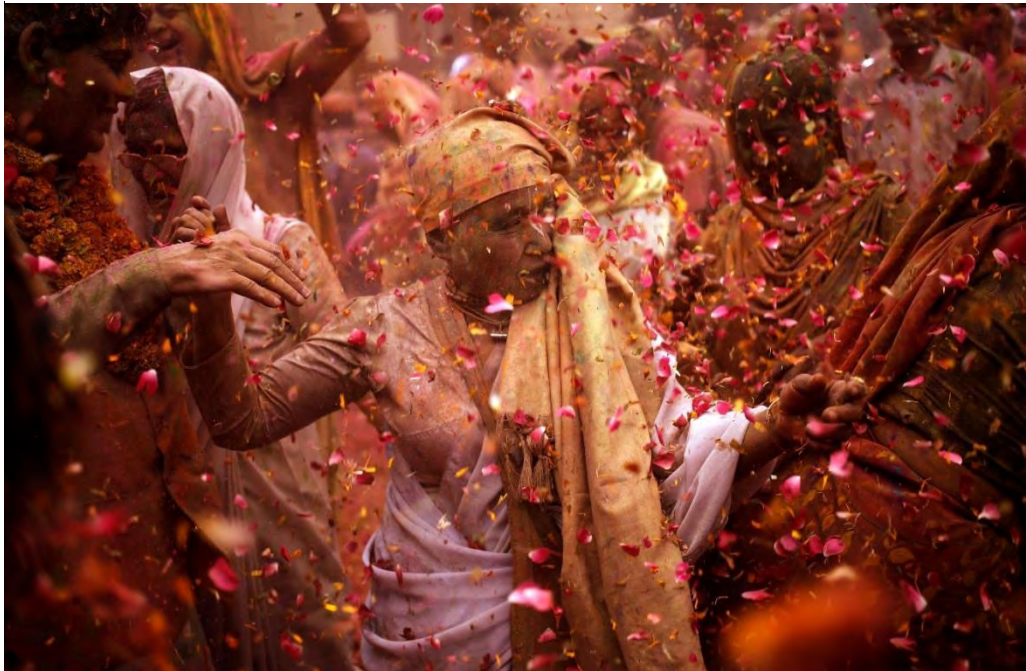
Ilustración 22 Una viuda celebra el Festival Holi con miembros de otras castas. Este año fue muy importante porque varios sectores que antes se oponían a que ellas celebraran este festival, decidieron unirse a esta festividad.

Fuente: Reuters/Anindito Mukherjee, “Indian widows colorfully break a 400-year-old taboo to celebrate the festival of Holi”, India, 23 de marzo de 2016, Dirección URL: https://qz.com/645988/indian-widows-colorfully-break-a-400-year-old-taboo-to-celebrate-the-festival-of-holi/ , [consulta: 27 de abril de 2018].