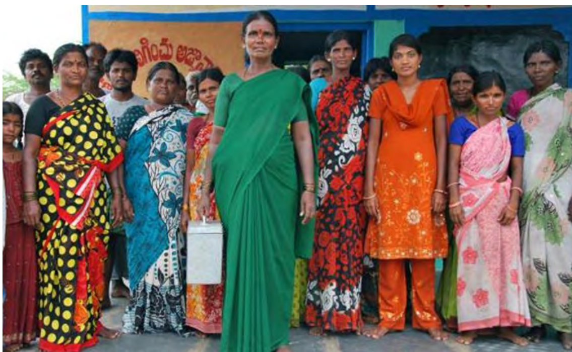
Ilustración 24 Una trabajadora Sanitaria Rural de Mallenipalli, Anantapur.