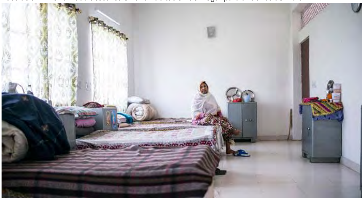
Ilustración 12 Una viuda descansa en una habitación del hogar para ancianas de Maitri