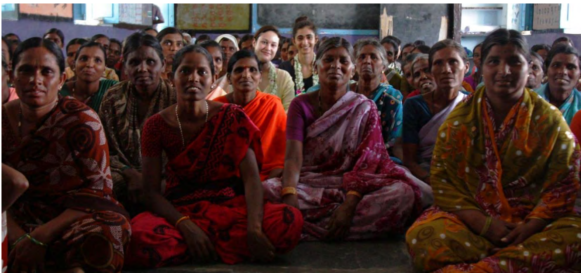
Ilustración 23 Mujeres integrantes de un Sangham