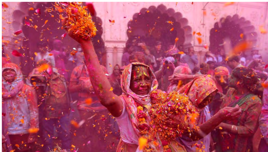
Ilustración 10 Viudas jugando en el Festival Holi.