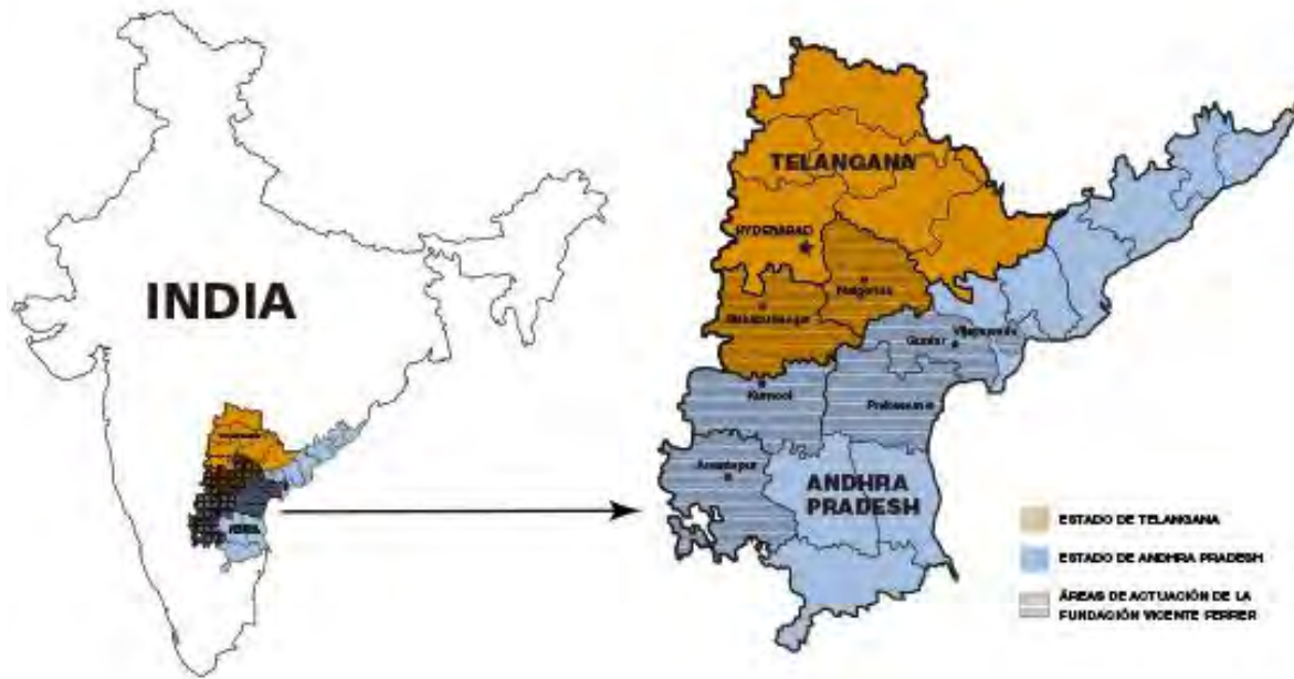
Ilustración 16 Lugares donde la FVF realiza sus labores.