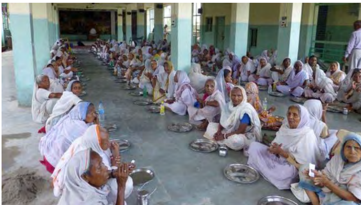
Ilustración 21 Las viudas esperan a que la comida sea servida en el hogar de la ONG Maitri .