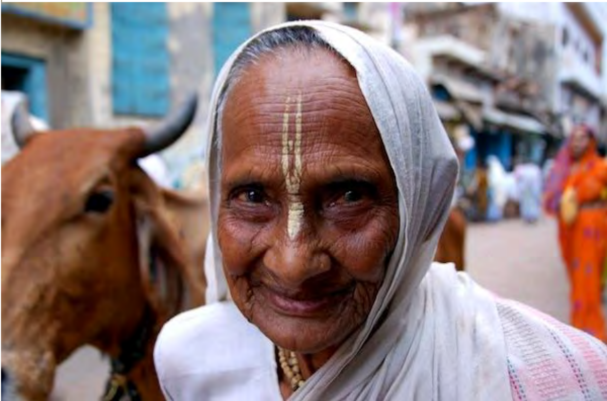
Ilustración 6 Viuda con la marca de ceniza en la frente.