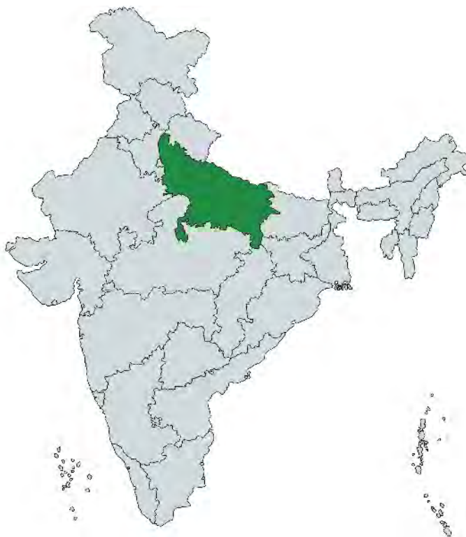
4. Mapa de la India, la parte resaltada en verde es Uttar Pradesh, al oeste del estado se encuentra Vrindavan.