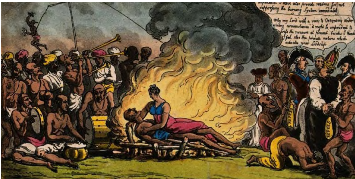
Ilustración 2 "Satí".

Fuente: Thomas Rowlandson, "The Burning system illustrated", 1815, Dirección URL: http://www.victorianweb.org/history/empire/india/suttee.html , [CONSULTA: 02 DE OCTUBRE DE 2017].