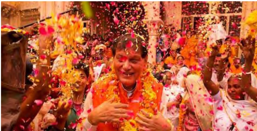
ILUSTRACIÓN 9 Cada año, el fundador de Sulabh International, Dr. Bindeshar Pathak, realiza una celebración de Holi, la fiesta del color, donde las viudas desafían las antiguas costumbres.