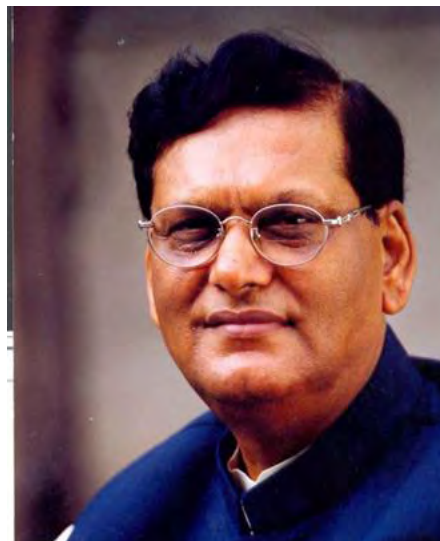
Ilustración 8 El Dr. Bindeshwar Pathak