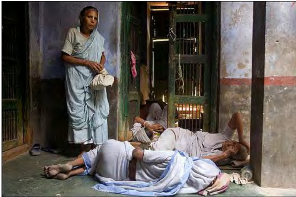
Ilustración 5 “Viudas en la India”.