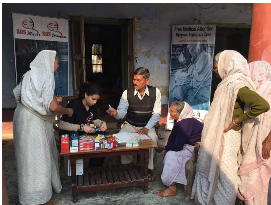
Ilustración 15 Viudas acuden a consulta médica en el dispensario de SOS Mujer