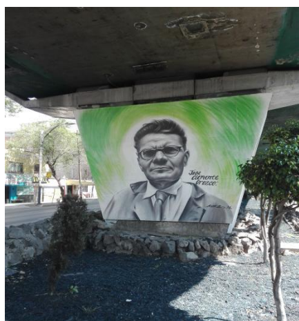
Imagen 13. 23/04/2017.

José Clemente Ángel Orozco Flores, conocido normalmente como José Clemente Orozco, fue un gran Muralista Mexicano al igual que Diego Rivera. Este muralista mexicano realizó múltiples murales que quedaron grabados en diversas instituciones del país, una de las características principales de este muralista era el uso del fuego en la mayoría de los murales que realizó, así como también el reflejo de la sociedad mexicana.