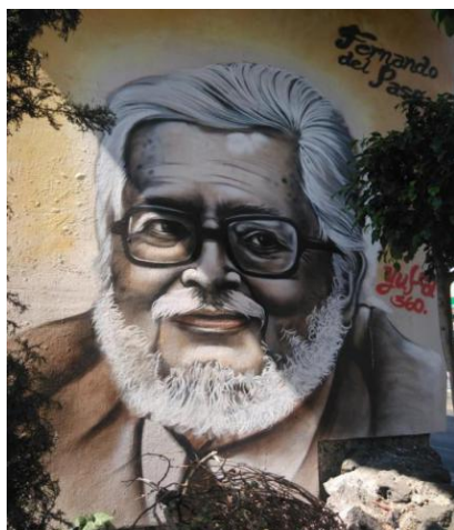
Imagen 14. 23/04/2017.

Escritor, poeta, diplomático, dibujante y académico Mexicano, personaje nacido en la Ciudad de México, conocido en el extranjero por su labor diplomática en Francia. Sin duda, no se deja de pensar que podría tener influencias de esta cultura en sus obras literarias, sin embargo, es un personaje que alimentó el acervo literario de México, con grandes novelas que reflejaban la situación del México de esos tiempos, como su obra José Trigo, personaje que se ubica en los Tiempos ferrocarrileros, cuando Tlatelolco era el paso hacia algún destino.