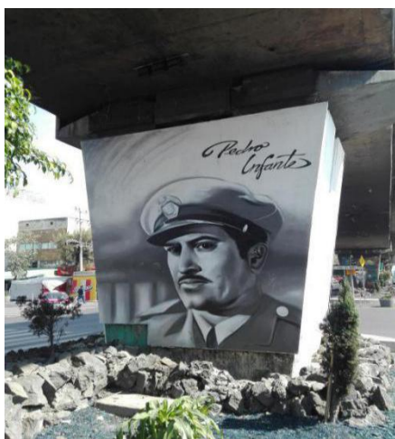
Imagen 7. 23/04/2017.

Pedro Infante Cruz, nacido en Mazatlán Sinaloa en noviembre de 1917, “Nacido hace precisamente 100 años en Sinaloa. Pedro Infante es uno de los grandes símbolos de la cultura popular mexicana. Así, ni las modas, ni las tendencias musicales, ni el tiempo o la geografía han, logrado dejarlo en el olvido.”