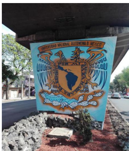
Imagen 17.

Por mi raza hablará el espíritu, es el lema Principal de la Máxima casa de estudios, la UNAM, lema asignado por el entonces Rector de la Universidad, José Vasconcelos: “..se significa en este lema la convicción que la raza nuestra elaborará una cultura de tendencias nuevas, de esencia espiritual y libérrima. Sostendrán el escudo un águila y un cóndor, apoyado todo en una alegoría de los volcanes y el nopal azteca.” 50