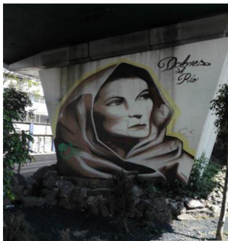
Imagen 5. 23/04/2017.

Dolores Asúnsolo y López Negrete, nació el 03 de Agosto de 1904 en Durango, México. Tuvo sus primeras participaciones en el cine estadounidense en la época del cine mudo, posteriormente Dolores del Río al tener una pausa y declive en su carrera artística, ella decide regresar a México en los años 40, momento histórico en donde México se encontraba recuperándose de la Revolución Mexicana, la sociedad trataba