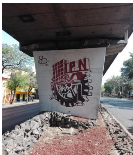
Imagen 18. Foto Propiedad de la Autora 23/04/2017.

El Instituto Politécnico Nacional es una institución Pública creada en los años treinta bajo una propuesta del entonces presidente de la república, Lázaro Cárdenas y Juan de Dios Bátiz, entonces senador de la República. Esta idea fue cimentada bajo bases tecnológicas a fin de contribuir al desarrollo tecnológico e industrial del país; uno de los objetivos, era abarcar a un gran sector de la población, particularmente a los sectores de más bajos recursos.