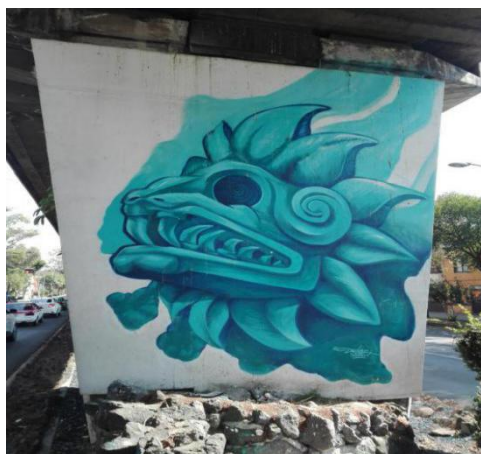
Imagen 3. 23/04/2017.

Para hablar de la serpiente emplumada es importante ubicarnos en tiempo y espacio. El templo de Quetzalcoatl se encuentra ubicado en la Ciudad Arqueológica de Teotihuacan, su nombre es una palabra nahuatl, que significa Lugar de Dioses, la ciudad estuvo habitada del año 100 a.C. a 700 d. c.