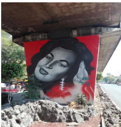
Imagen 6.

Elsa Irma Aguirre Juárez, nacida en Chihuahua, México en el año de 1931, es una figura representativa de la época de oro del cine mexicano. Siendo ella una niña, su familia decide radicar en la Ciudad de México, es así como uno de los productores cinematográficos del momento la descubre y empieza a incursionar en el mundo del cine a temprana edad.