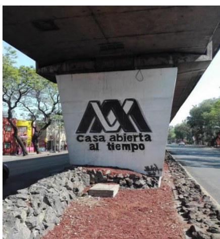
Imagen 19. Foto Propiedad de la Autora 23/04/2017.

Casa abierta al tiempo , es la frase que acompaña al emblema de la Universidad Autónoma Metropolitana, mejor conocida por sus siglas, UAM. Esta Universidad se fundó a principios de los años 70, esto como una demanda del número de solicitudes para ingreso a licenciatura, que fue rebasado y que instituciones como la UNAM y el IPN, no podían con la demanda, ya que se encontraban saturadas.