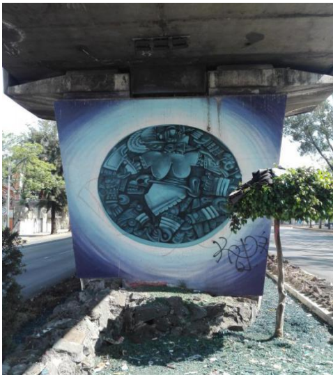
Imagen 2. Foto Propiedad de la Autora 23/04/2017.

M onolito que representa la Diosa mexicana de la luna, fue descubierta el 21 de febrero de 1978, escultura esculpida entre los años 1469-1481, tiene aproximadamente 3.25 metros de diámetro y 30 cm de espesor, logrando un peso de aproximadamente 8 toneladas, fue descubierta mientras obreros de la compañía de Luz y fuerza realizaban trabajos en las calles de Guatemala y Argentina en el Centro Histórico de la Ciudad de México.