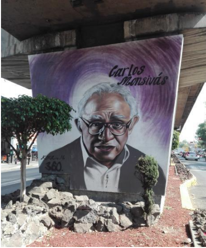
Imagen 15. Foto Propiedad de la Autora 23/04/2017.

Carlos Monsiváis (Ciudad de México 4 de mayo de 1938 - 19 de junio de 2010) es reconocido en el medio periodístico, intelectual y literario, conocido como el único escritor y cronista mexicano capaz de realizar de forma aguda y desenfadada una crítica del México contemporáneo y abordar con ironía y particular sentido de crítica, lo mismo los temas de alta cultura como de la cultura popular. Por ejemplo, el cine, los movimientos sociales, la política, el espectáculo, el fútbol y hasta a los grandes personajes históricos o los medios de comunicación.