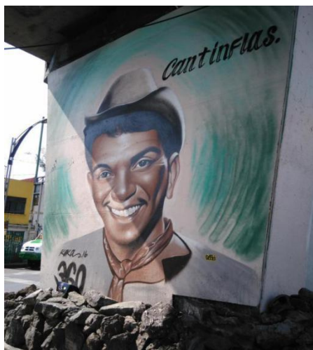
Imagen 9.