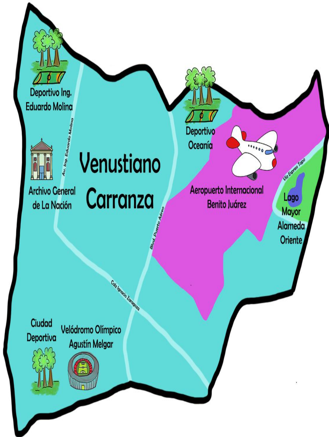
Imagen 1. Demarcación Delegación Venustiano Carranza. 35