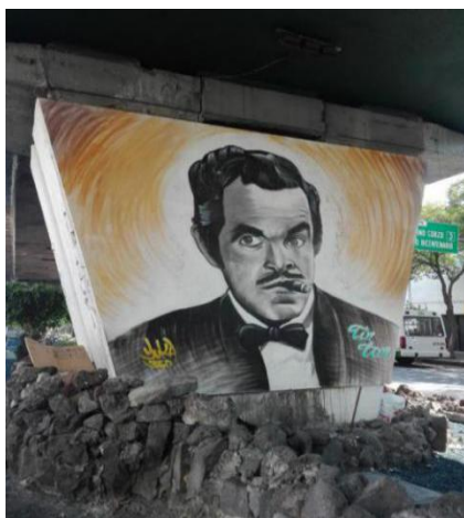
Imagen 8. Foto Propiedad de la Autora 23/04/2017.

Germán Genaro Cipriano Gómez Valdés Castillo, mejor conocido como Tin Tan, este personaje ícono del cine mexicano que representa la mezcla de las culturas México-americana, esta mezcla e intercambio cultural que no sólo impresionaba por su vestimenta sino por el uso de ambas lenguas mezcladas entre el español y el inglés.