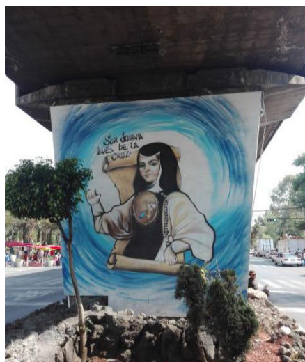
Imagen 16. Foto Propiedad de la Autora 23/04/2017.

Juana Inés Ramírez de Asbaje y Ramírez de Santillana, la religiosa mexicana, fue una erudita autodidacta que desafió los privilegios de los hombres y se convirtió en una de las escritoras más prolíficas del siglo XVII. La imagen del mural muestra a Sor Juana Inés de la Cruz portando un atuendo particular con el que es reconocida y ligada con su formación de religiosa.