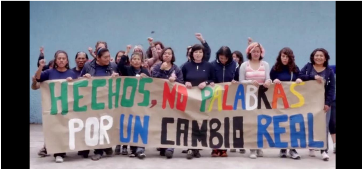
Fig. 24. Guionistas del cortometraje La/Mentada de la Llorona .

Exigimos un cambio real, no ficticio ¡Hechos no palabras!