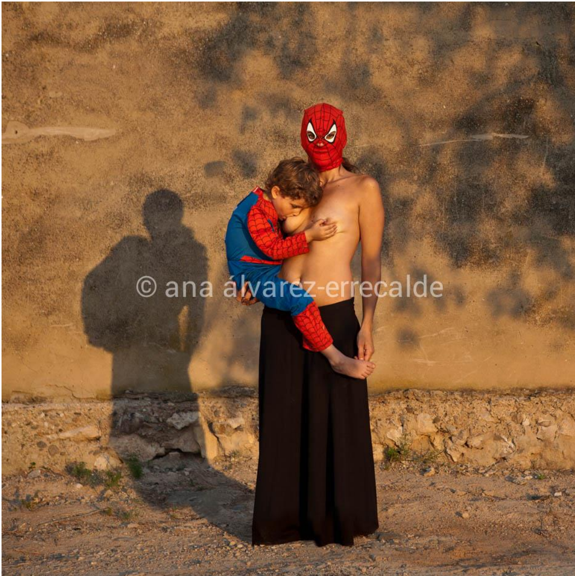
Figura 5. “Simbiosis”. De la serie “Las cuatro estaciones”.