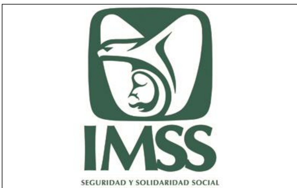
Figura 19. Logotipo del Instituto Mexicano del Seguro Social.

Sin embargo, –y aquí argumentaré a favor de este “salto mortal” que me llevó de hablar sobre la Virgen madre y su función pedagógica a los cenotafios de Anderson–, por ser la maternidad parte de una narrativa asociada además de, a la tradición religiosa, al poder de la nación, en la presente investigación se considera que sí hay [también para la nación misma] otros emblemas igualmente importantes, como lo es, en el caso de México, el Monumento a la Madre o por ejemplo, la presencia de la imagen “maternal” en íconos tan conocidos como el logotipo del Instituto Mexicano del Seguro Social 64 , como se aprecia en la Figura 19.