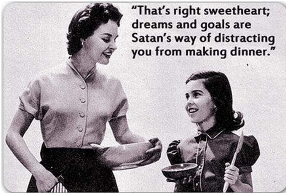
Figura 2. Imagen promovida por los mass media estadounidenses de la postguerra.

No obstante lo anterior, y pese a que Betty Friedan se convirtió en una de las activistas feministas estadounidenses más representativas, las críticas a su trabajo van en dirección a cuestionar que se haya dedicado a reivindicar predominantemente los derechos de mujeres blancas y de clase media, olvidándose de las mujeres de color, de escasos recursos o migrantes, que en muchos casos trabajaban y vivían a la sombra de aquellas.