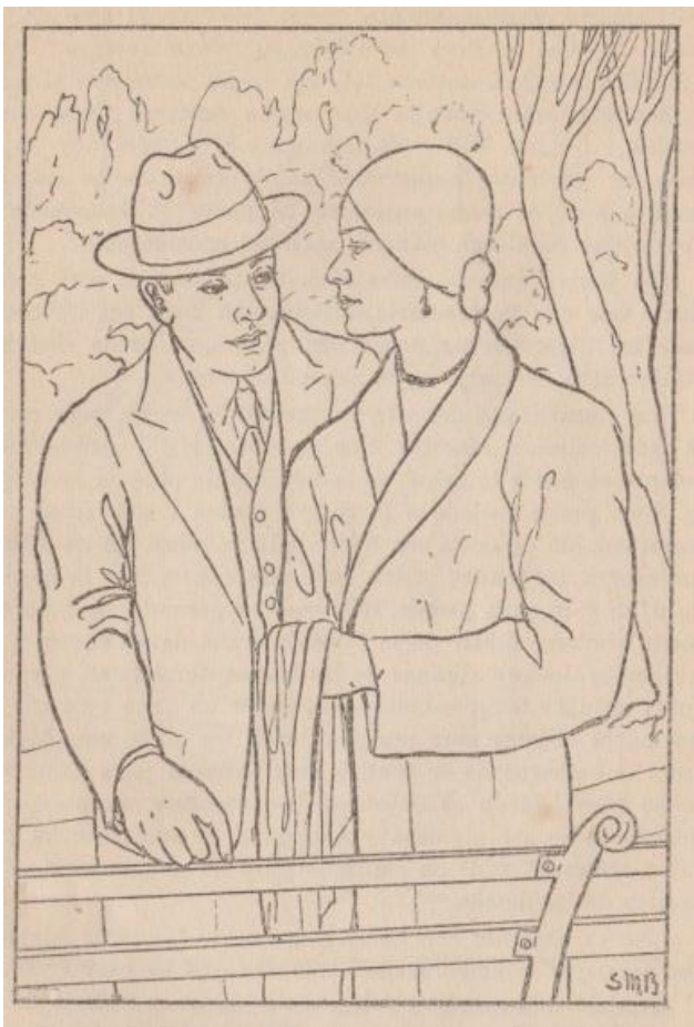
Figura 9. “Un paseo corto”.

Sin embargo, el aspecto de las figuras femeninas empleadas para representar las acciones consideradas erróneas en el cuidado de los niños o durante el embarazo, se asemejan al de mujeres de clases populares o del ámbito rural: usan rebozos y se peinan con trenzas (Figuras 10 y 11).