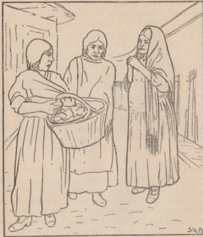
Fig. 3.—NO HAGA USTED CASO DE LO QUE DIGAN SUS AMIGAS Y SUS VECINAS.—Las consejas y las supersticiones en relación con el embarazo y con el parto, carecen totalmente de fundamento. Guíese usted por los consejos del médico o de la partera competente, y no pierda su tiempo escuchando los cuentos de las vecinas o de las amigas.