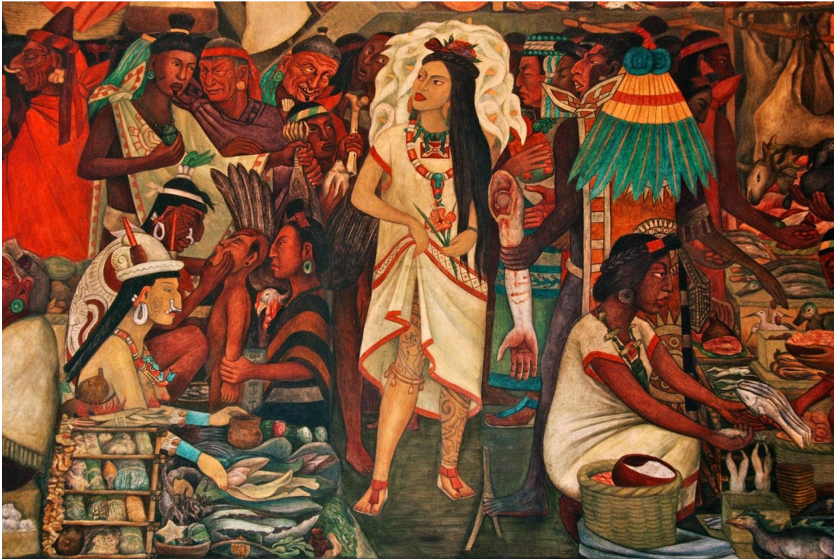
Figura 16. Fragmento del mural del Palacio Nacional donde Diego Rivera representa a la Malinche.

le valió ser la traductora del conquistador Hernán Cortés. Razón por la cual fue considerada como una traidora, pues se suele pensar, desde un punto de vista acrítico, que su papel fue fundamental para el avance de las tropas del reino de castilla y la consumación de la empresa conquistadora. Es considerada la madre del primer mestizo, hijo suyo y de Cortés.