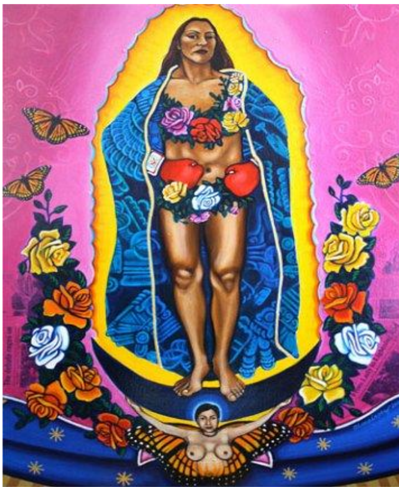
Figura 17. Our lady of controversy . Impresión digital. Alma López, 2001.

como el de Margo Glantz (2013) sobre la Malinche, o de artistas como Yolanda López 61 y Alma López –ambas herederas de la tradición crítica de chicanas como Gloria Anzaldúa– sobre la Virgen de Guadalupe (Figura 17), nos dedicaremos a destacar la impronta subversiva de las representaciones culturales de dichas figuras y su crítica al modelo de la “buena madre”. Su óptica situada como pensadoras fronterizas nos invita a pensar más allá de esta dicotomía de la madre y nos obligan a preguntarnos ¿qué hay en medio de estas dos posiciones? ¿Qué otras figuras y prácticas maternas conoceríamos si enfocáramos nuestro análisis en medio de las dos caras de la moneda? ¿Qué aprenderíamos?