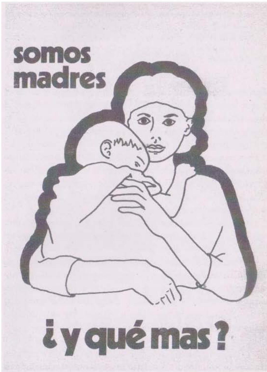
Figura 14. Folleto repartido durante el mitin del domingo 9 de mayo de 1971