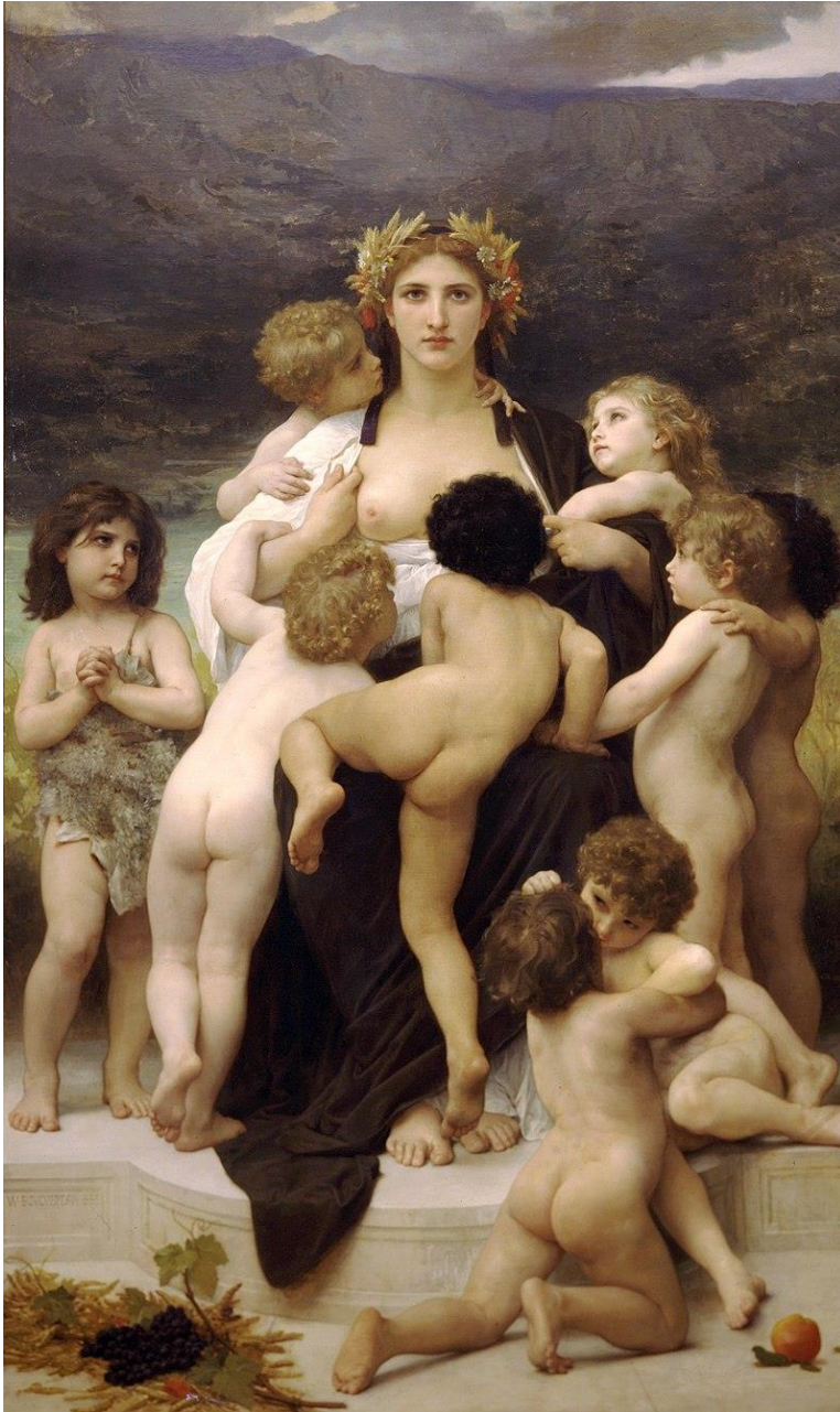
Figura 8. “Madre Patria”. Pintura de William-Adolphe Bouguereau, 1883.