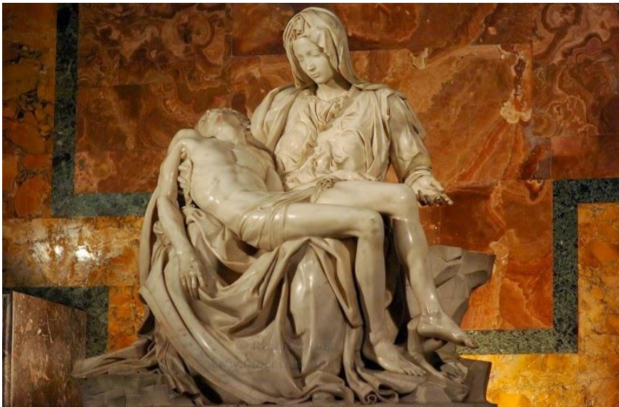
Figura 20. “La Piedad” de Miguel Ángel. Museos vaticanos (1498-1499).

Imágenes de Vírgenes como La Dolorosa o como La Piedad, de Miguel Ángel (Figura 20), son representaciones no sólo del culto mariano promovido por la fe cristiana, sino de un modelo de “madre buena” que trató de imprimirse en las conciencias de las mujeres.