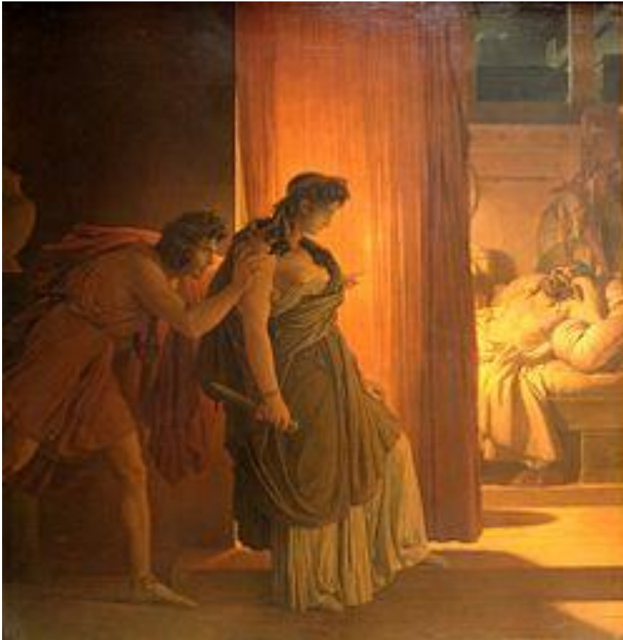
Figura 23. Clitmenestra y Egisto a punto de matar a Agamenón. Pintura de Pierre Narcise Guérin. Museo de Louvre.