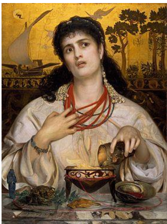
Figura 22. Medea. Pintura de Anthony Frederick Augustus Sandys (1866-1868).

Medea y Clitmenestra (Figuras 22 y 23, respectivamente), por su parte, son la antítesis de las “buenas madres” de la antigüedad grecolatina; contraejemplos morales de quienes la mujeres se han de alejar simbólicamente, a quienes habrá que temer y de cuyos mitos se extrae una lección: la “mala madre” es una excepción que sólo existe para reafirmar a su contrario, la madre abnegada: Cornelia o la Virgen madre. Sin esta dualidad pierde sentido el mandato de la madre bondadosa, quien es, siempre, definida por oposición.