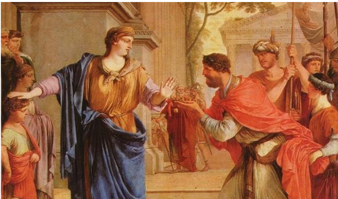
Figura 21. Cornelia rechaza la corona de Ptolomeo VIII. Cuadro de Laurent de la Hyre. Museo de Bellas Artes, Budapest.