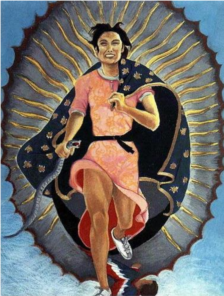
Figura 18. “La trotadora”. Yolanda López (1978).