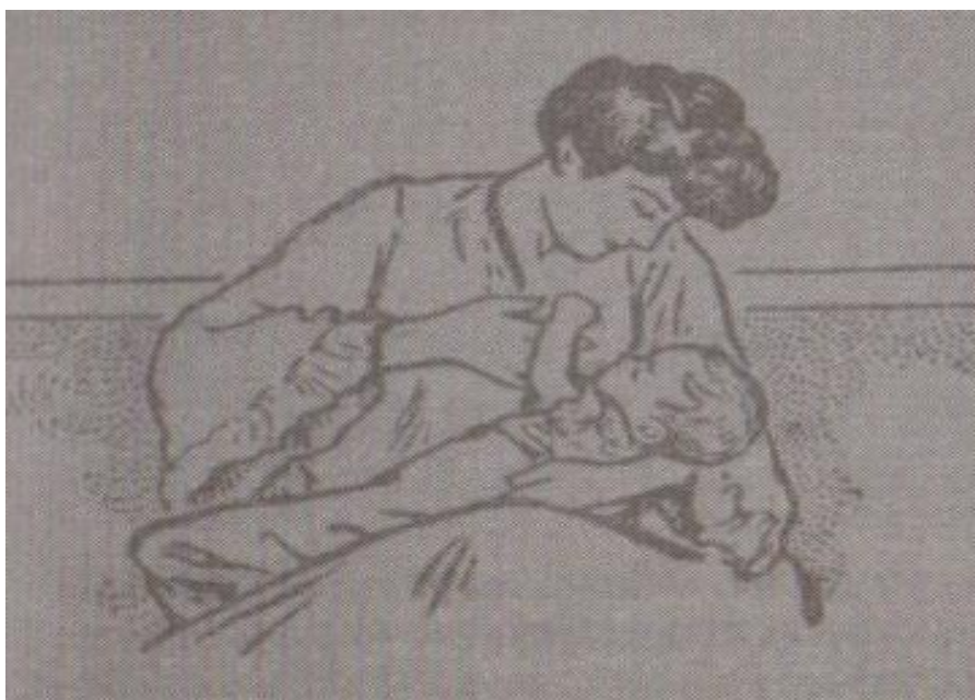
Figura 3. “La lactancia materna”

De acuerdo con esta autora dichos manuales perfilaban un determinado modelo de madre, la “buena”, empleando para ello una narrativa visual que empleaban argumentos en favor de la lactancia la cual era vista como “un acto de máxima generosidad, entrega y amor, propio de la “buena madre” (Risueño, 2010, p. 134), tal como se aprecia en la Figura 3 correspondiente a Mon libre d’histories. Lectures illustrées (enseignement primaire, cours préparatoire 25 ).O bien, a través de la representación de mujeres realizando actividades de cuidado y educación destinadas a los menores como se ve en la Figura 4, del libro Arithmétique, Cours moyen .