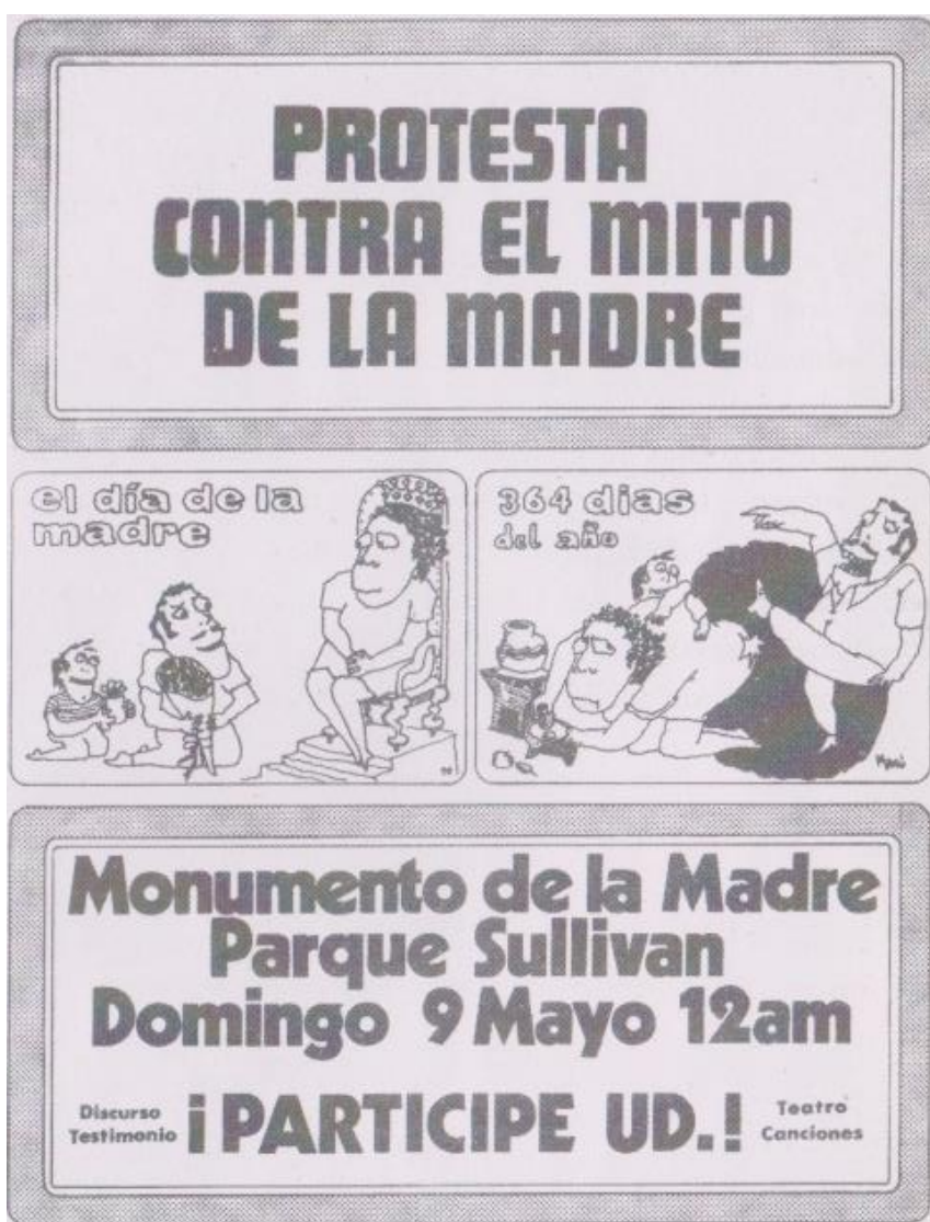
Figura 13. Volante distribuido en el acto de protesta en el monumento a la madre el 9 de mayo de 1971.

Pese a la negativa de las autoridades del Departamento del Distrito Federal para conceder permiso para una manifestación de protesta contra el Día de las Madres, el movimiento de Mujeres en Acción solidaria, efectuó ayer al mediodía en el Parque Sullivan, y donde precisamente se levanta un monumento a la madre, una manifestación de protesta con el objeto de hacer notar que el mito de la madre consiste en exaltar la función biológica de la mujer, para encubrir el hecho de que como ser pensante y autónomo no se le deje desarrollar y nada más se le permita ser el reflejo de la voluntad de hombre... (Acevedo, 2012, p. 68).