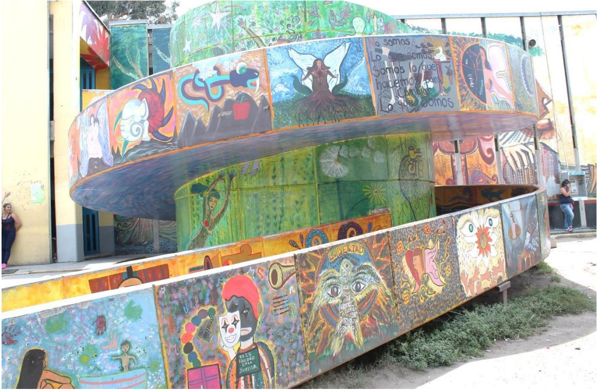
Figura 1. Entrada a la llamada “sala grande” del Centro Femenil de Reinserción Social Santa Martha Acatitla.

Por esta espiral entra y sale la visita de las mujeres privadas de su libertad.