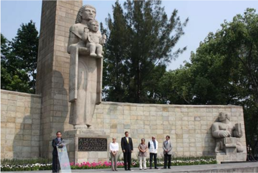
Figura 15. Reinauguración del Monumento a la madre el 10 de mayo de 2012.