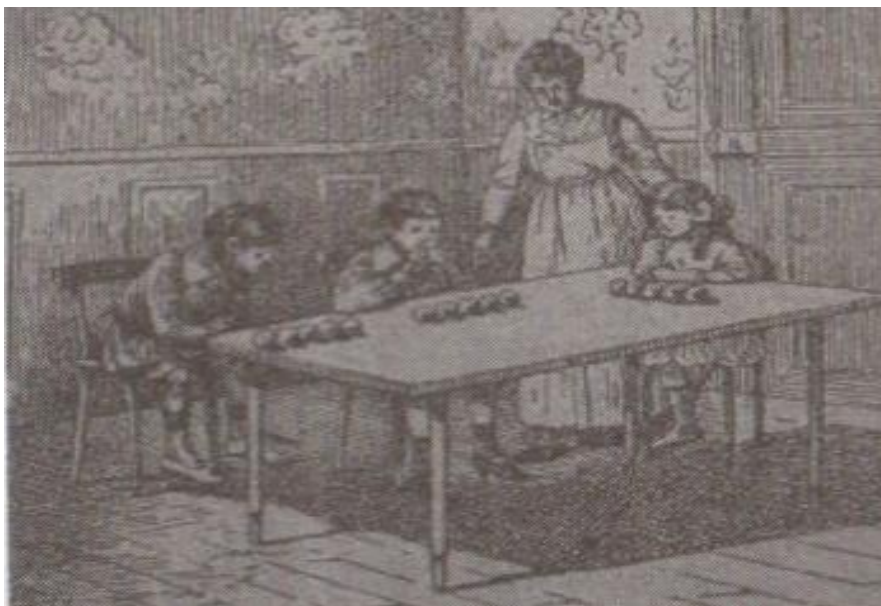
Figura 4. Modelo de madre educadora.