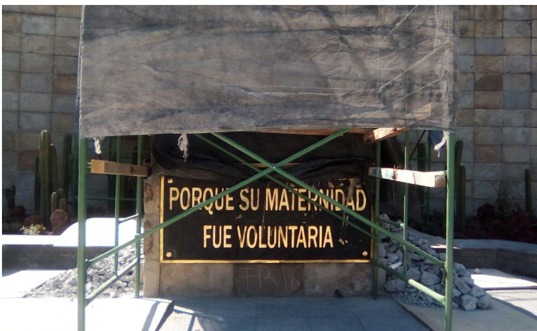
Figura 25. Foto de la base que sostenía a la figura de la madre en el Monumento.

Ante tal panorama, queda entonces la pregunta de si tras una intensa actividad crítica, analítica, reflexiva, sobre lo que supone venerar a “la buena madre”, y de la que pretende ser partícipe esta investigación, pueda, aquella, sucumbir.