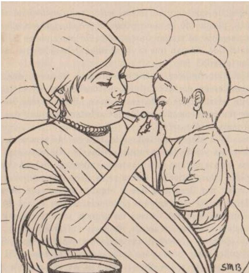
Figura 10. Ilustración del Libro para la madre mexicana , (1933, p. 118).

Con ello se muestra la distinción entre lo correcto y lo indeseable en clave racial o clasista, puesto que se atribuye una supuesta ignorancia aséptica a cuerpos predominantes en el ámbito rural o bien, pertenecientes a clases sociales modestas, y por otro lado, se asigna el buen manejo de los cuidados del menor a cuerpos femeninos modernos y del ámbito urbano.