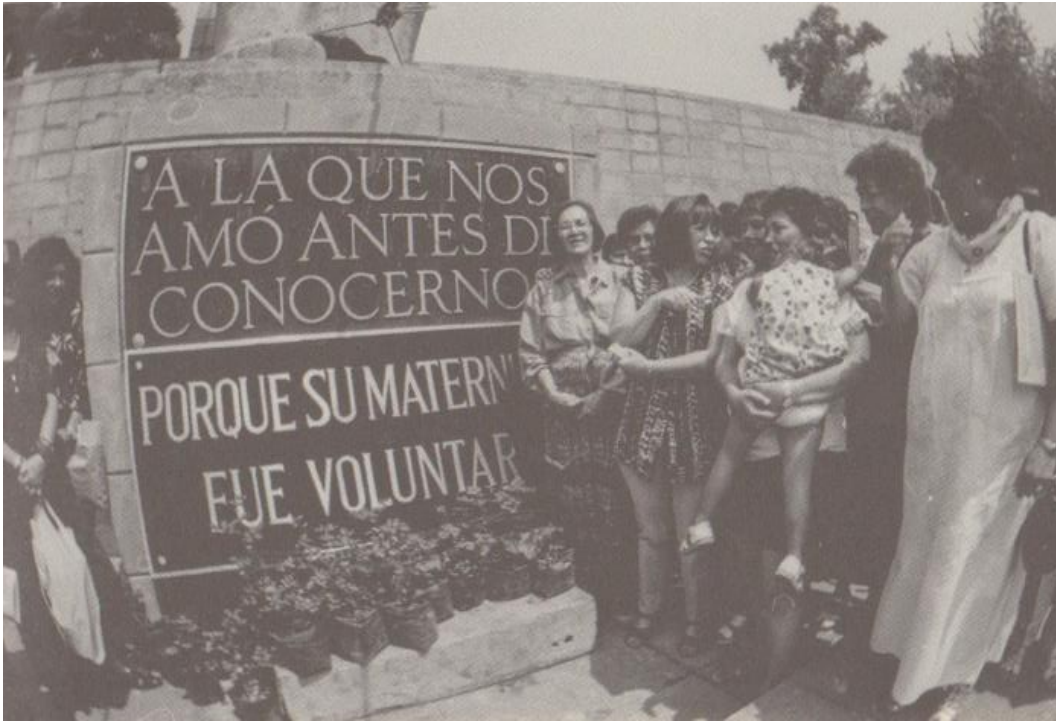
Figura 7. Activistas interviniendo el Monumento a la madre para colocar la segunda placa (1998).

judicialmente, fue el monumento a la madre, situado en la calle Sullivan de la Ciudad de México.