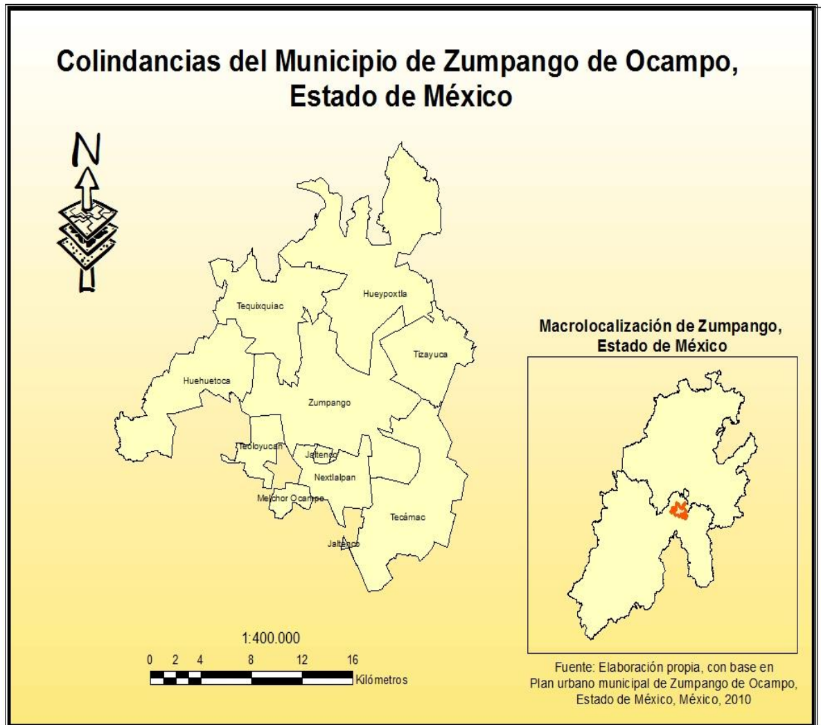
Mapa No. 3

Hacia 1604, Zumpango de la Laguna y su comarca experimentaron una marcada congregación, desapareciendo muchos sitios poblados, gente hispana invadió su territorio, grandes extensiones de tierra fueron agregadas por el oriente a la Hacienda de Santa Lucía, por el sur, a la Hacienda de Santa Inés, por el poniente la Hacienda de Xalpan, las tres jesuitas, además de otras extensiones amplias que se les adjudicaron a personas provenientes de España. No obstante, en 1711 contaba con una sabana (Laguna de Zumpango), un sitio de ganado y 28 caballerías de tierra, equivalentes a cerca de 157 kilómetros cuadrados (GEM, 2008)