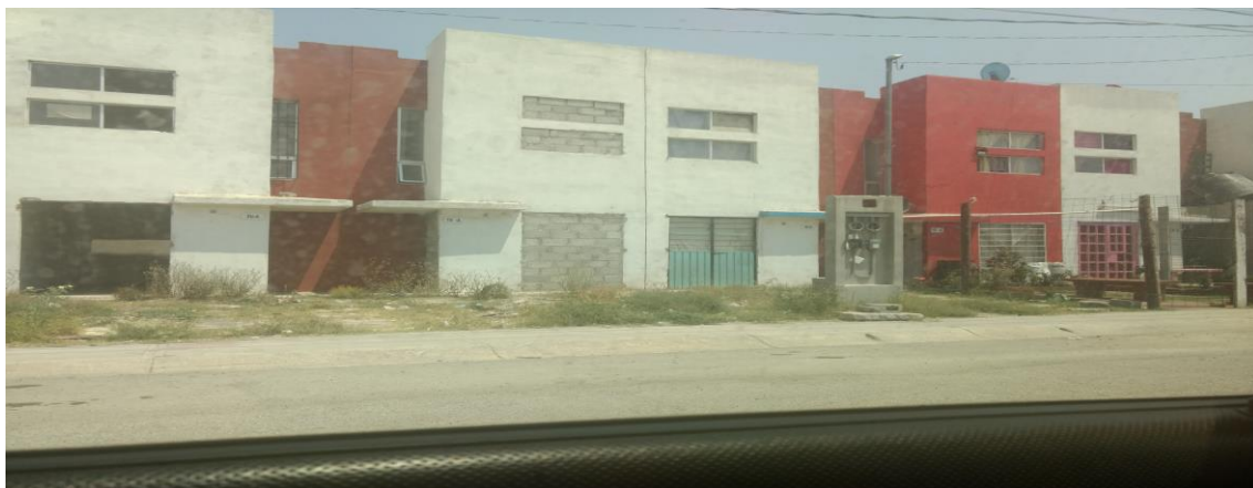
Imagen No. 5 Vivienda Abandonada