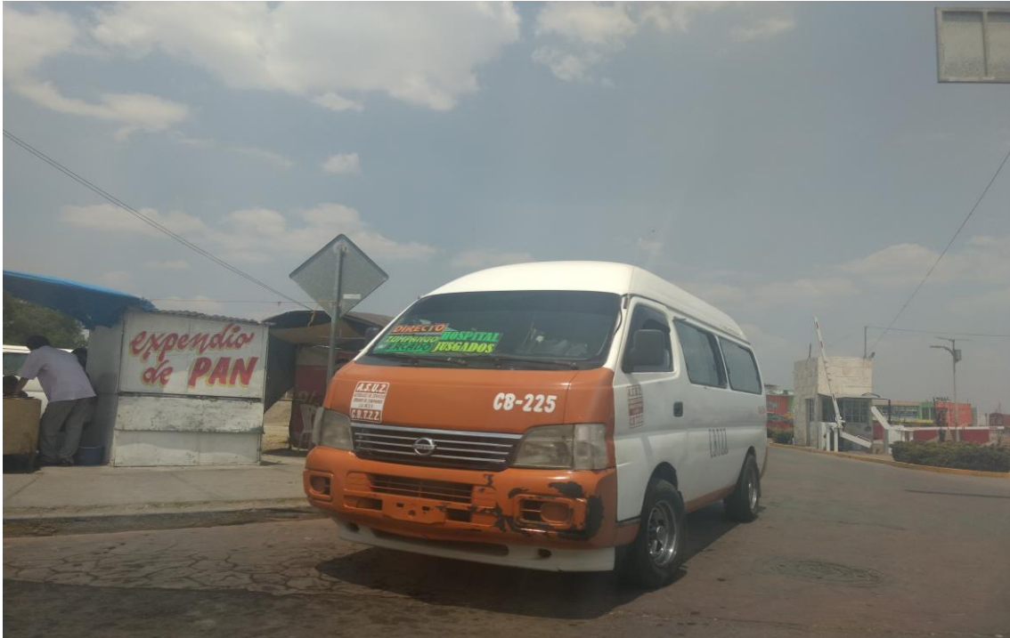
Imagen No. 1 Transporte en Zumpango