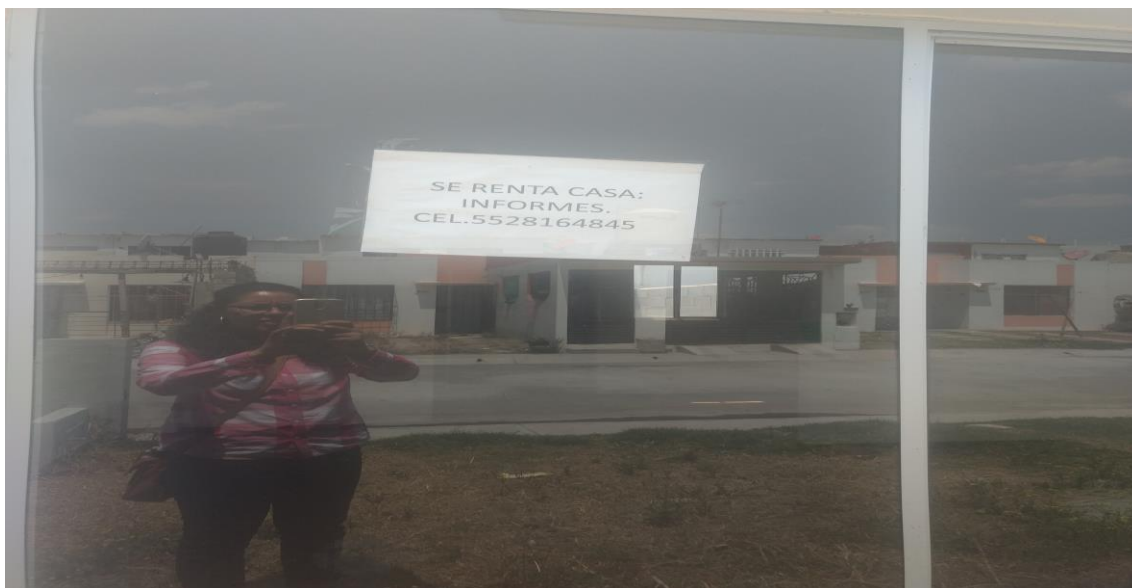
Imagen no. 4 Vivienda en renta