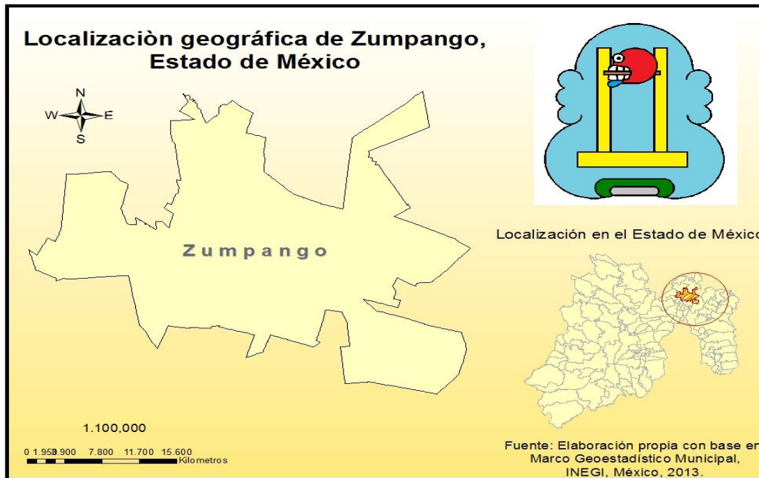
Mapa No. 2

Aunado a lo anterior se pensó que en Zumpango era el lugar ideal para habitar por población con ingresos a menores a tres salarios mínimos, dedicándose a actividades económicas sencillas, específicamente a oficios.