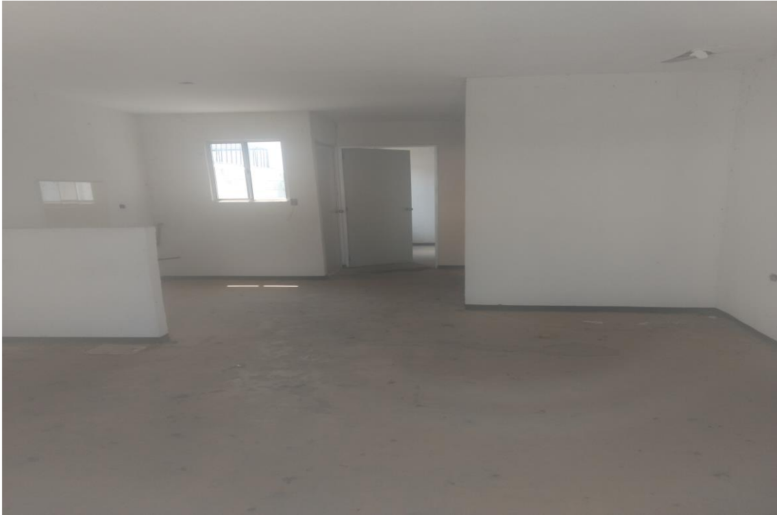
Imagen No. 2 Interior de la vivienda, Fraccionamiento Santa Fe