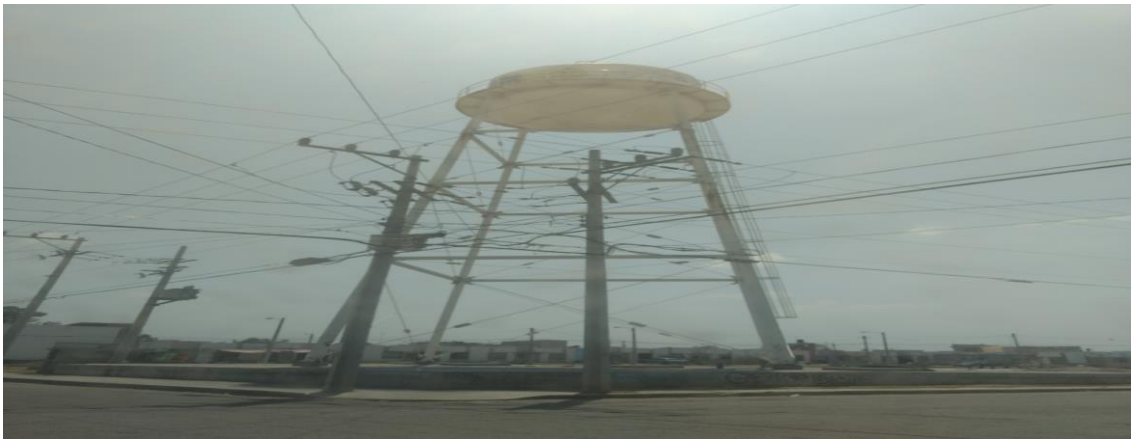
Imagen No. 6 Tanques de Agua