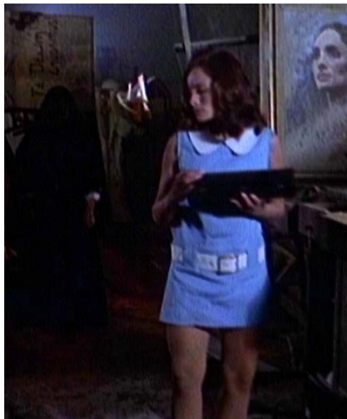
Imagen en la cual se juntan en una sola secuencia, el mismo personaje, cuya técnica causaba asombro e incredulidad en el espectador.

La temática por demás explotada y casi se puede apreciar este recurso de la utilización de personajes sobrenaturales interpretados por los actores de momento, una disciplina en los filmes del Santo, que contrario a una provocación de miedo, en el espectador producía curiosidad por saber la forma tecnológica de juntar un actor con dos personajes en un solo escenario.