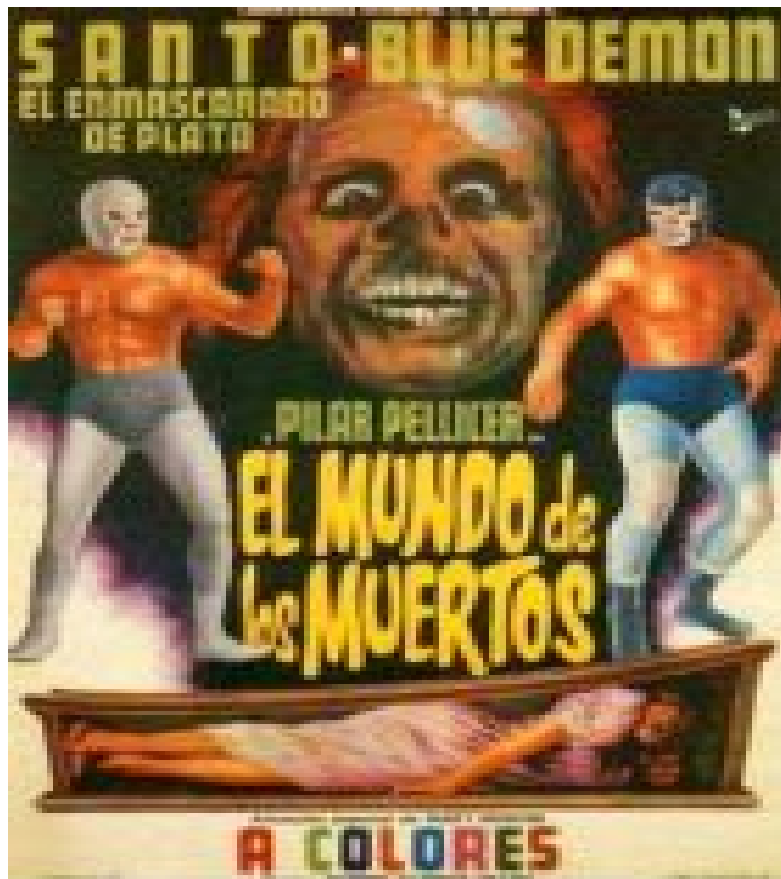
El cartel promocional del filme en 1969 con la novedad que se proyectaría a color

La perturbación a la que sometemos a nuestra mente, ante un acontecimiento que sobre pasa los límites de nuestra credibilidad sin hallar explicación lógica y científica, suele estar inmersa en el imaginario colectivo, producto de un intencionado desorden mental que el autor de cierta obra pretende inducir en busca del asombro o miedo.