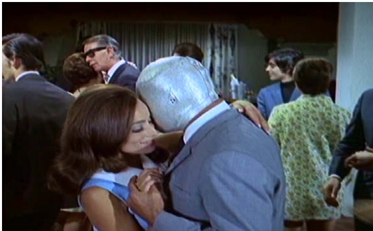
Imagen en la cual se aprecia la clásica imagen del Santo entre la sociedad moderna.

Se ubica posteriormente en una época llena de prejuicios y modas de una sociedad joven que se encuentra inmersa en las tendencias extranjeras e influencias socioculturales en las que la figura del Santo comienza a ser icono de esta sociedad.