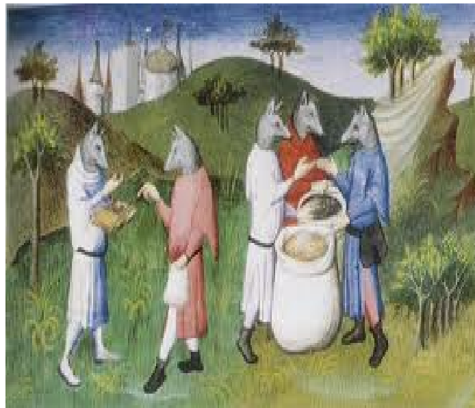
Un grabado según los relatos de los viajes de Marco Polo donde narro según en un viaje a la

Podemos caer en la confusión que algunos aspectos contenidos en el filme tengan en su interior elementos como lo son lo fantástico-extraño, lo maravilloso, lo fantástico -maravilloso, lo extraño, lo fantástico y lo verosímil.