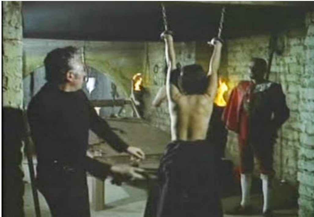
Imagen del filme Santo y Blue Démon en el Mundo de los Muertos donde se puede apreciar la acción de azotar a los simpatizantes del diablo.

En este mundo reprimido y lleno de figuras y objetos profanos, el personaje de El Santo no es más que la fuerza del bien a quien se debe combatir.