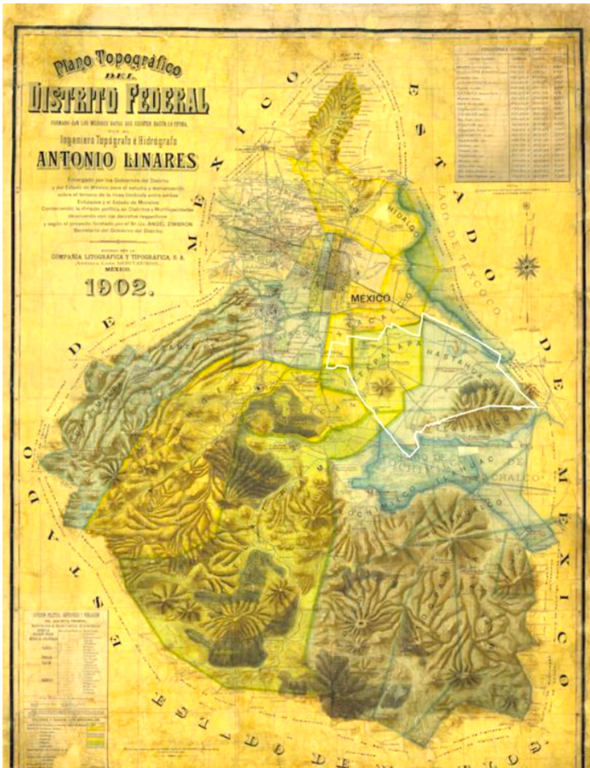
(Plano topográfico del Distrito Federal, trazado en el año de 1902 por el Ing. Antonio Linares.)