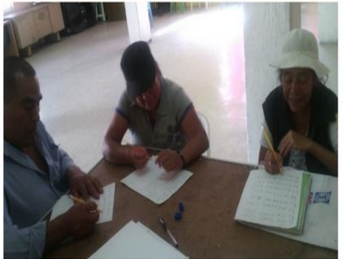
Fotografía 1. Collage con fotos del Programa Alfabetización. Elaboración propia a partir de entrevistas.