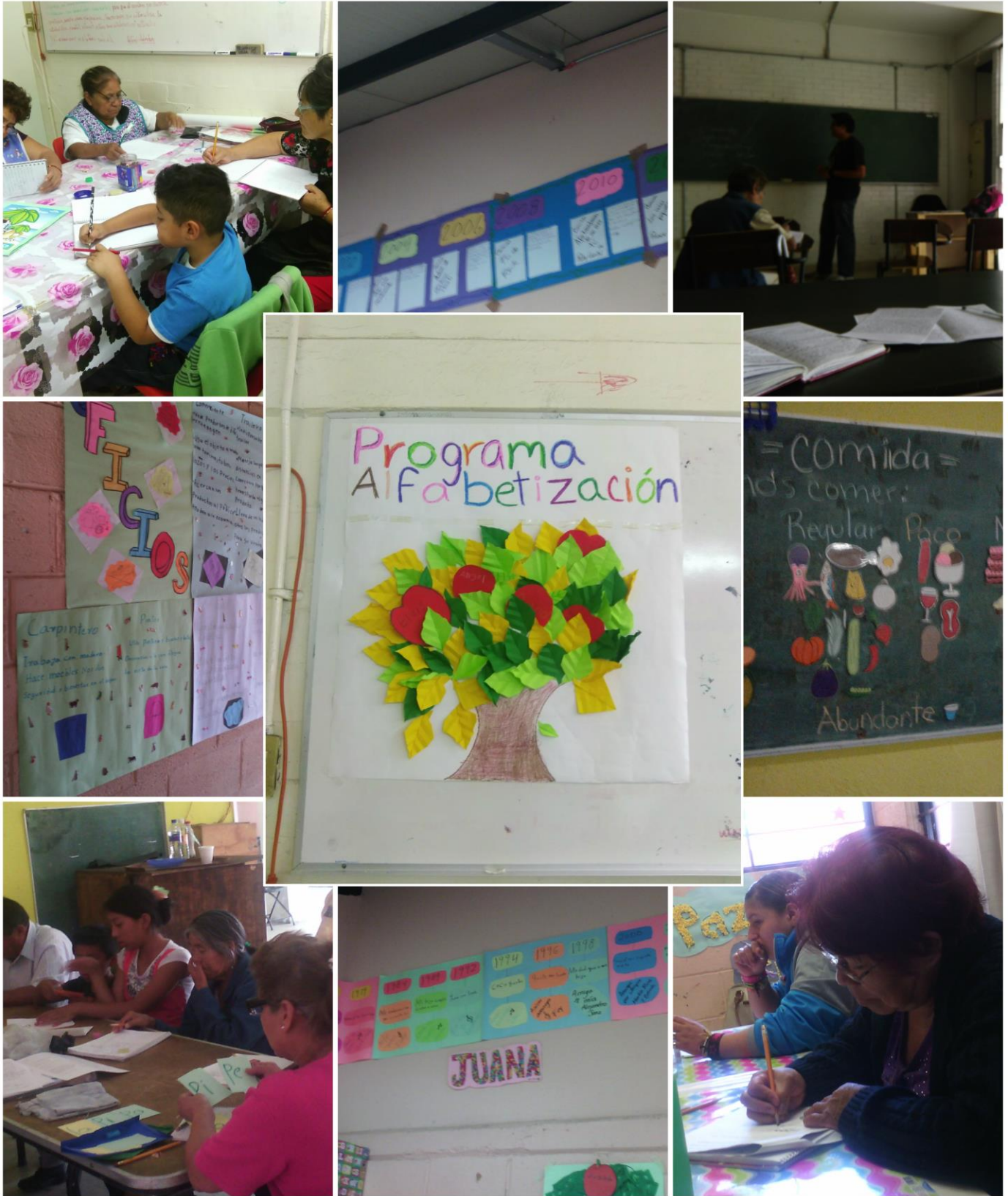
Fotografía 3. Collage con fotos del Programa Alfabetización. Elaboración propia a partir de entrevistas.