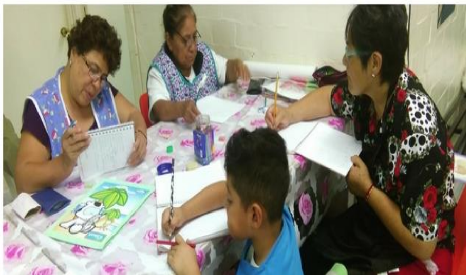
Fotografía 2. Collage con fotos del Programa Alfabetización. Elaboración propia a partir de entrevistas.