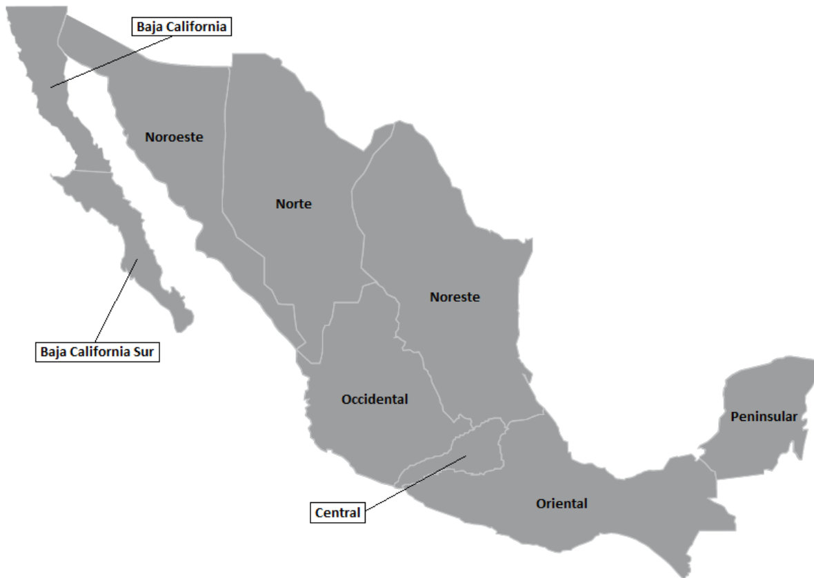
Figura 1. Mapa del Sistema Eléctrico Nacional 7