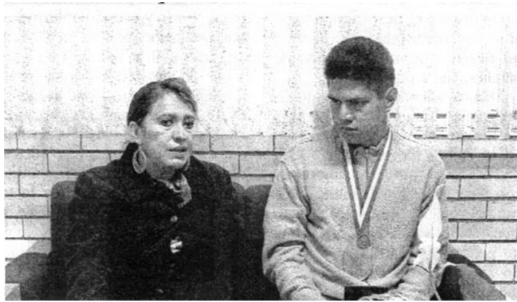
COMUNIDAD * enero 19, 2009