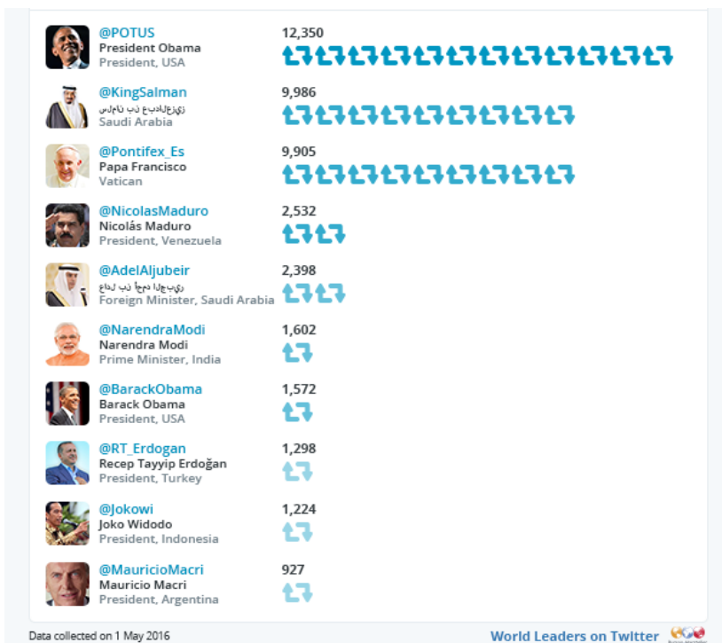
Ilustración 1 Retweets de los líderes mundiales en Twitter

.Twitplomacy, Twitplomacy Study 2016 [En Línea], 31 de mayo de 2016, Dirección URL: http://twitplomacy.com/blog/twitplomacy-study-2016/ (Fecha de consulta 8 de abril de 2017).