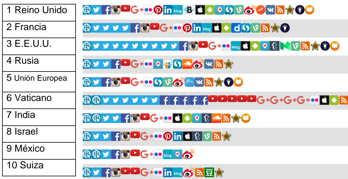
Ilustración 4 Redes sociales virtuales más usadas por los países

Dijital Arařtırmalar Derneđi, Digital Diplomacy Review 2016 [En Lnea], 2016, Direccin URL: http://digital.diplomacy.live (Fecha de consulta: 4 de mayo de 2017).