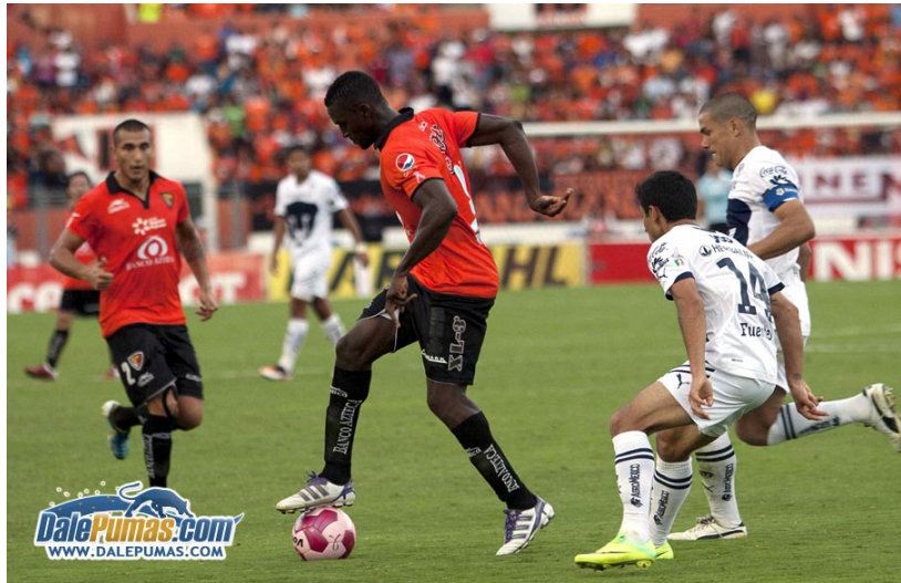
Figura 21. Jaguares inmisericorde, arrasó con los universitarios en todos los encuentros en los que se presentaron a lo largo del torneo.