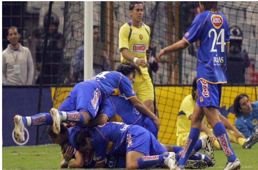
Figura 12. Cuatro fueron las veces que los Tigres festejaron aquel 4 de diciembre del 2005. En esta imagen, la emoción fue total para ellos y la decepción recayó sobre las Águilas. http://bit.ly/2r8wQSH

Dicha derrota de igual manera además de ser la primera para un campeón entre 2005 y 2012, reafirmó la teoría de la maldición del superlíder y de paso dejó en claro que ni ligando más de 30 encuentros sin derrota, ni ganando por dos goles en una serie a ida y vuelta ni mucho menos siendo campeón de campeones, se puede aspirar a ser bicampeón cuando el exceso de confianza se apodera del equipo completo.