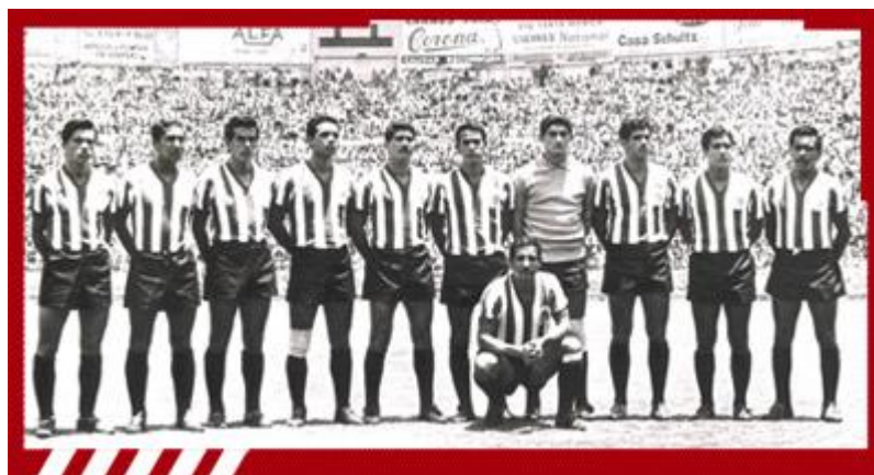
Figura 4. El plantel rojiblanco de 1964, a minutos de jugar un partido.