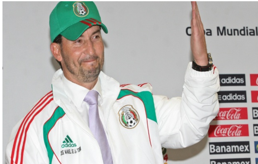
Figura 17. Momento en el que José Manuel de la Torre fue presentado como técnico de la selección mexicana en octubre de 2010; su club lo resintió posteriormente http://bit.ly/2qoduvz

“Tomando en cuenta que el torneo anterior fuimos campeones con prácticamente el mismo equipo, no nos queda nada grato el presente certamen”, de esta manera fue como José Manuel de la Torre, director técnico del Toluca, se refirió en conferencia de prensa al hecho de que su equipo ni siquiera entrara a la liguilla luego de haberse coronado en el Torneo Clausura 2010.