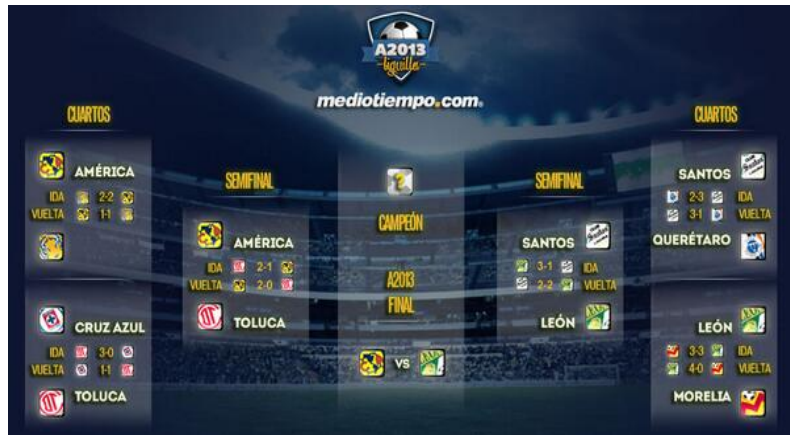
Figura 29. Este fue el camino que siguió aquel América, quién por culpa del recién ascendido León, no logró unirse a Pumas como los únicos bicampeones del futbol mexicano en torneos cortos.