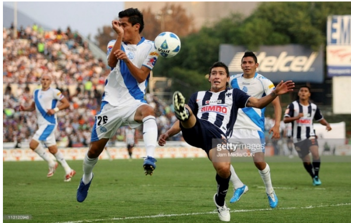
Figura 23. Monterrey luchó con todo lo que pudo frente a Puebla logrando el empate pero aun así no aseguraban su pase a la liguilla