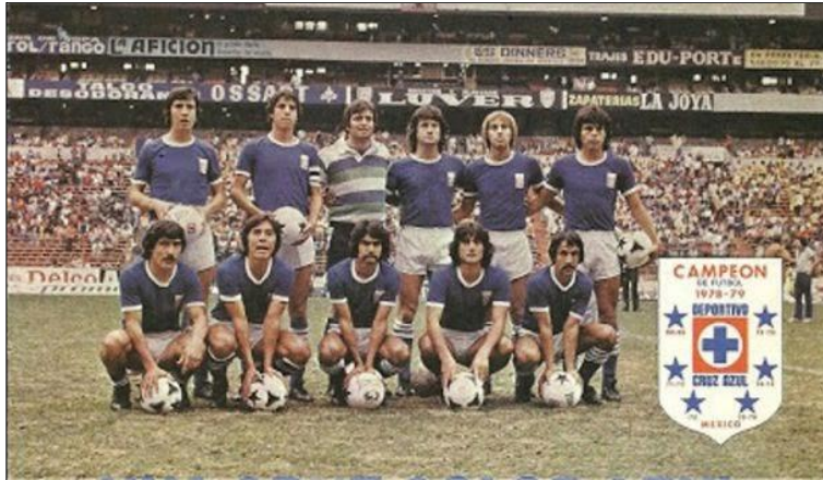
Figura 6. Titulares cementeros campeones en la temporada 78-79 http://bit.ly/2bNpjQq