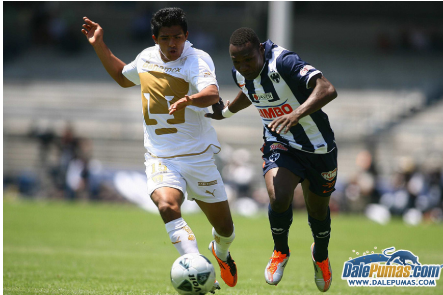
Figura 24. Tras un primer partido victorioso, el equipo regio no logró mantener la ventaja siendo eliminado de la competencia por los universitarios. http://bit.ly/2mh1bdB