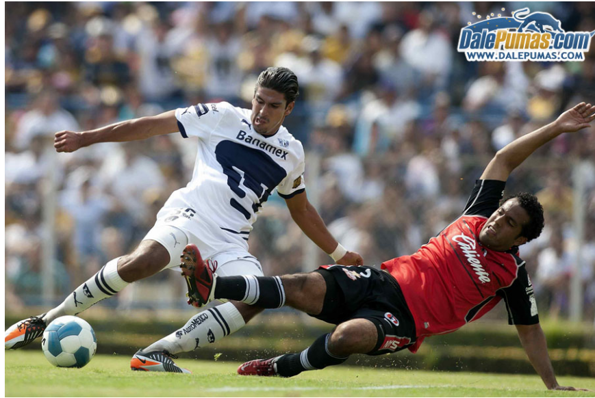
Figura 22. Xolos empató con Pumas y por estadísticas generales, los felinos quedaron fuera de la “fiesta grande” del futbol mexicano http://bit.ly/2mQyUyi