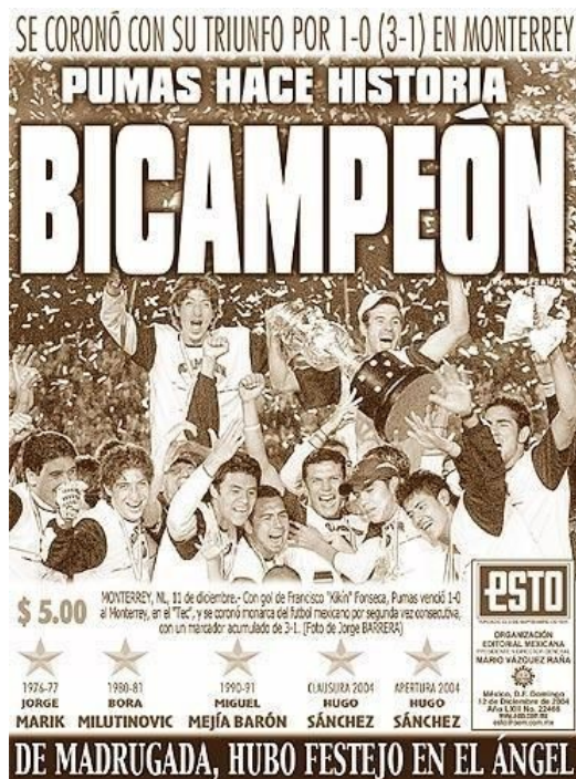
Figura 9. Portada del periódico Esto con el equipo felino levantando el título allá en Monterrey. http://cdn.incondicionales.com.mx/media/galeria/2F324%2F7%2F5%2F8%2F8%2Fn_pumas_unam_historia-1148857

Ya allá el trámite de la serie fue más sencillo y más con la victoria de 2 goles a 1. De esta forma ya solo el Monterrey separaba a los felinos de repetir como campeones. Para la ida, jugada el 8 de diciembre, el Olímpico Universitario se volvió vestir de gala, a lo que los locales respondieron venciendo 2 por 1 a unos regiomontanos dirigidos por Miguel Herrera.