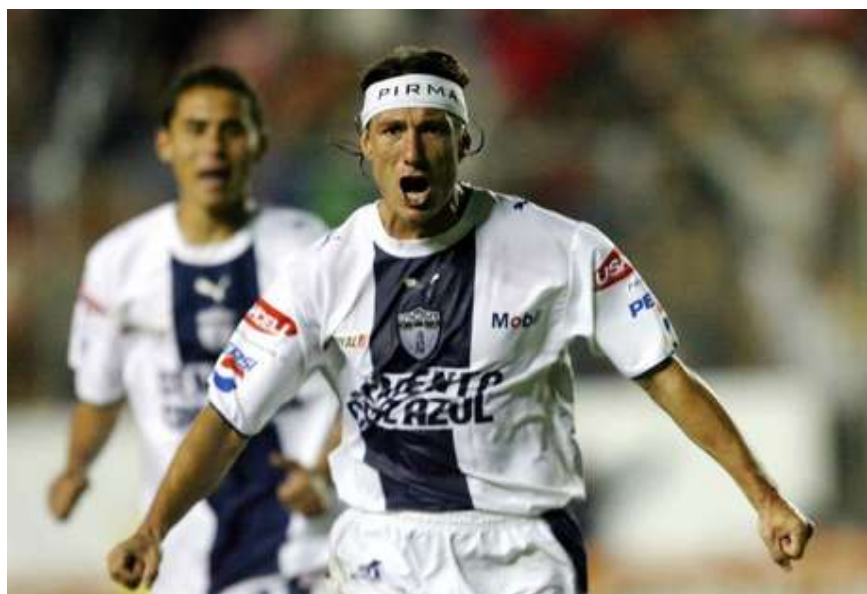
Figura14. Caballero rugiendo con potencia al ser uno de los jugadores con mayor número de liguillas disputadas con el mismo equipo.

Sea como sea, cábala, estadística o cualquier justificación que podamos darle no cambia el hecho de que Pachuca, teniendo la oportunidad de coronarse bicampeón echó por la borda la oportunidad de conseguir el título nacional.