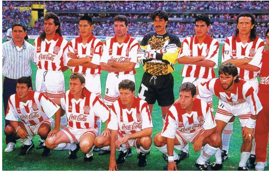
Figura 8. Una base de mexicanos y uno que otro extranjero, conformaron al Necaxa de la temporada 94-95 http://bit.ly/2c6Lou9