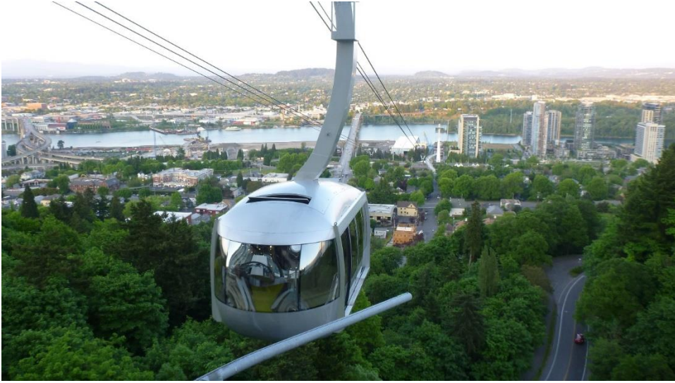
Figura 3.5 Oregon Health Sciences Cableway

operador que abre las puertas de la cabina hasta llegar a las estaciones, permitiendo a los pasajeros descender. El costo del viaje redondo es de 4.35 dolares.