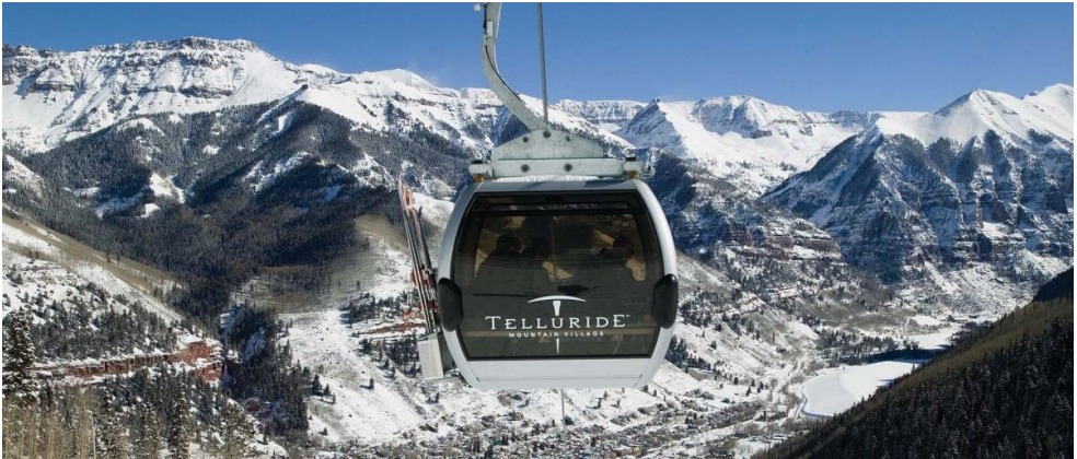
Figura 3.6 Mountain Village Gondola

la renovación de las unidades fue de 8 millones de dólares. El costo promedio de operación y mantenimiento anual de este teleférico es de 3.5 millones de dólares, que incluyen 82 000 horas laborables, el mantenimiento de 59 cabinas y 100 000 horas de operación de estas.