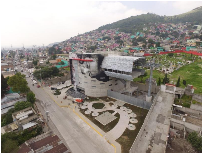
Figura 1.1 Mexicable Ecatepec

La justificación de esta investigación sirve para atender la demanda de transporte público a través de medidas complementarias, con un modo de transporte adecuado a las necesidades de la ciudad.