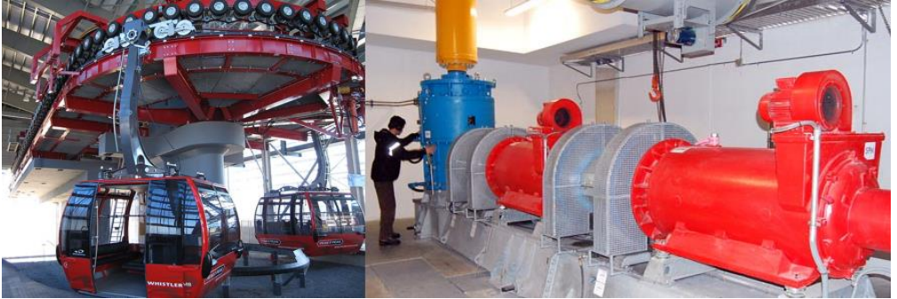
Figura 4.6 Vista de la polea de retorno (rueda deflectora) y la sala de máquinas del sistema “Peak 2 Peak” en la Columbia Británica, Canadá.

La polea de retorno está en la estación terminal, al extremo opuesto del motor impulsor, y junto con otros elementos menores como frenos y amortiguadores, permite que el cable transportador esté adecuadamente tensionado y pueda realizar su recorrido de regreso, en el extremo terminal del sistema de teleférico.