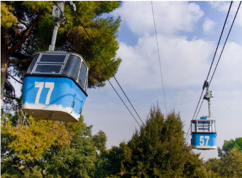
Figura 3.2 Teleférico de Madrid

Fuera de la estación, los cables son guiados a través de las estructuras de soporte. En el área de circulación, existen dos cables tractores que pasan por la línea de soporte, estos cables se encuentran permanentemente anclados al final de la línea, que regularmente es el extremo superior, y se mantienen en constante tensión por el contra peso que se encuentra al otro extremo. Cada una de las secciones de los cables tractores tiene un sentido de movimiento y estos están unidas en monorriel de sobre carga. El cable tractor puede ser tensado por un contrapeso al final de la línea o con un tensor hidráulico. El movimiento en el cable portante es generado por un motor eléctrico en la estación.