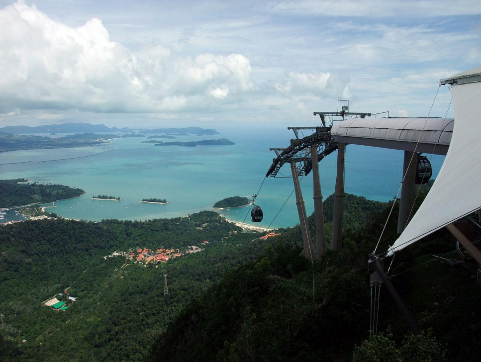
Figura 4.7 Vista panorámica desde estación del “Langkawi Cable Car”, ubicado en Langkawi, Malasia.

Para el diseño de un sistema de teleférico se requieren varios diseños menores pero que definen al proyecto ejecutivo: uno de tránsito, para determinar el tamaño y características del sistema en cuanto al volumen de carga o de pasajeros requeridos; un diseño estructural para el sistema de soporte, que involucra cimentaciones, estructuras de concreto y acero, para las torres de carga y las estaciones; un diseño arquitectónico para enmarcar el sistema dentro del entorno urbano; un diseño eléctrico para el sistema de alimentación, transporte y utilización de la energía eléctrica en el sistema, y comunicaciones; un diseño hidrosanitario, para las redes de acueducto y alcantarillado, que se afecta por la construcción del sistema y por los requerimientos del mismo; un diseño mecánico, para el subsistema de tracción; y en fin todos los diseños adicionales para un sistema completo. Aunque los diseños básicos que juegan el papel principal dentro del sistema de transporte de teleférico son: el sistema de soporte, de carga y el de tracción.