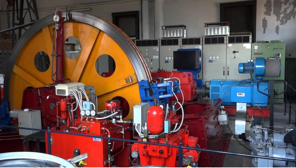
Figura 5.5 Vista interna de la sala de máquinas del teleférico “Como-Brunate”, provincia de Como, Italia.

El sistema de tracción está conformado por el cable transportador, todas las series de poleas que dan soporte en las torres intermedias a lo largo del recorrido y dentro de las estaciones y por dos fundamentales elementos ubicados en la estación de partida y estación de retorno: el motor impulsor y la polea de retorno, respectivamente.