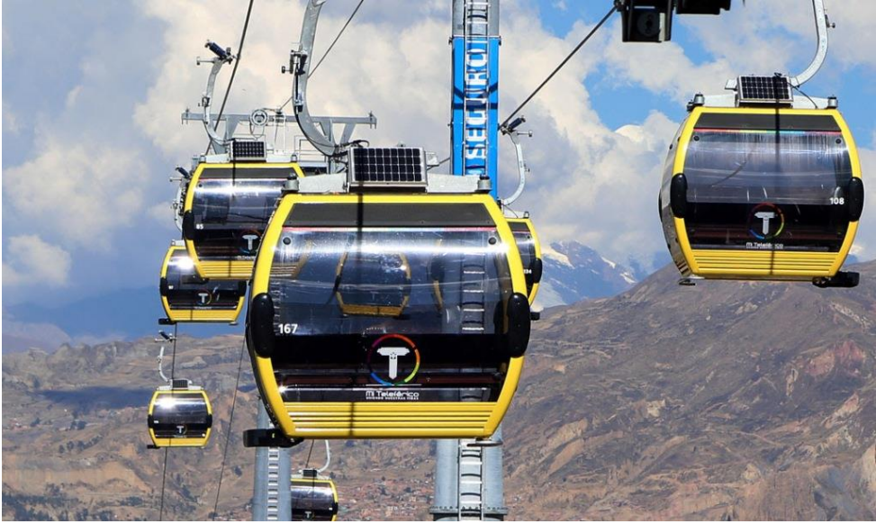
Figura 3.8 Mi Teleférico de La Paz

Argel en Argelia es considerada la cuna del transporte urbano de pasajeros por teleférico. Es el líder mundial en la adopción de esta tecnología como modo de transporte público. Argelia cuenta con 16 teleféricos operando y otros 9 en proceso de planeación o construcción.