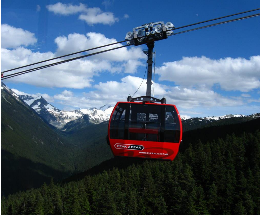
Figura 4.2 Góndola que forma parte del teleférico de triple cable “Peak 2 Peak” en Whistler-Blackcomb, cerca de Vancouver en la provincia de la Columbia Británica, Canadá.

No obstante, existe la posibilidad de ajustar la capacidad de estos sistemas a base de cables durante fluctuaciones periódicas en la demanda. La práctica internacional más común consiste en modificar la velocidad de tracción del cable, es decir, al reducir la velocidad del cable se incrementa el tiempo de recorrido, pero se ahorra significativamente el consumo de energía en el sistema. De igual forma, también es posible variar el número de góndolas en el servicio, aunque esta práctica incrementa de manera considerable los costos de operación. Finalmente, la mejor recomendación para mantener un nivel de servicio satisfactorio para la demanda es optimizar los planes de mantenimiento y chequeo, ya que éstos son esenciales para las operaciones anuales. Los planes deben estar cuidadosamente planificados desde el momento de diseño del sistema, dependiendo del tamaño de la demanda a futuro y lógicamente considerando el uso rudo de los equipos de servicio.