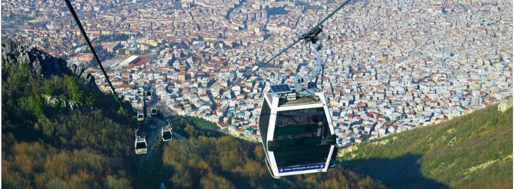
Figura 3.1 GD8 Bursa I + II + III

El GD8 Bursa I + II + III es el teleférico monocable más largo del mundo; une la ciudad de Bursa en Turquía con la zona montañosa de Uludağ .