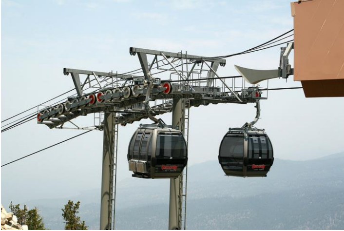
Figura 4.3 Sistema de soporte del “The Gondola Ride” en el Lago Tahoe, South Lake Tahoe, California.

Las estructuras de soporte pasan por varias estaciones a lo largo de su recorrido, que a su vez son parte del sistema de soporte y conforman los edificios (en el caso de sistemas más modernos) donde la gente accede al sistema, compra su tiquete (si es el caso), y se ubica sobre zonas seguras de acceso (como ocurre en un sistema de metro), mientras las vagonetas transitan junto a andenes, lentamente, con las puertas abiertas para que la gente suba o baje. Una vez las vagonetas abandonan las estaciones, se cierran las puertas y toman velocidad hacia la estación siguiente.