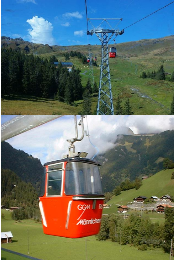
Figura 4.1 Sistema de góndolas ubicado en los Alpes Suizos que conecta una serie de pequeños cantones en Suiza.

espacio, o para el ingreso de una silla de ruedas, por ejemplo. Los materiales de las sillas son los que se usan en cualquier sistema de transporte: fibra de vidrio, plástico, lona, espuma, entre otros. El diseño tanto interno como externo de las vagonetas depende mucho la ubicación del proyecto, la cultura de la zona de estudio, el presupuesto de la obra, la demanda a futuro esperada, el tamaño de las estaciones de entrada y salida, la topografía de la zona y del acceso a los materiales para la construcción en masa de la serie de vagonetas.