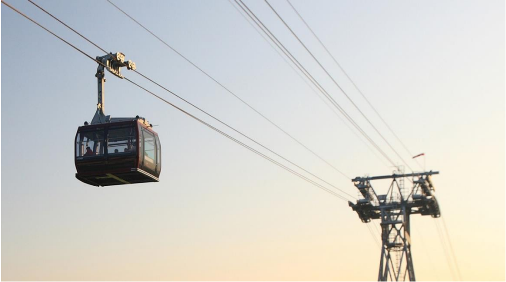
Figura 3.3 TD35 Ritten / Renon