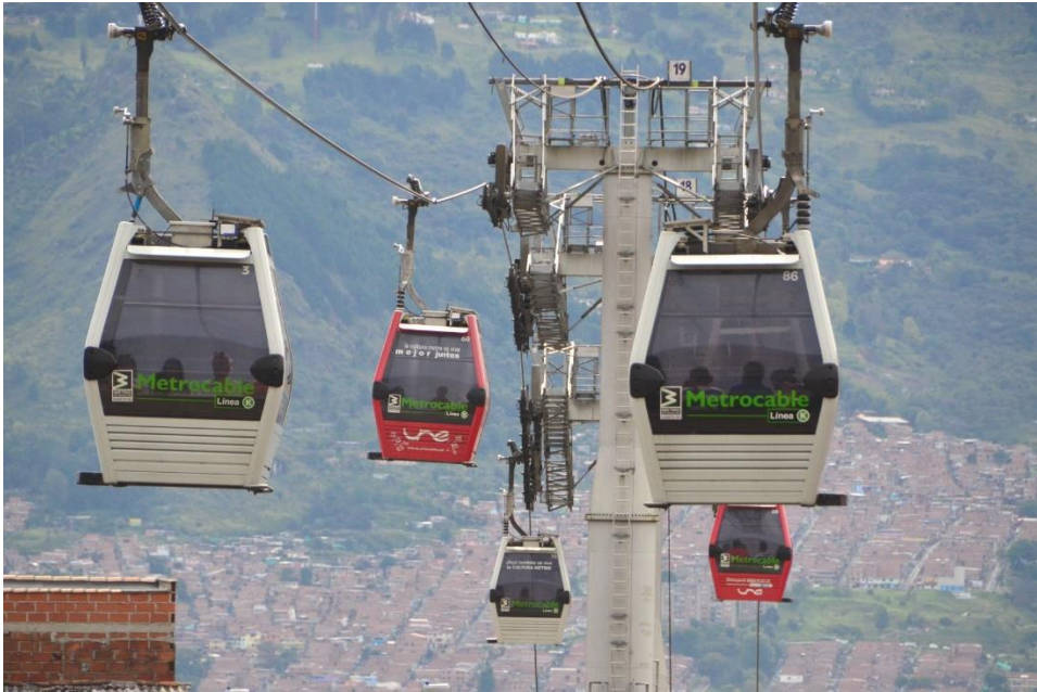
Figura 3.7 Metrocable de Medellín

El sistema que utiliza el metrocable de Medellín es una góndola monocable con cabinas para 10 pasajeros cada una, con una frecuencia variable, que depende de la demanda que tenga el servicio a lo largo del día. Las góndolas se mueven a lo largo de 3 líneas en 10 estaciones que componen el metrocable de Medellín, estas son suspendidas por un cable tractor, que se encuentra siempre en movimiento. Para que las cabinas puedan bajar la velocidad en el área de ascenso y descenso se hace un cambio de cable a uno de menor velocidad que circula únicamente a en las estaciones, esto permite que la cabina se desplace más lento, lo que ayuda al fácil acceso de los pasajeros o de ser el caso, el descenso. La velocidad máxima de este sistema es de 19 km/h, la capacidad máxima es de 3 000 usuarios por hora por dirección. Antes del metrocable, el traslado de los residentes de Santo Domingo en algunas horas del día podía exceder las 2 horas de traslado, el teleférico reduce 30 minutos ese mismo trayecto, haciendo incluso más eficiente el flujo vehicular, por no ser invasivo.