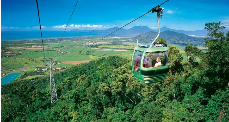
Figura 6.1 Skyrail Rainforest

helicópteros para la instalación de las torres como un medio para reducir la necesidad de construcción de carreteras.