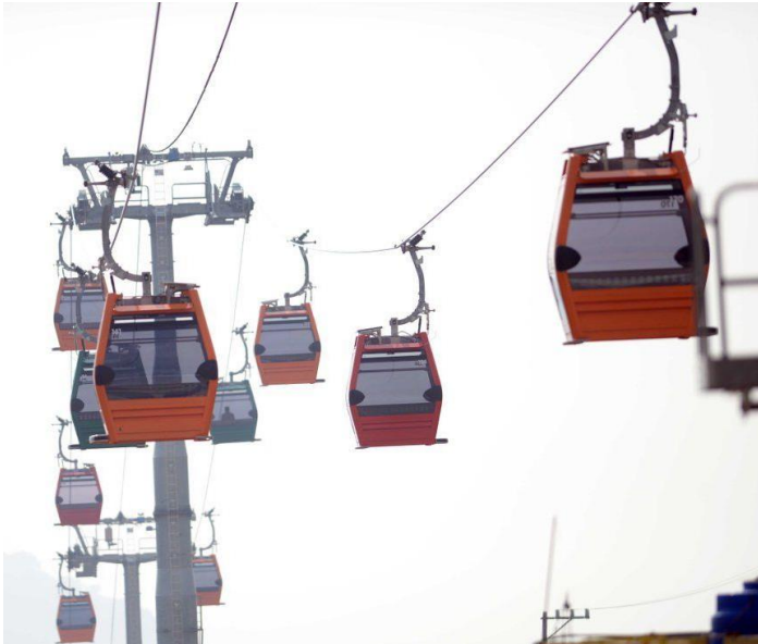
Figura 3.9 Mexicable Ecatepec, México.

9 En México , está el primer teleférico urbano en Ecatepec de Morelos del país. Son dos telecabinas independientes conectadas a través de una estación de intercambio, que conectan la Vía Morelos con San Andrés de la Caña. En este teleférico existen distribuidas siete estaciones para el ascenso-descenso de pasajeros distribuidas de manera estratégica para optimizar el traslado de la población de la región, cabe resaltar que en este proyecto se trasladaran 3 000 personas por hora y trabajara 17 horas cada día. Anteriormente, el tiempo de traslado para esta ruta sobre el suelo es de 45 minutos, con este teleférico el tiempo se reduce a 20 minutos, lo que además representa una solución para aliviar el flujo vehicular en esa zona y mejorar la apariencia del lugar.