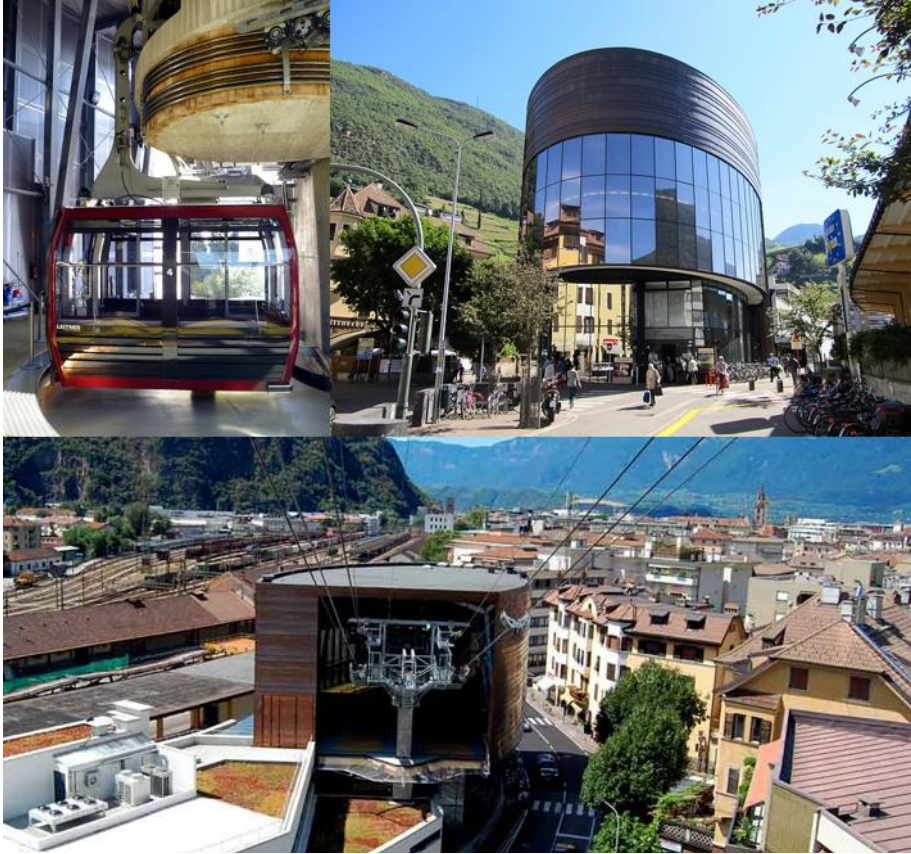
Figura 4.4 Vista de la góndola y estación principal del sistema de teleférico “Funivia del Renon”, ubicado dentro del territorio de Bolzano, al noreste de Italia.