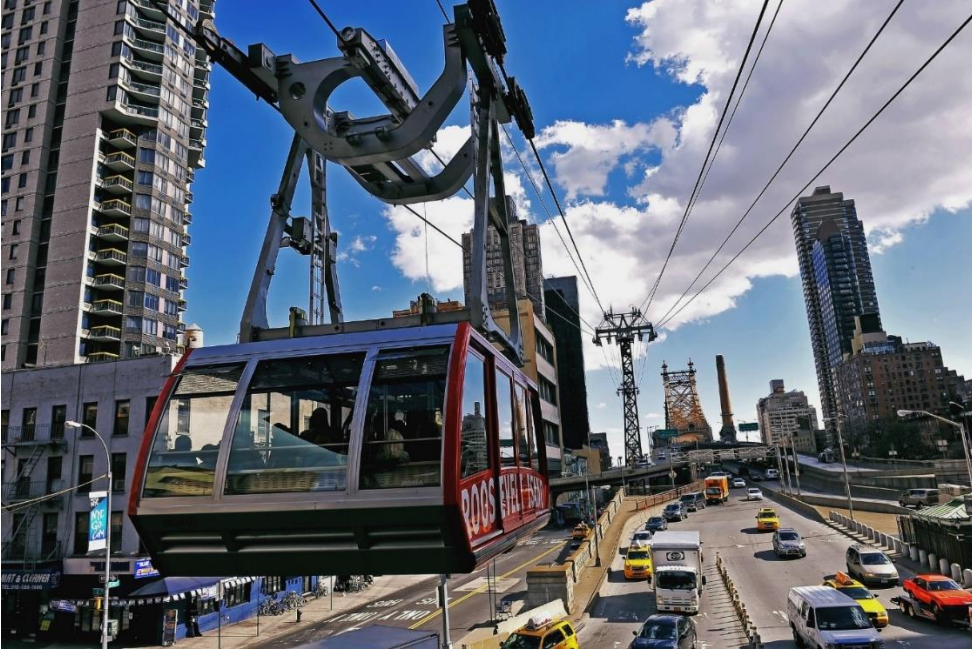
Figura 3.4 Roosevelt Island Aerial Tramway

usuarios, tanto residentes y trabajadores, viajaban a Manhattan conduciendo o tomaban un tranvía que los llevaba a Queens y luego cruzaban a través del puente de Queensboro a Manhattan, un viaje que tomaba 20 minutos. Ahora, con el teleférico de Roosevelt, este trayecto es de 3 a 5 minutos.