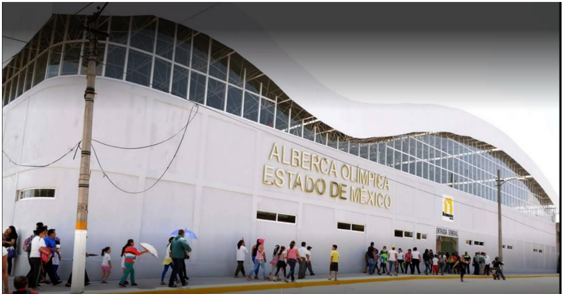
Exterior: Alberca Olímpica de Nezahualcóyotl, Estado de México.