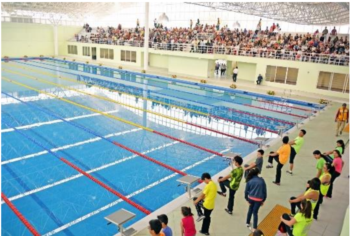
Interior: Alberca Olímpica de Nezahualcóyotl, Estado de México.