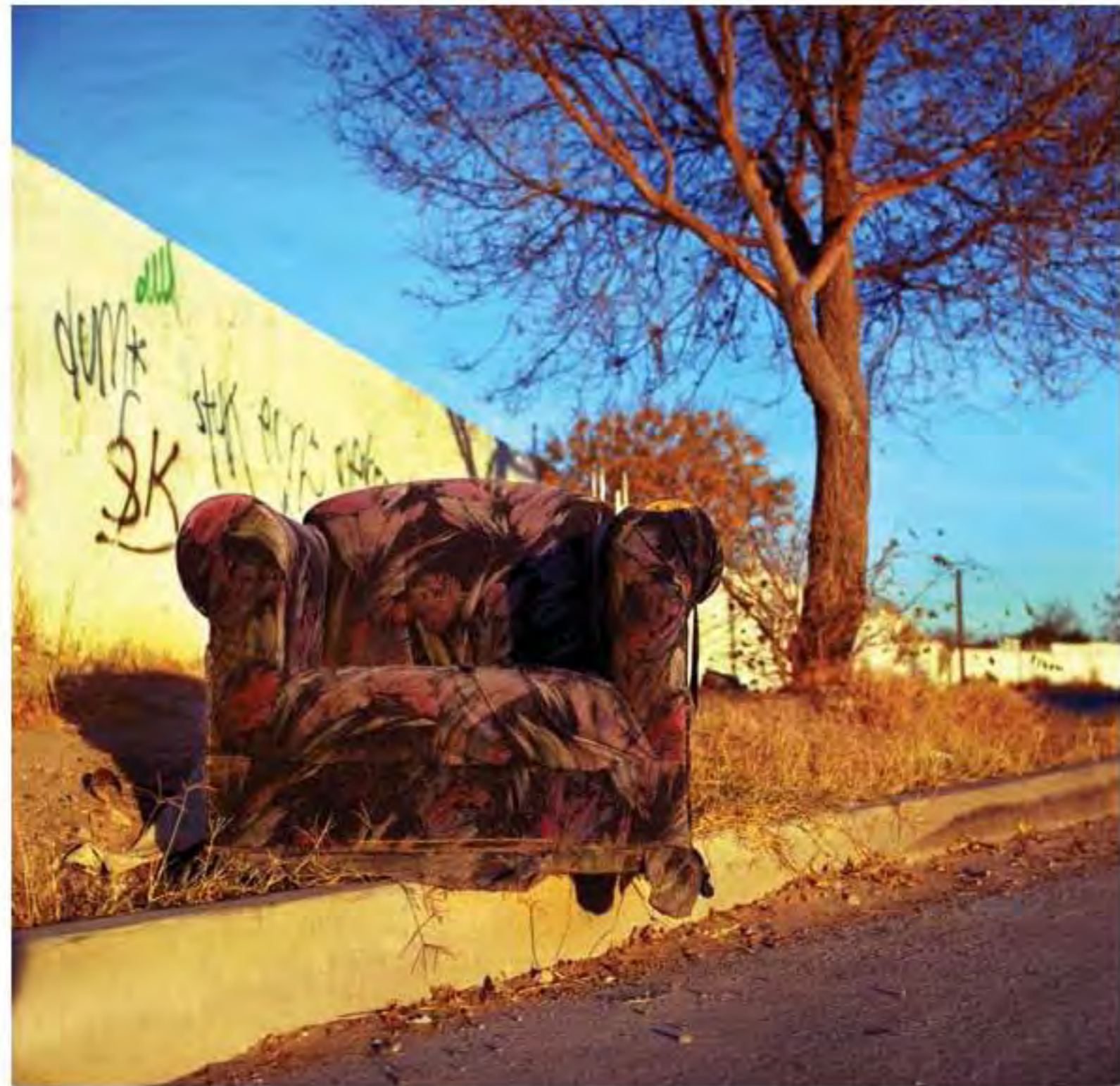
Sillón floreado #14. Impresión piezografía sobre papel de algodón