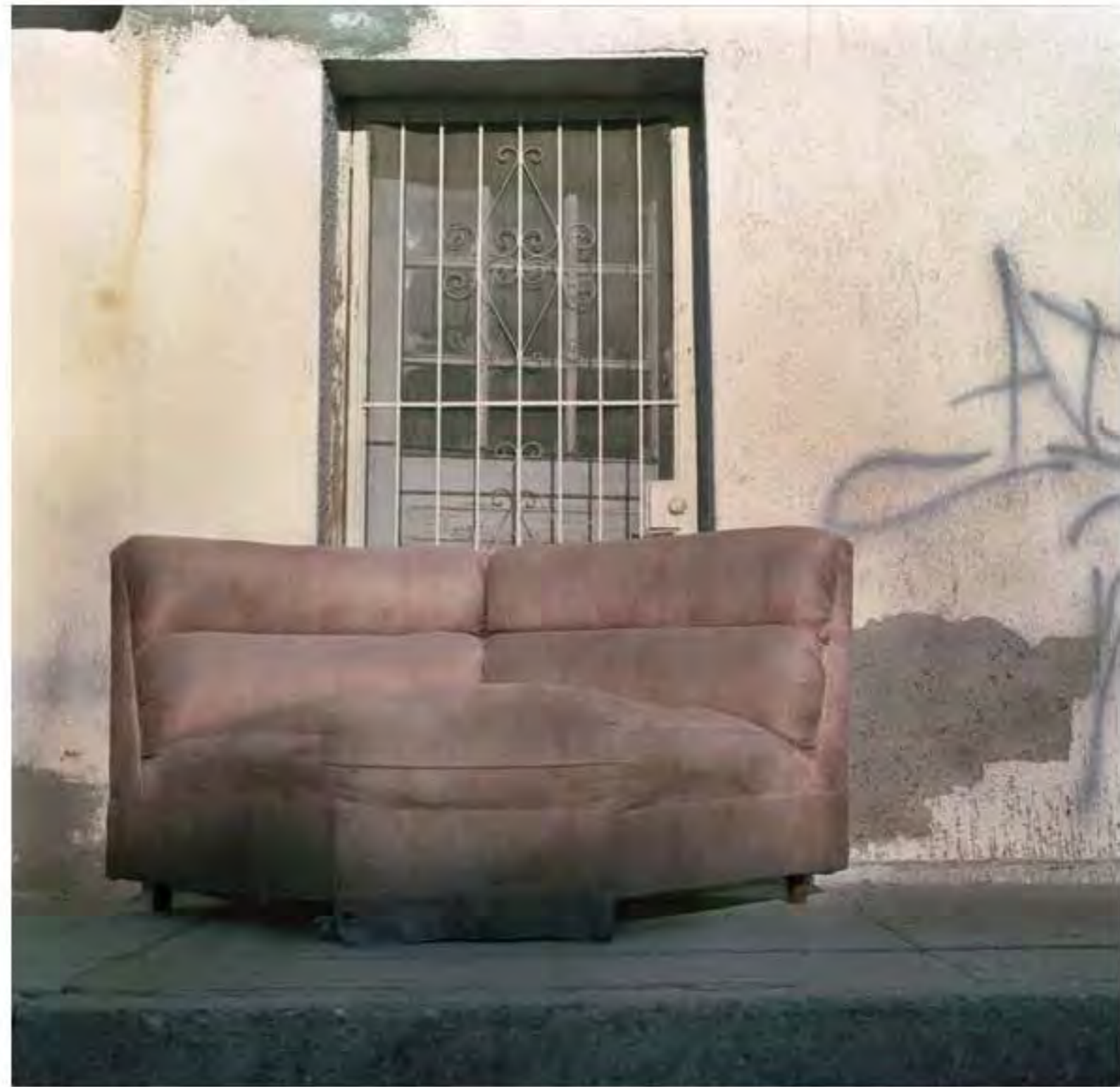
Sillón de esquinero rosa #20. Impresión piezografía sobre papel de algodón