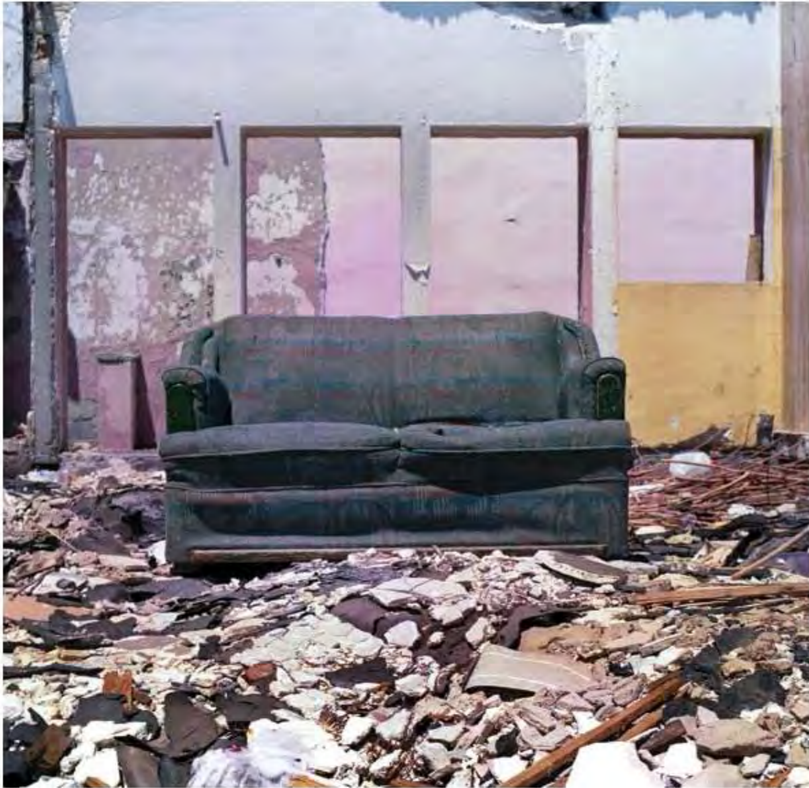
Sillón sobre escombros residenciales #4. Impresión piezografía sobre papel de algodón