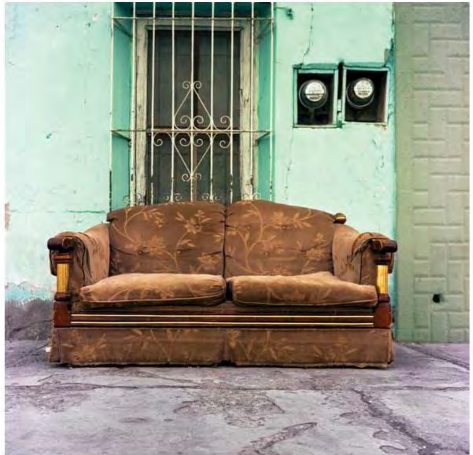
Sillón con estampado de plantas #11. Impresión piezografía sobre papel de algodón