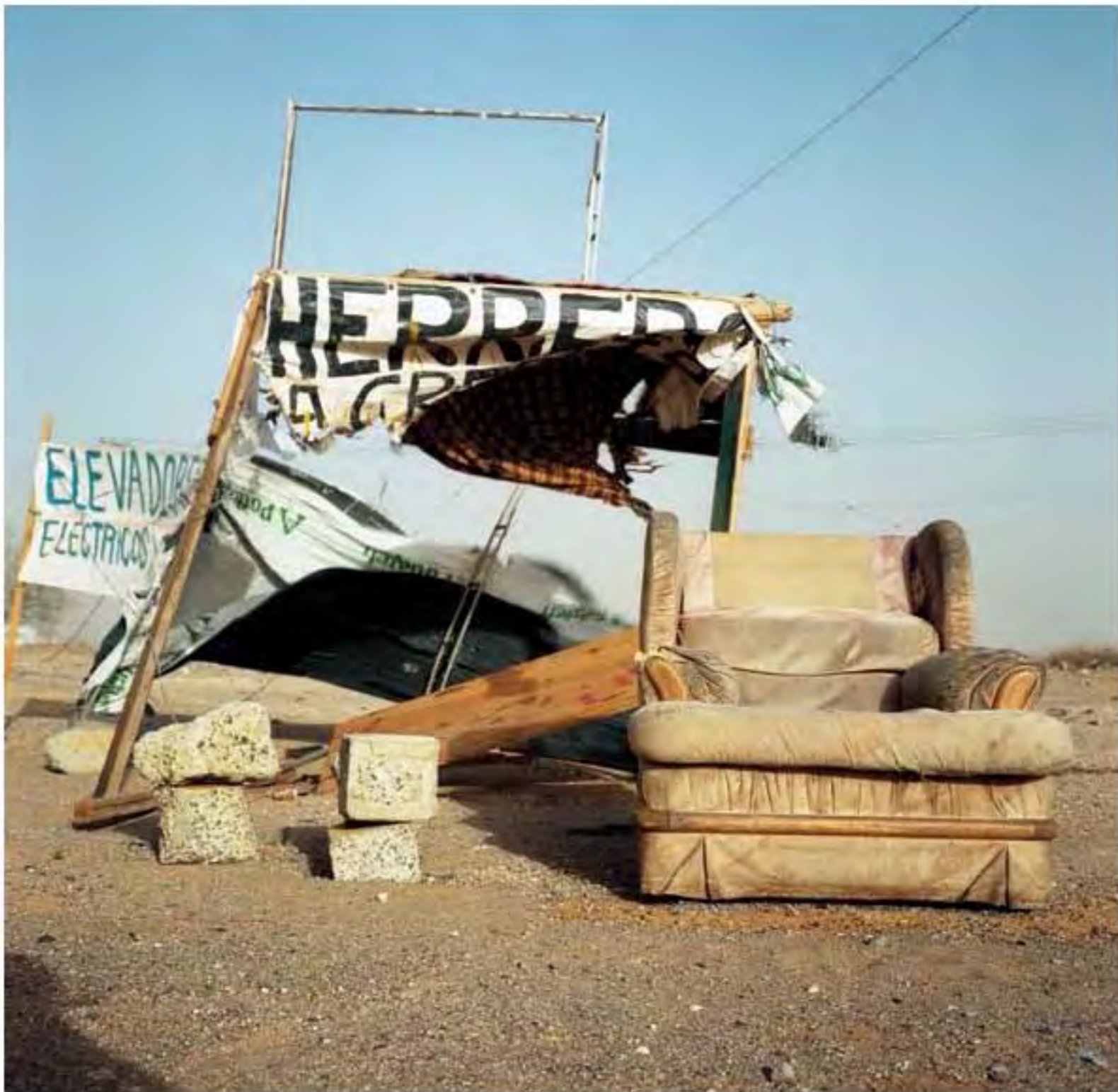
Sillón en herrería #19. Impresión piezografía sobre papel de algodón