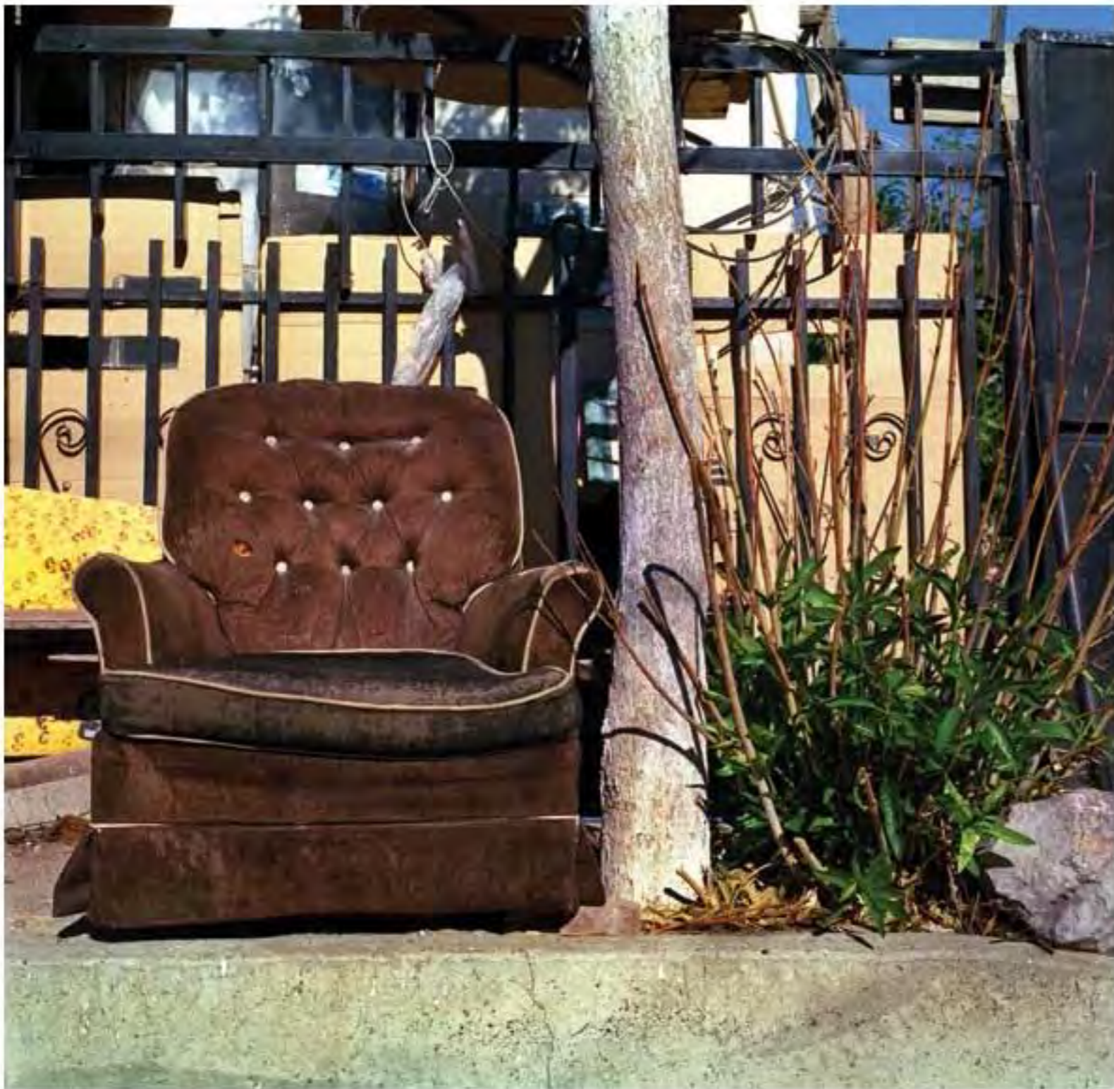
Sillón infantil café #6. Impresión piezografía sobre papel de algodón