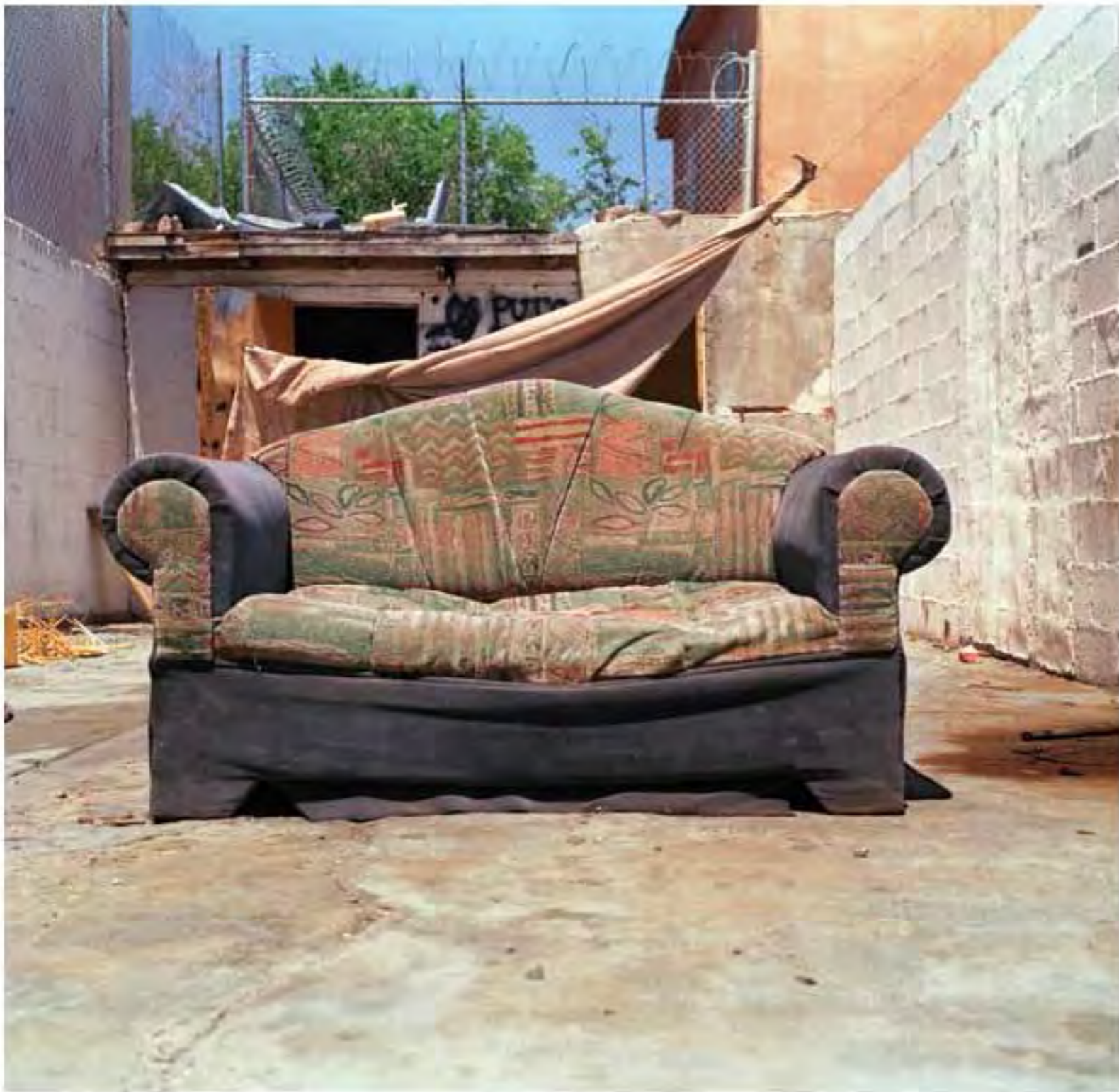
Sillón con estampado cubista #22. Impresión piezografía sobre papel de algodón