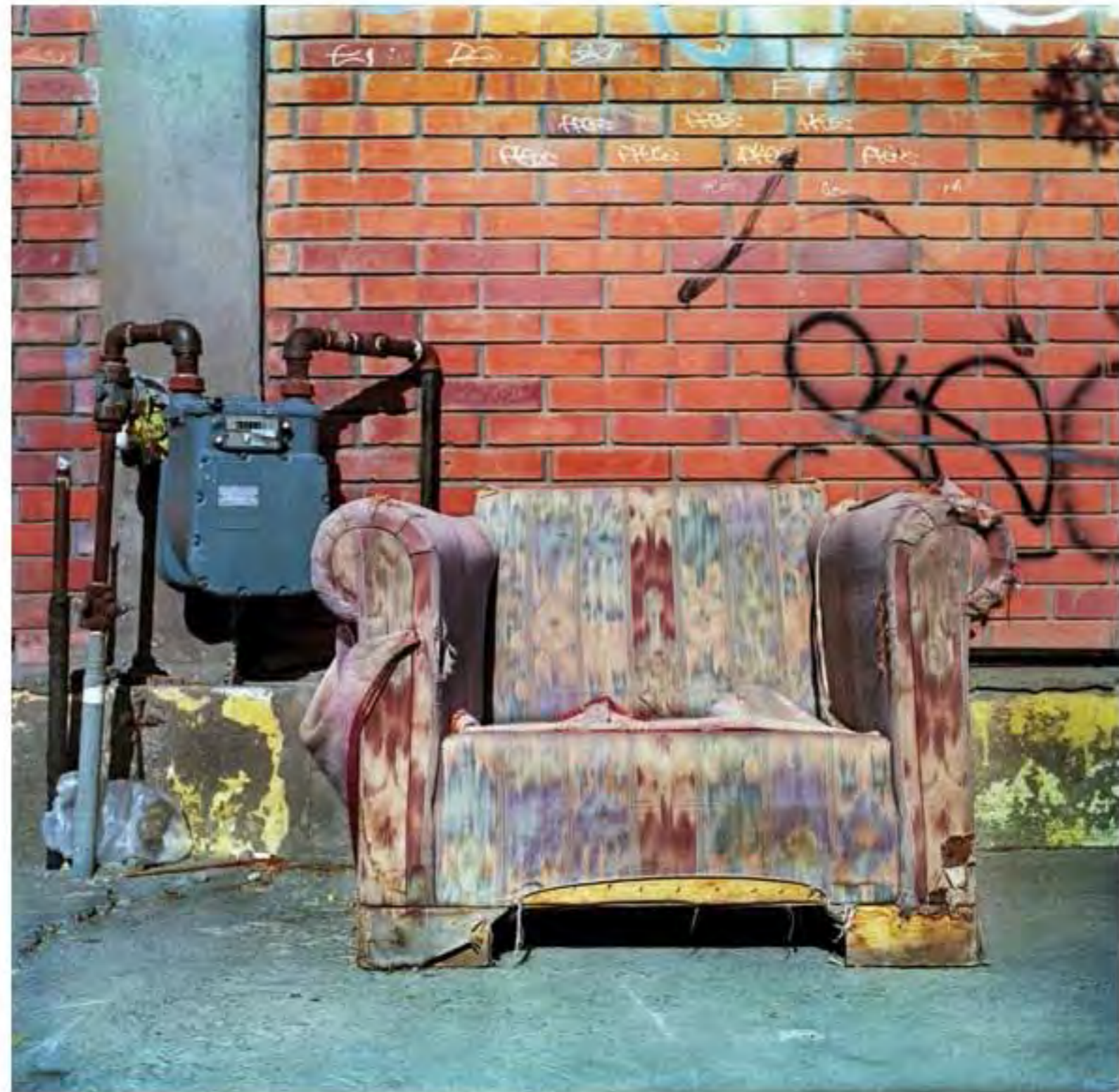
Sillón frente a muro de ladrillos #7. Impresión piezografía sobre papel de algodón