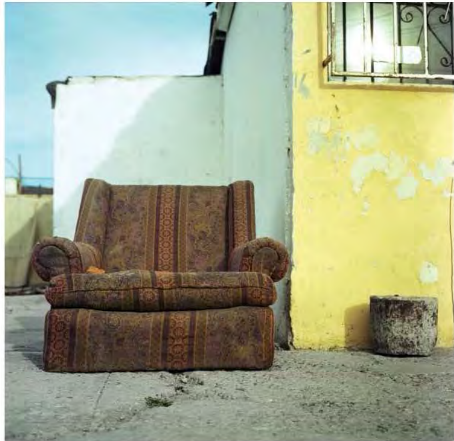
Sillón individual con taburete de concreto #23. Impresión piezografía sobre papel de algodón