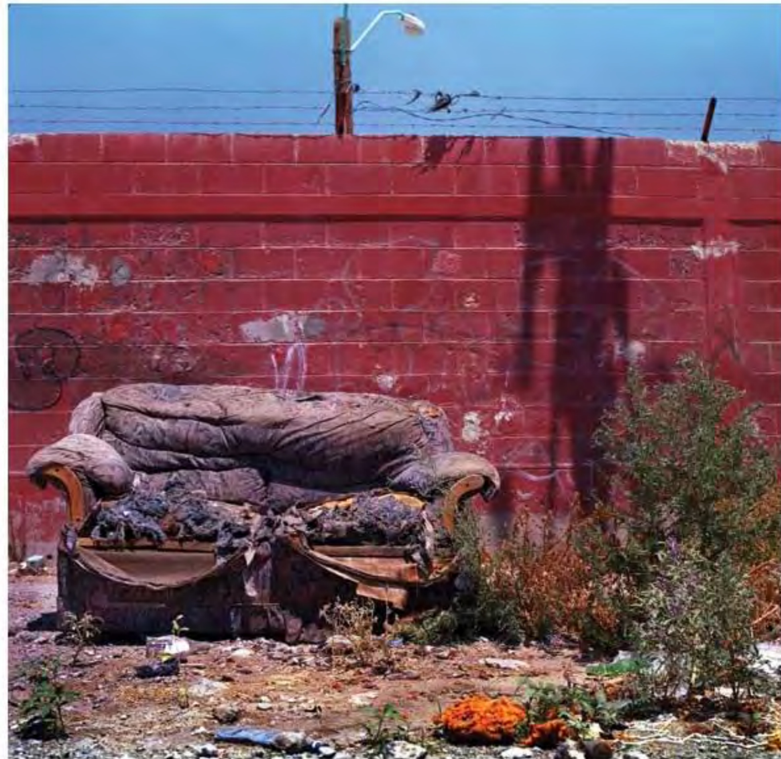
Sillón destruido #9. Impresión piezografía sobre papel de algodón