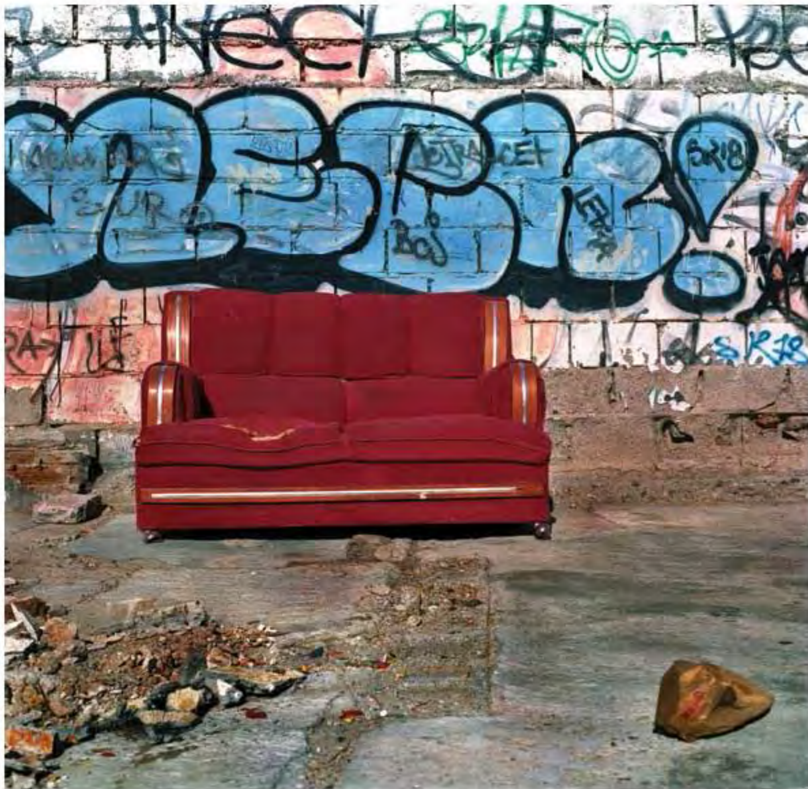
Sillón guinda con acabados en madera #15. Impresión piezografía sobre papel de algodón