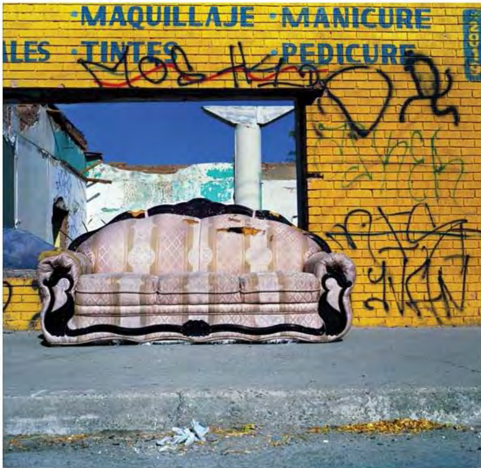
Sillón en local de maquillaje #1. Impresión piezografía sobre papel de algodón