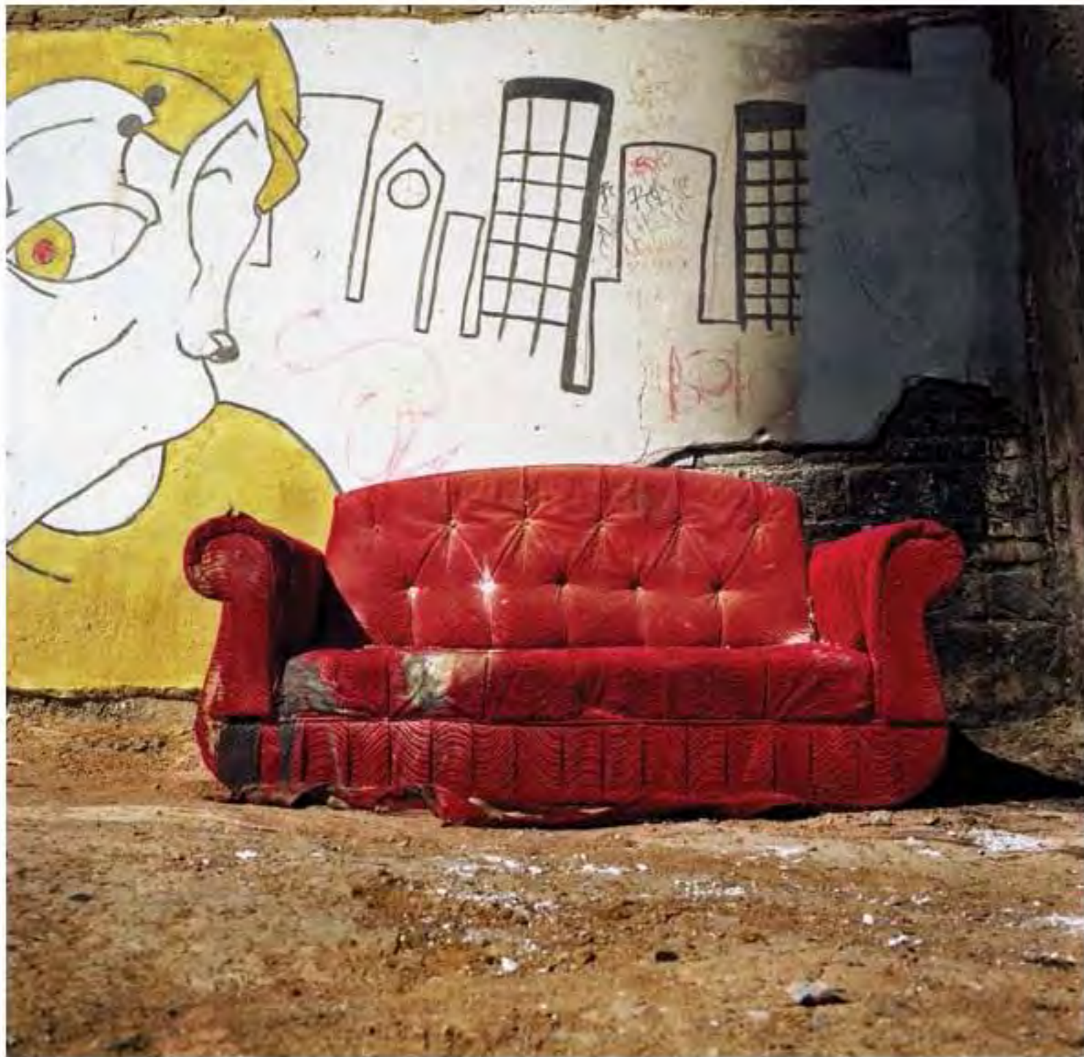
Sillón rojo #8. Impresión piezografía sobre papel de algodón