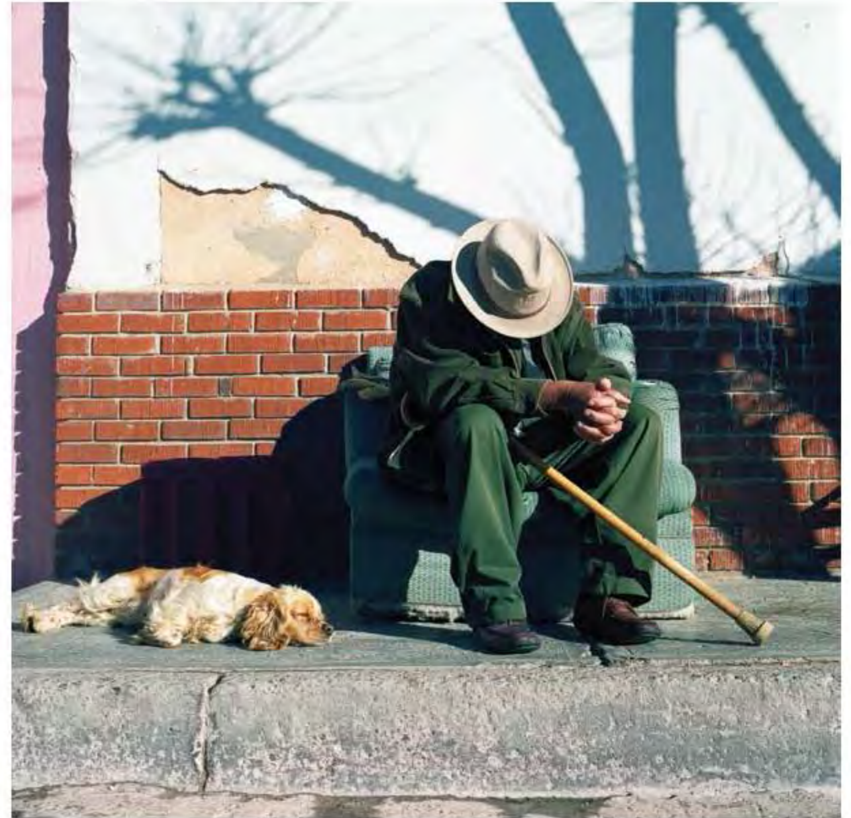
El descanso. Impresión piezografía sobre papel de algodón