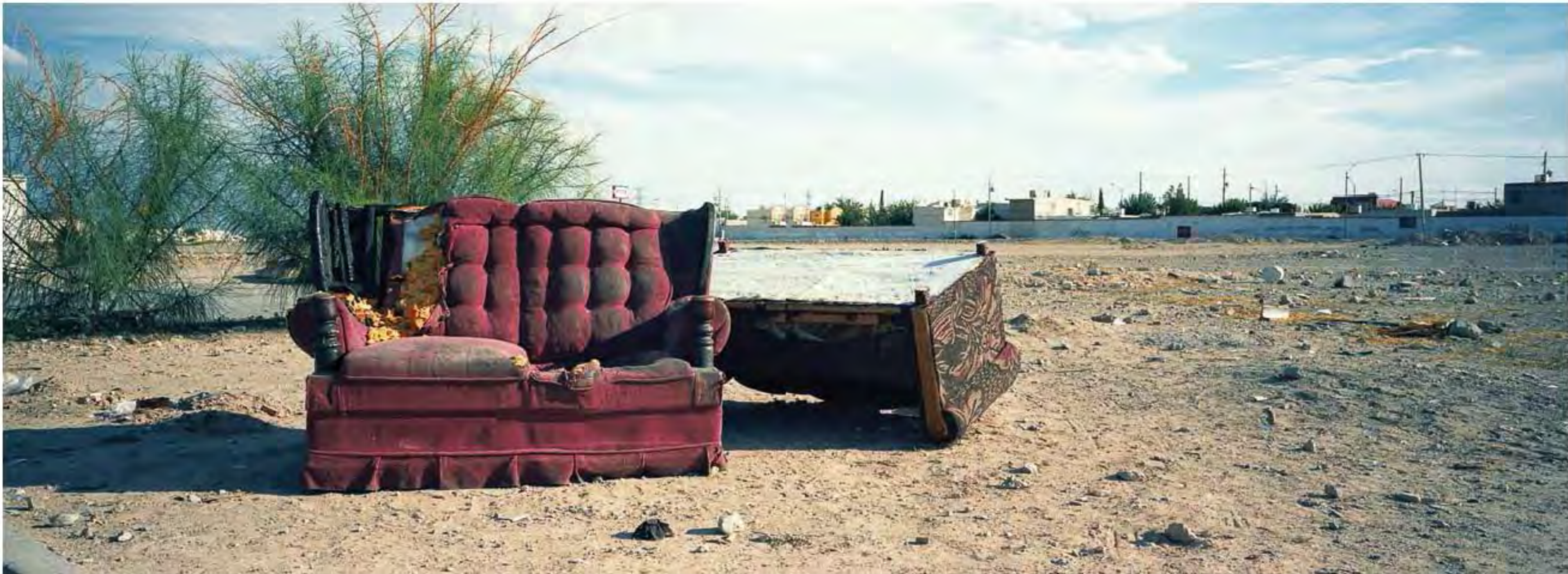
Sillones rojos abandonados en lote baldío #128. Impresión piezografía sobre papel de algodón