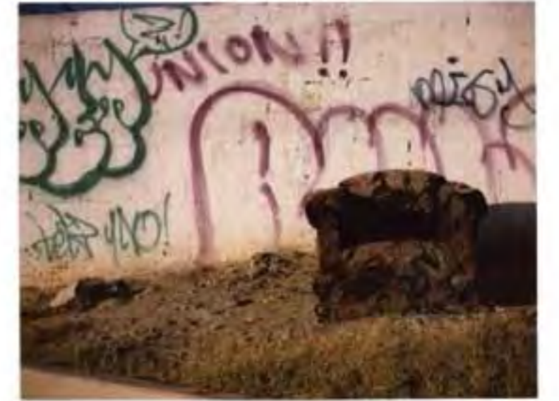
Político: 100 sillones abandonados en Ciudad Juárez