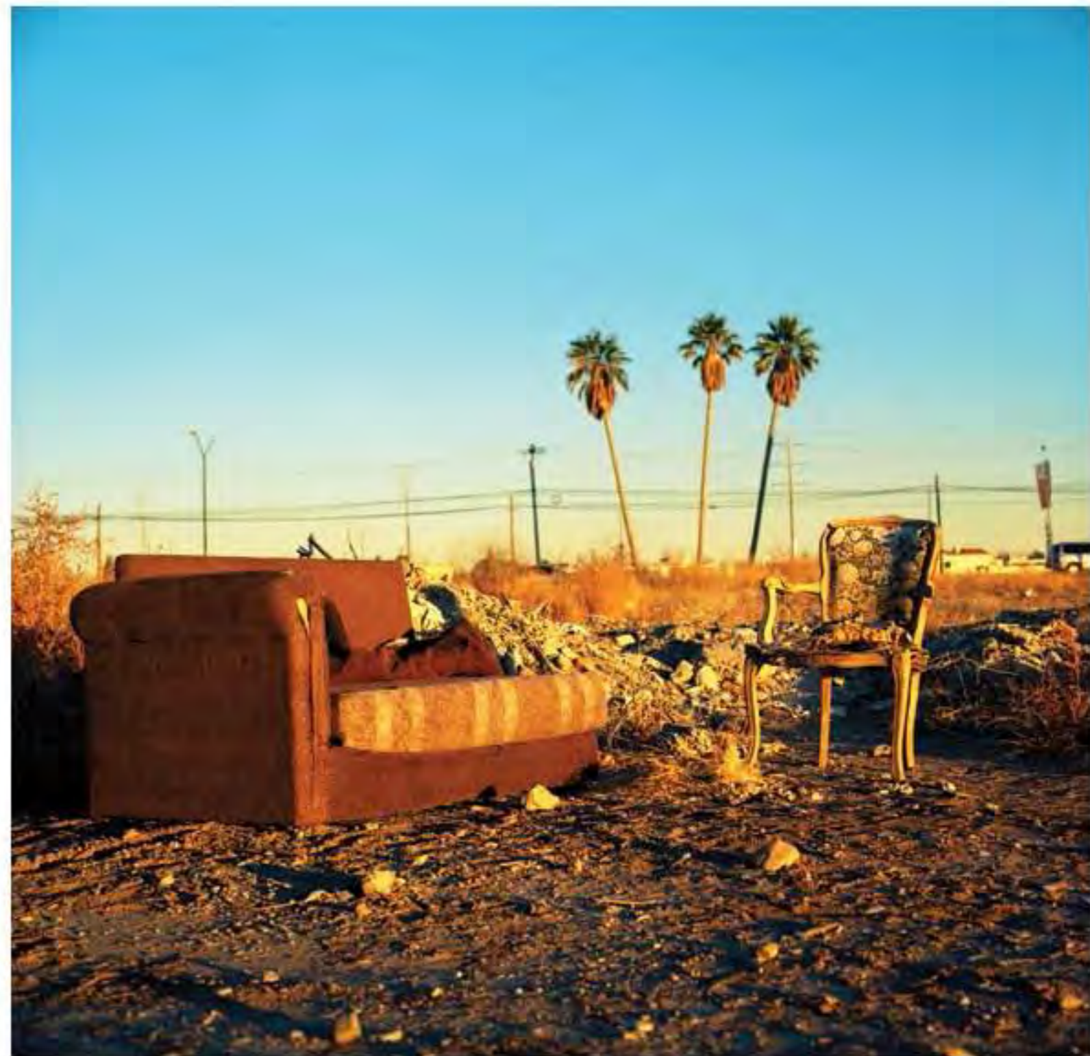
Sillón con silla en atardecer #2. Impresión piezografía sobre papel de algodón