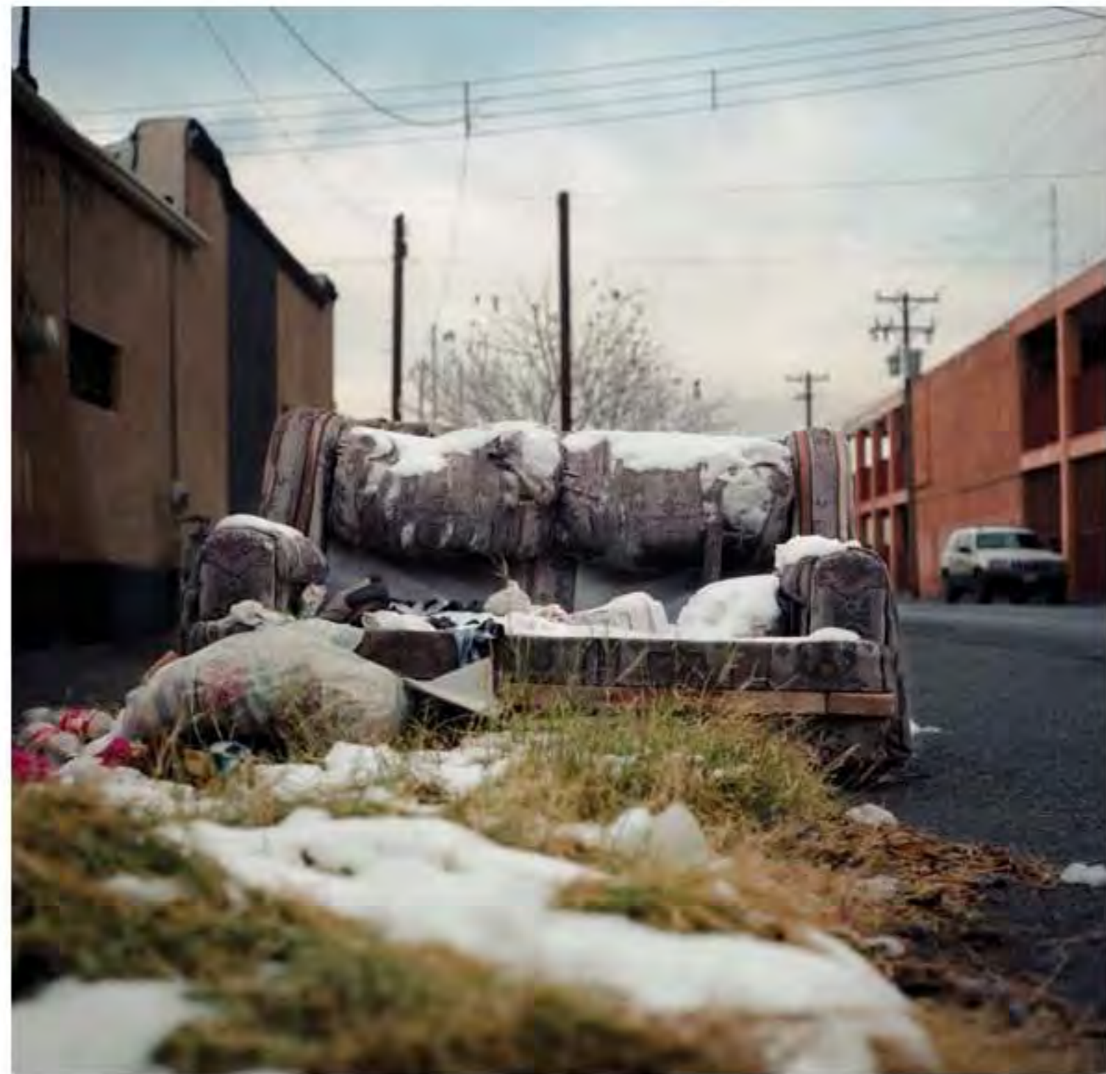
Sillón con nieve #16. Impresión piezografía sobre papel de algodón