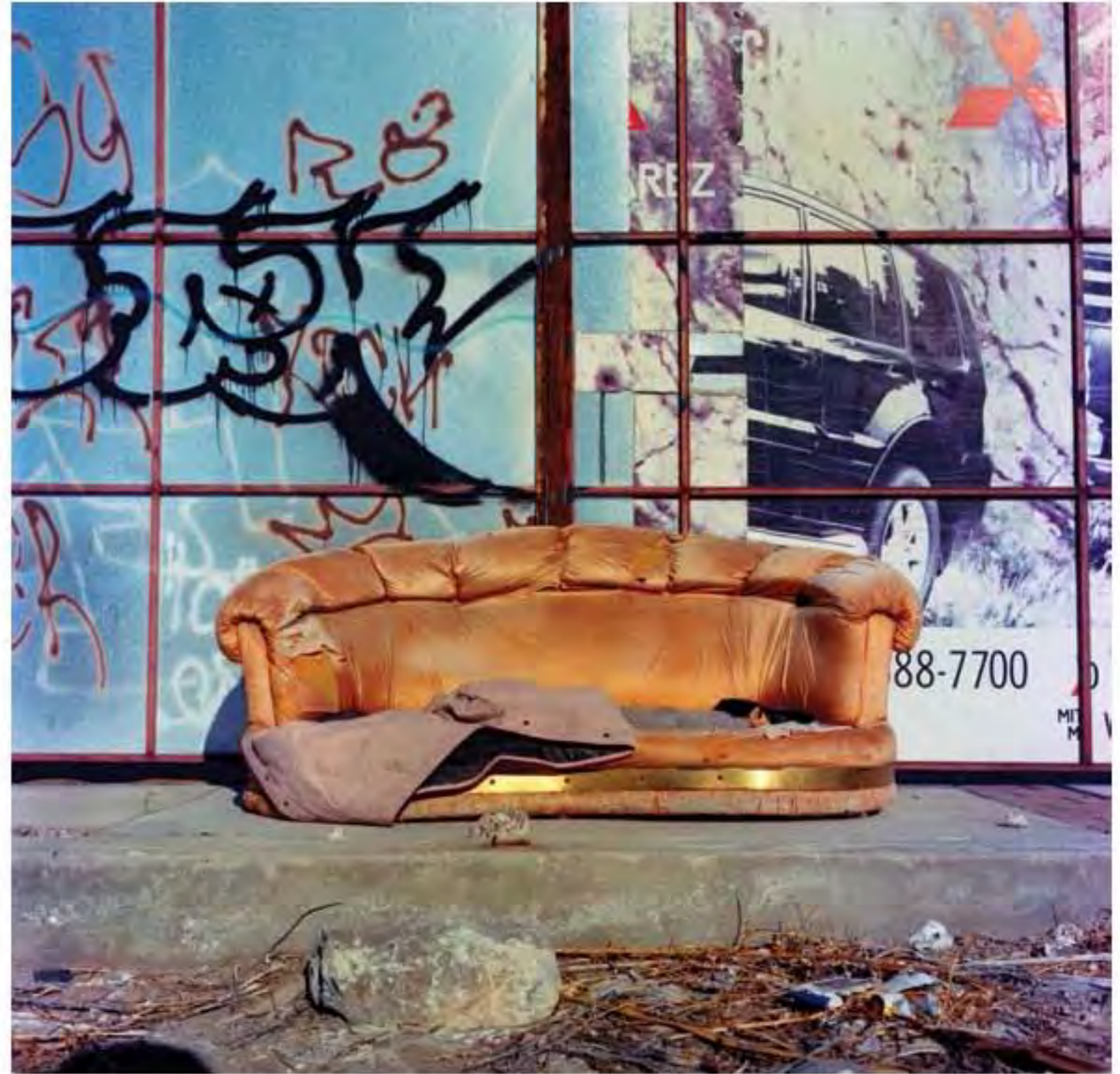
Sillón dorado #5. Impresión piezografía sobre papel de algodón