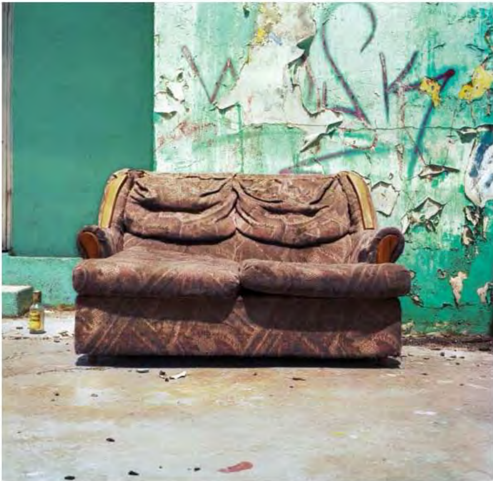
Sillón con estampado rayado #17. Impresión piezografía sobre papel de algodón