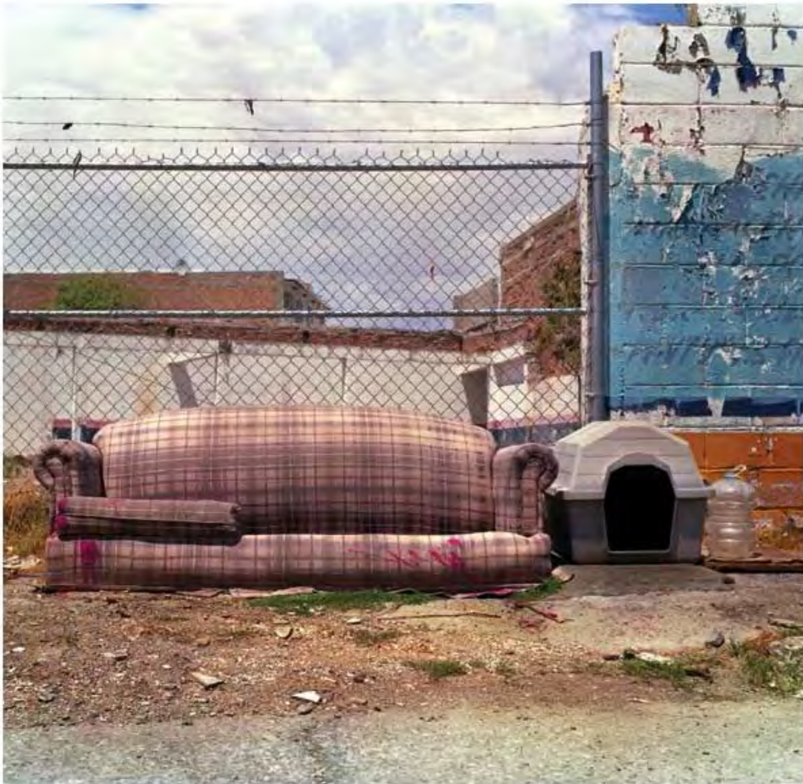
Sillón con casa para perro #12. Impresión piezografía sobre papel de algodón