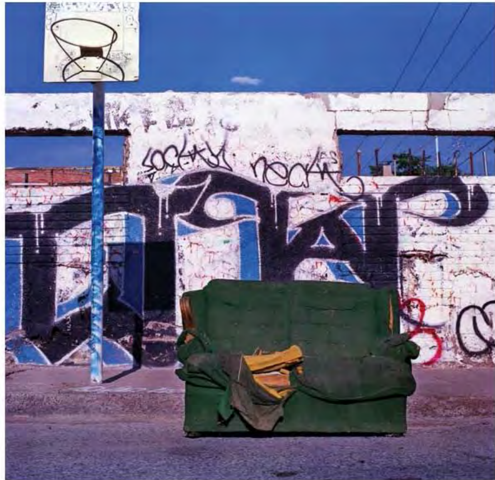
Sillón en área deportiva #18. Impresión piezografía sobre papel de algodón