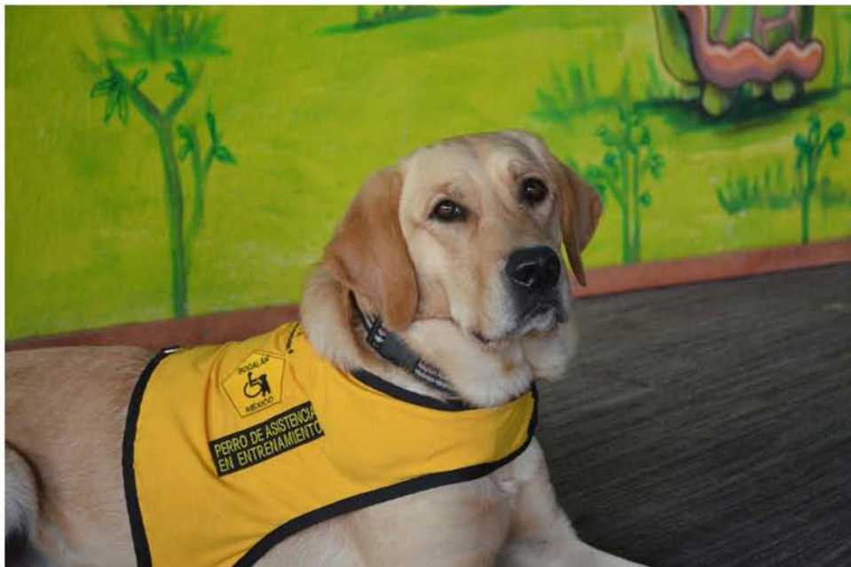
Perro de asistencia en entrenamiento.

A lo largo de este capítulo se podrán observar los mecanismos que hacen posible que estos perros brinden atención personalizada a sus usuarios. Los relatos de los beneficios y las dificultades que enfrentan dos usuarios de perros de asistencia y sus entrenadores, pertenecientes a Bocalán México, la principal asociación en México en este ámbito.