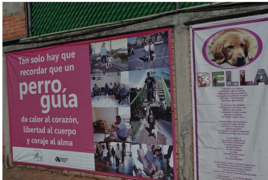
La Escuela de Entrenamiento de Perros Guía para Ciegos se encuentra al sur de la CDMX.

Esta institución ubicada al sur de la Ciudad de México tiene actualmente en servicio alrededor de 34 perros. “Es un ciclo, unos se retiran, otros están en activo y otros van naciendo” menciona Silvia Lozada, administradora pública por la Universidad Nacional Autónoma de México.