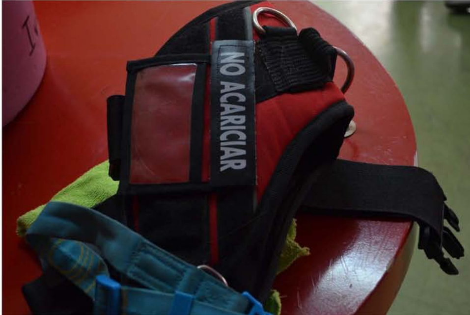
Los perros de terapia no son mascotas, se debe respetar cuando están trabajando.

Incluso en el World Trade Center de la Ciudad de México, el principal centro de negocios y exposiciones de la ciudad, durante el congreso internacional de terapia asistida con perros. “nos dijeron -híjole, sólo que no toquen la alfombra los perros, tendrían que subirlos a algo- entonces ¡ponte a cargar a los perros o a las transportadoras!”.