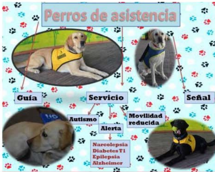
Infografía sobre los tipos de perros de asistencia.

Los perros de asistencia para niños con espectro autista (PSNA) son entrenados para evitar conductas de aislamiento o de fuga, el perro al dormir con el usuario ayuda a mejorar los patrones de sueño. “Cuando el niño empieza a agredirse el perro lo puede distraer, se encima en él o le da besos hasta que deja de hacerlo, es como hacerle bolita” dice la entrenadora.