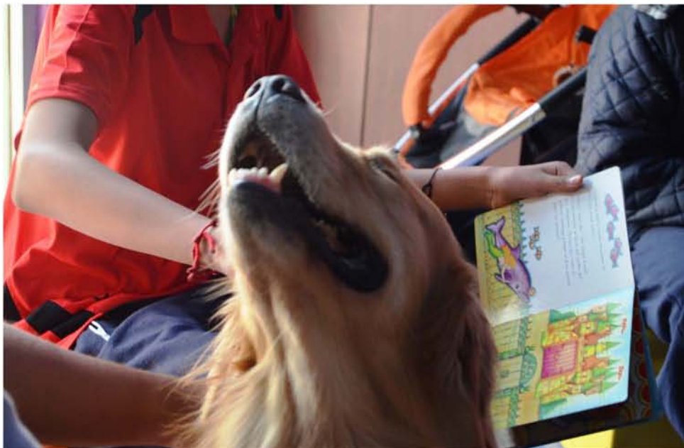
Los niños no son los únicos que disfrutan las sesiones de terapia asistida con perros.