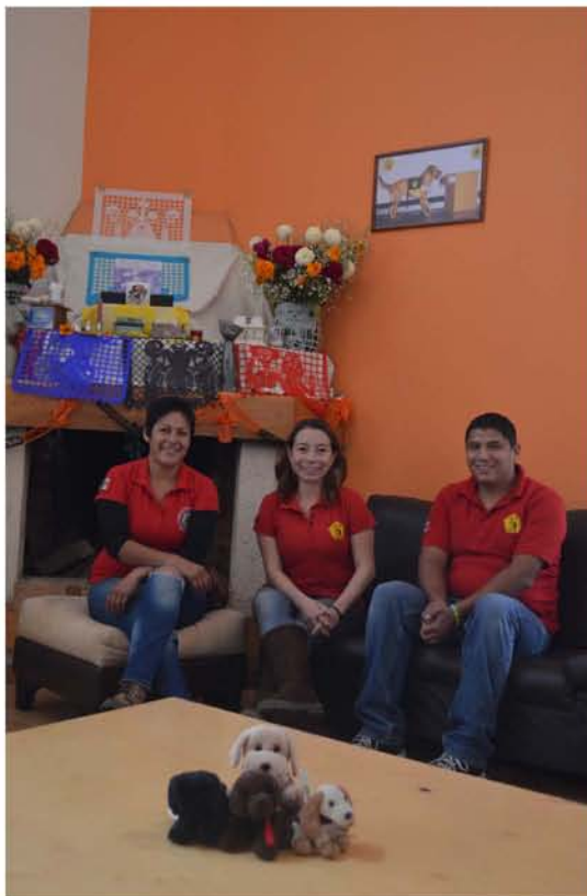
El equipo de Bocalán México.

En países como Inglaterra, menciona Alison Hornsby, si una persona quiere registrar a su perro como perro de terapia es necesario que ambos estén inscritos en PRO Dogs, de modo que si el perro pasa las pruebas, quedará cubierto por el seguro de esta organización.