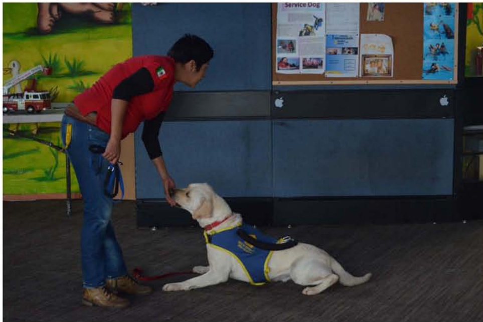
El entrenamiento de los perros de asistencia se basa en refuerzos positivos.

Entrenan labradores porque se han dado cuenta que es una raza muy apta para realizar este tipo de actividades, son equilibrados, inteligentes, y su apariencia es más amable que la de un pitbull que es una imagen agresiva, por ejemplo. Ya se ha demostrado la eficacia de los perros de asistencia en las personas, debido a la complejidad del entrenamiento no todas las personas ni los perros son aptos para ello. Por eso, menciona Claudia Aguilar “mientras en Inglaterra se entregan 300 perros al año, en México entregamos uno, es una diferencia impresionante”.