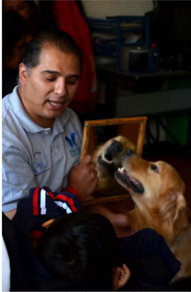
Los perros de terapia mejoran el vínculo con los usuarios.

las cuatro practicantes enseñan con tarjetas las diferentes expresiones que corresponden a cada emoción: enojo, felicidad, tristeza, preocupación, sorpresa.