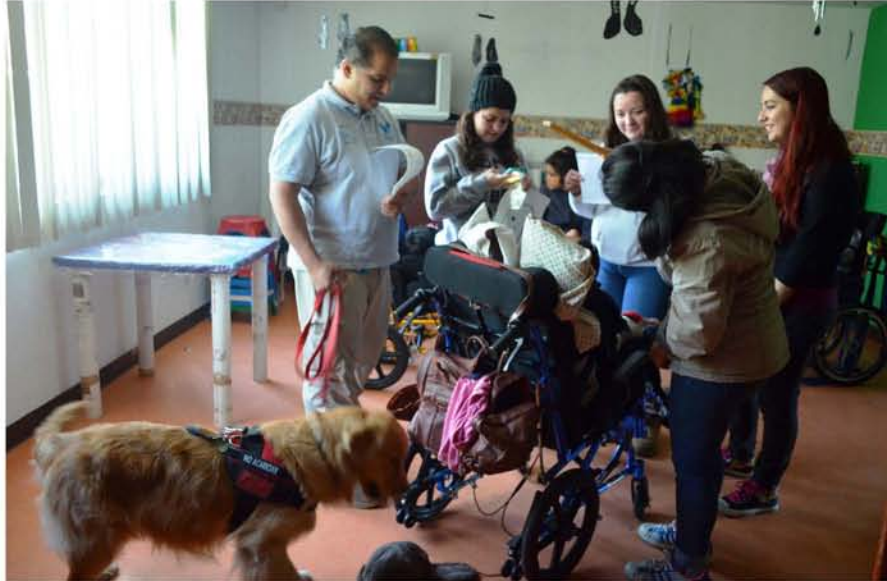
Estudiantes de psicología de la Universidad La Salle realizan prácticas profesionales en Fundación Umbral.