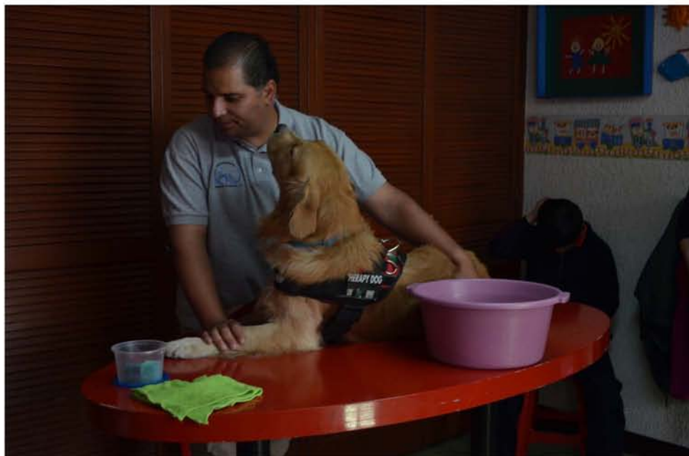
En un día normal, un perro de terapia participa en tres o cuatro sesiones.

Si bien los facilitadores no cobran nada por realizar la terapia asistida con perros, piden apoyo económico para el transporte, el cual tiene que realizarse en taxi. A Psicuss Emotional Healthcare ninguna institución les ha ofrecido este apoyo, ellos han tenido que pedirlo y muchas veces les es negado. Eso afecta en que pierdan