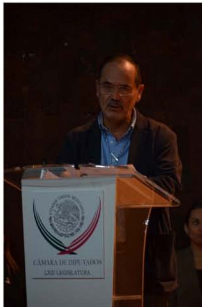
Gustavo Madero en la Cámara de Diputados.