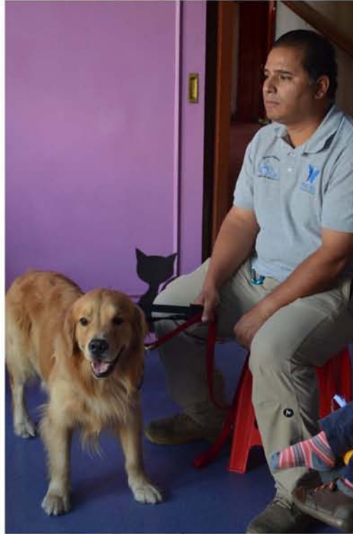
Los facilitadores de TAP en Fundación Umbral trabajan como voluntarios.