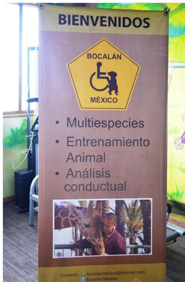
Las diferentes acciones que realiza Bocalán México.