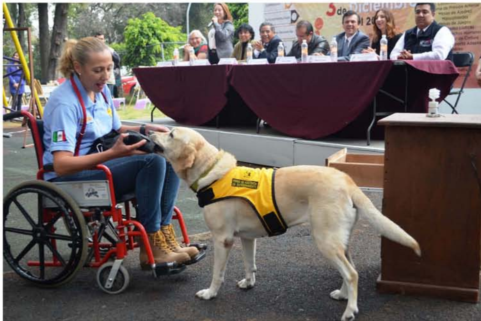
Demostración del trabajo que realizan los perros de asistencia.

Hasta el 19 de junio de ese mismo año, escribe Nabila Delgado 15 , “tal iniciativa no se encuentra en la Gaceta Parlamentaria de la Asamblea Legislativa del Distrito Federal” para entender la importancia de una propuesta de este tipo menciona que es necesario comprender tres aspectos “¿Cuáles son los animales de asistencia? ¿Qué derechos se buscan garantizar? y ¿De qué manera se ha regulado esta figura en otros países?”.