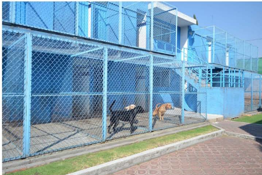
Los futuros perros guía viven en las instalaciones de la escuela.

Para solventar los gastos que requiere entrenar a un perro de asistencia, Bocalán México busca el patrocinio de empresas, al ser una asociación que permite los donativos. Los últimos tres perros de asistencia que fueron entregados estuvieron patrocinados por la empresa de alimento para perro Ganador.