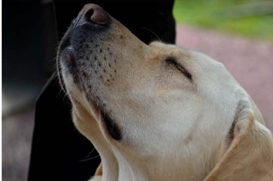
Un perro de terapia recibe entrenamiento especializado durante dos o dos años y medio.

“A nosotros lo que nos interesa son las características que el perro ya tiene desde el nacimiento. Esto es el temperamento del perro, más allá de la raza porque no son perros que necesitamos que hagan algún tipo de trabajo que requieran características anatómicas específicas. Lo que nosotros necesitamos es un perro que sea más apegado al humano, un perro en el que los instintos agresivos no aparezcan” comenta.