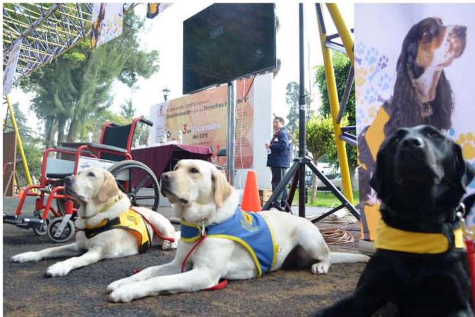
Los perros de asistencia entrenados en Bocalán México durante “su graduación”.

Para evitar maltrato, se hace un estudio riguroso acerca de las actividades que realiza el futuro usuario, se hace un seguimiento cada mes para monitorear las condiciones del perro y el usuario. Que en el caso de los perros guía, se llaman “binomio”. Para entregar al perro es necesario que realice alguna actividad económica o académica y que cuente con los recursos para mantener al perro así como independencia en su rutina.