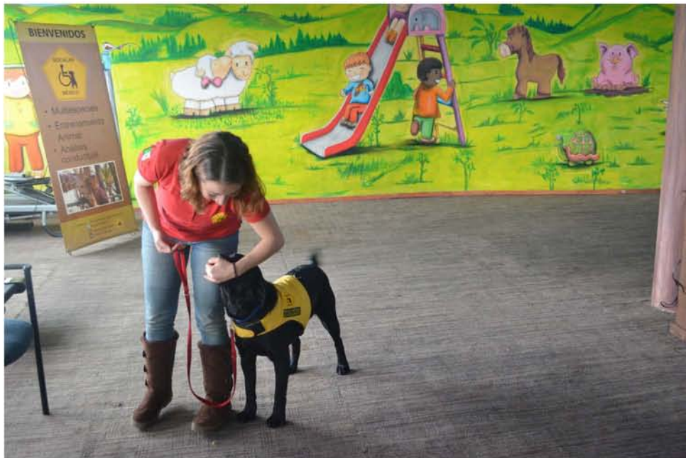
El desconocimiento de su trabajo, por parte de la sociedad, dificulta también el entrenamiento de los perros de asistencia.