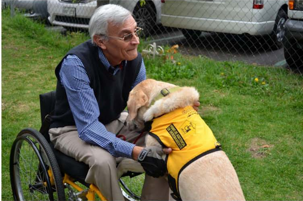
Para evitar discriminación, es importante conocer el trabajo que realiza un perro de asistencia.

La egresada de la Facultad de Derecho de la UNAM escribe en el blog del Centro de Investigación y Docencia Económicas (CIDE) que una parte fundamental de la inclusión de personas con discapacidad consiste en garantizar su accesibilidad a cualquier espacio y actividad con los elementos de apoyo que requiera, entre ellos un perro de asistencia.