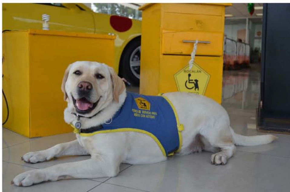
Perro de asistencia para niño con autismo.

Lo que casi todas las organizaciones coinciden en pedir es que haya una regulación hacia este tipo de perros para que pueda haber un mayor control. “Que no cualquiera pueda ponerle una camiseta a un perro y decir que es de asistencia”. Porque esto genera que los dueños de establecimientos se nieguen a permitir la entrada a las personas discapacitadas y sus perros.