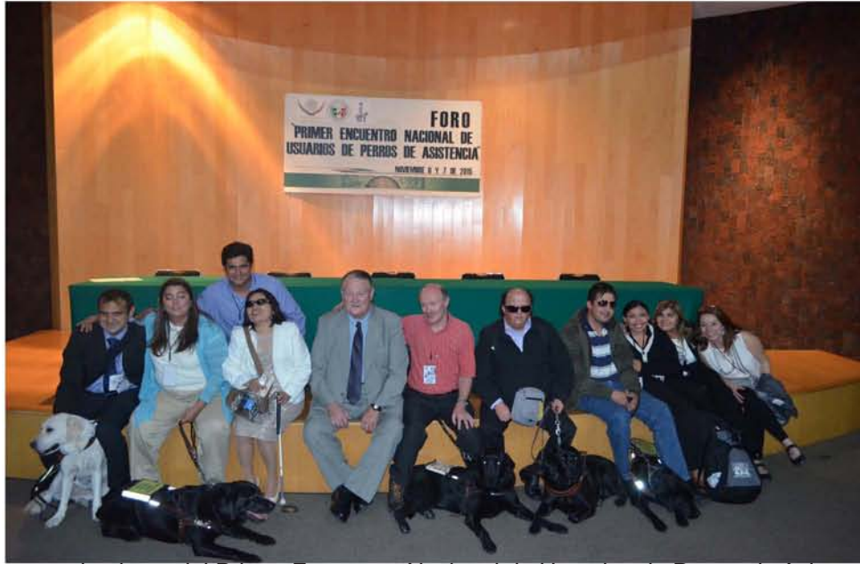
Los organizadores del Primer Encuentro Nacional de Usuarios de Perros de Asistencia.

sido inseparables, casi tres años estando juntos y le damos gracias a Dios por ser Pepe y Praya. Desde septiembre de 2014 somos un binomio inseparable, sincronizado”.