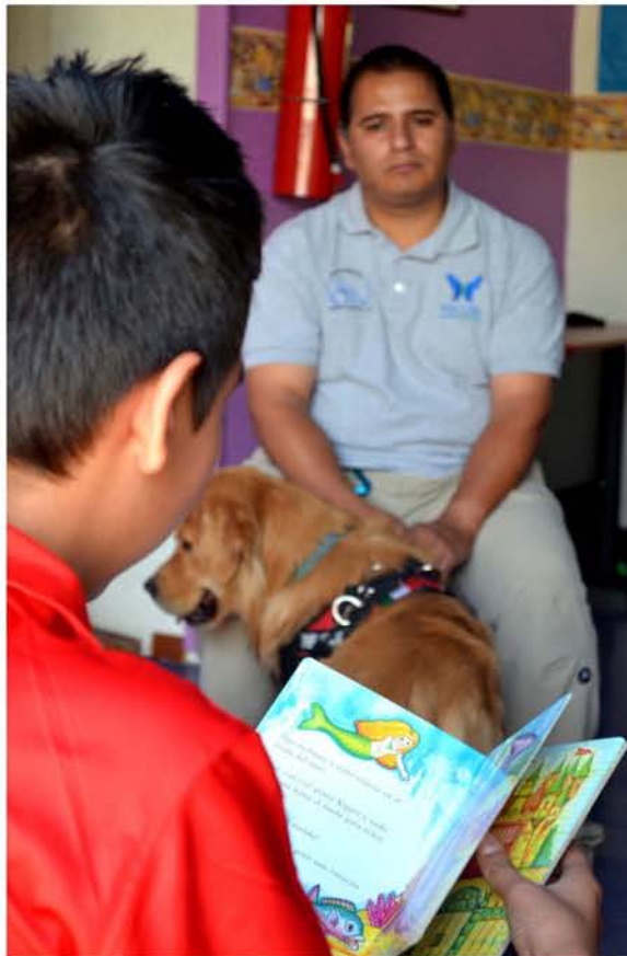
Las sesiones de lectura asistida con perros brindan seguridad y confianza a los niños.

Como pudimos ver a lo largo de este capítulo, la labor que realizan los perros de terapia es muy significativa en la vida de personas con discapacidad, para sus familias y para los profesionales en materias de salud y de aprendizaje que sienten una gran satisfacción al saber que ayudan a este grupo de la sociedad que es tan excluido.