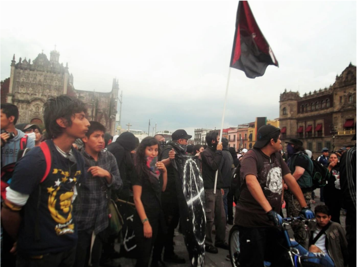
En el mitin con los líderes estudiantiles de 1968, Ciudad de México, 02-octubre-2014, por Araceli Isidro.