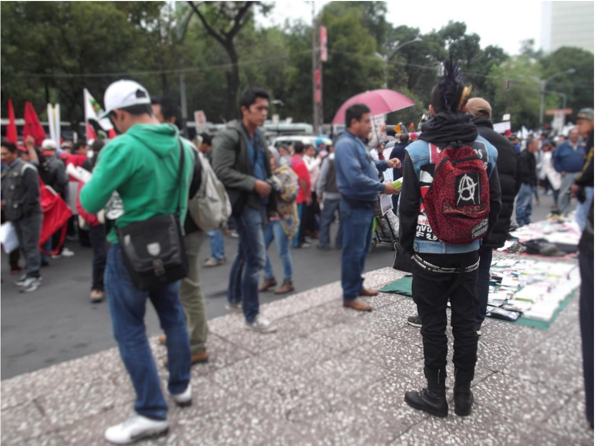
Marcha a un año de los 43 normalistas desaparecidos, Ciudad de México, 26-septiembre-2015, por Araceli Isidro