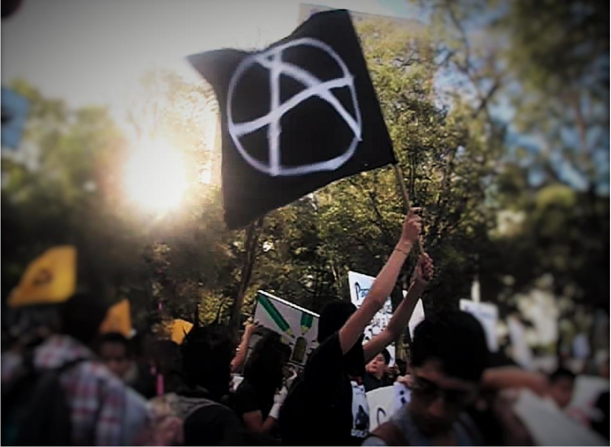
Marcha por los 43 normalistas desaparecidos, Ciudad de México, 05-noviembre- 2014