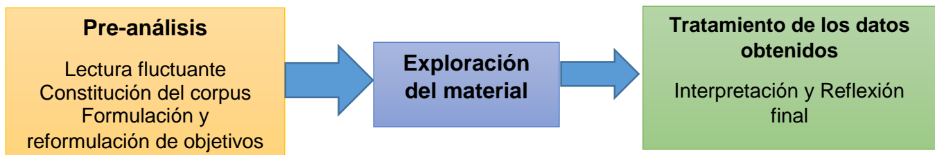
Fig.3 Proceso de análisis de los datos

trasfondo sociocultural dentro de la disciplina con el uso de este tipo de tecnología, se trató de organizar los discursos de los participantes con el objetivo en esta etapa de coleccionar los documentos, guías de trabajo e indicadores acerca del tema de investigación a fin de identificar las unidades de análisis. En esta primera etapa se definieron las unidades de análisis sobre las cuales se trabajó, con el previo establecimiento de reglas de análisis para codificar la clasificación de dichas unidades de análisis. Posteriormente se procedió a la definición de las categorías las cuales emergieron de conjuntar la teoría de Pacey con el material previamente codificado, principalmente consistió en la agrupación de los segmentos previamente codificados. Por último se realizó una síntesis final haciendo uso de las categorías y una reflexión final de los datos a manera de deducirlos y poner de relieve la información obtenida. A continuación se presenta un esquema del tratamiento de los datos.