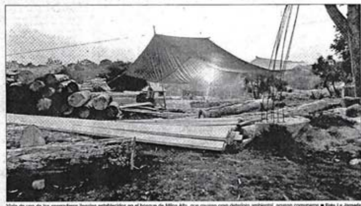
Vista de uno de los aserraderos ilegales establecidos en el bosque de Milpa Alta, que causan gran deterioro ambiental, acusan comuneros

Montiel Ríos se comprometió a garantizar una cita con las autoridades capitalinas la próxima semana para atender esta problemática, sobre la que adelantó en entrevista: "No puede explotar en las montañas y generar un problema social muy fuerte entre las comunidades", porque para