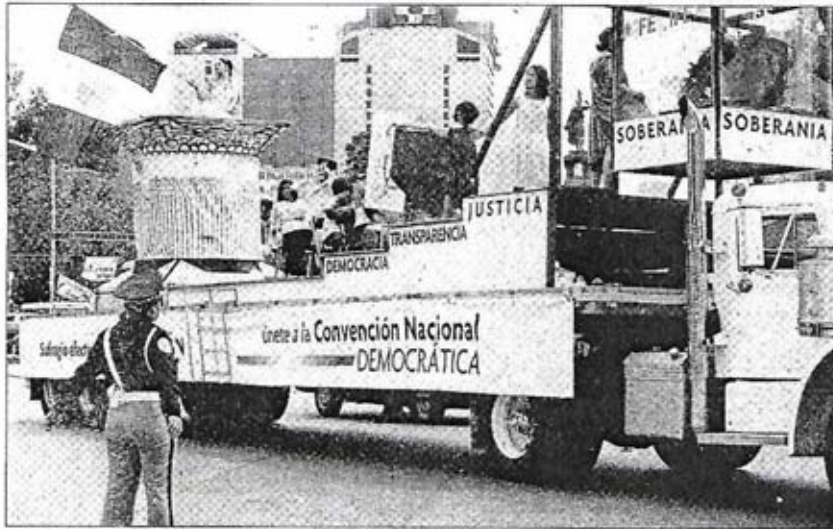
En Insurgentes y Reforma, simpatizantes de la coalición Por el Bien de Todos invitan a los ciudadanos, mediante un tráiler alegórico, a participar en el Grito de la Independencia en el Zócalo el próximo 15 de septiembre

Señala que esa ausencia la sufrió a los nueve años de edad; "desde entonces mi madre tuvo que trabajar en su local de calzado en el mercado de Granaditas, para sacar adelante a sus ocho hijos. Siempre