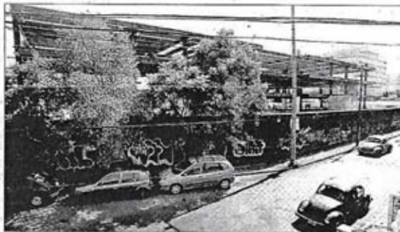
Los vecinos de la colonia Tizapán expresaron su incomodidad por la construcción de un supuesto kínder en el número 4 de la calle Cuauhtémoc

La construcción del colegio particular, que se denominará Shelkón, se encuentra entre la avenida Río Magdalena y la calle Cuauhtémoc. Esta última es la única vialidad que sirve de tránsito a los automovilistas que vienen del Cerro del Judio, San Bernabé, San Jerónimo y Periferico