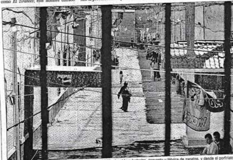
Según el registro histórico, la construcción data del siglo XVIII y ha sido caballeriza, convento y fábrica de zapatos, y desde el porfiriato se habitó como habitación