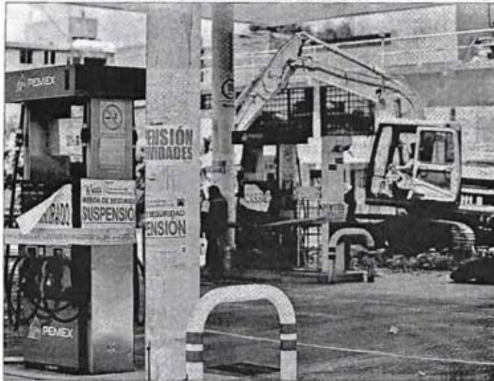
Ayer por la mañana comenzaron los trabajos para demoler una gasolinera, ubicada en la calle Escueta Naval Militar, en la delegación Copaculcan, por carecer de permisos; sin embargo, por la tarde se frenaron las obras al presentarse una persona con un recurso legal que ordenaba no destruir las instalaciones. ■ Foto Carlos Ramos Marañón