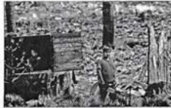
En la zona boscosa de la delegación Milpa Alta se ha detectado a últimos hechos un incremento de la tala clandestina. Aquí, imagen de archivo de un presunto talamonte.