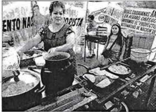
Cocina en el campamento de seguidores de la coalición Por el Bien de Todos en Paseo de la Reforma

En general, los campamentos asentados del Zócalo a la fuente de Petróleos tienen sus propias cocinas, habilitadas con una parrilla, mesas y lucales donde hay todo tipo de legumbres, verduras, fruta, papa, agua embotellada y jugos y refrescos de la cooperativa Pascual Boing.