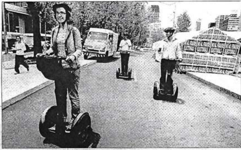
Turistas españoles pasean en peculiares vehículos motorizados por el campamento de simpatizantes de la coalición Por el Bien de Todos ubicado en el cruce de Reforma e Insurgentes ■ José Antonio López

Señalan que en cerca de 5 mil casillas hay más de 97 mil votos alterados; "imagínate el resultado con un recuento total", indican los activistas, y tanto en el papel como de manera verbal sostienen: "nuestra resistencia civil pacífica ha dado resultados, por eso no debemos dar ni un paso atrás".