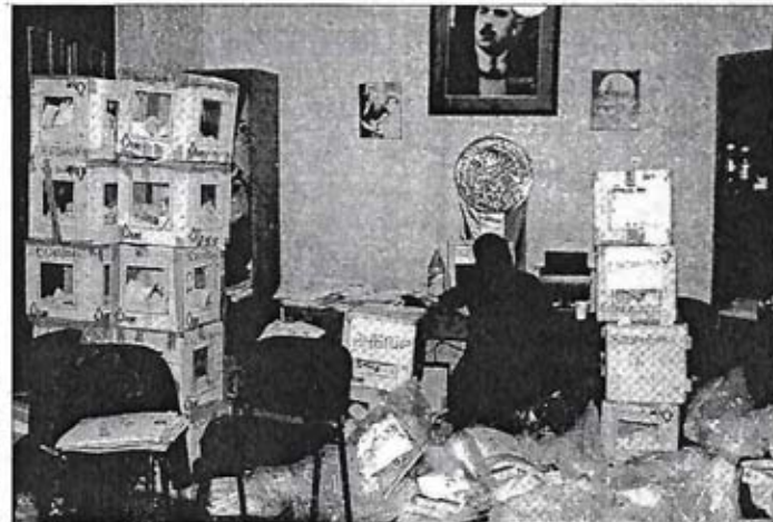
Centro de acopio de la paquetería electoral perredista para su conteo, ubicado en la calle Sor Juana Inés de la Cruz número 248, colonia Agricultura, en la delegación Miguel Hidalgo