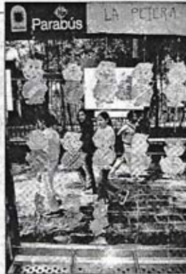
Parabús rebautizado en Paseo de la Reforma, frente a Chapultepec

Desde la fuente de Petróleos, en el campamento de Azcapotzalco, Radio Hormiga realiza una función similar. Ahí Gabriel Herrera explica que se trata de una herramienta de comunicación e interlocución, que no es nueva, pues se utiliza en comunidades serranas de Chiapas, Oaxaca, Guerrero y Michoacán, entre muchas otras, para dar servi-