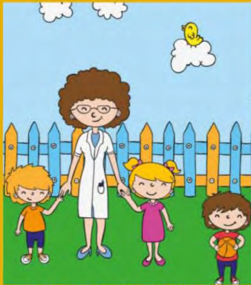
ACTIVIDADES PARA 5º Y 6º GRADOS