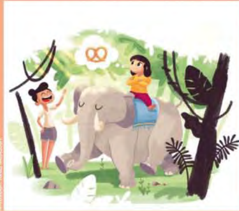
Ilustración: Ingrid Witzmann