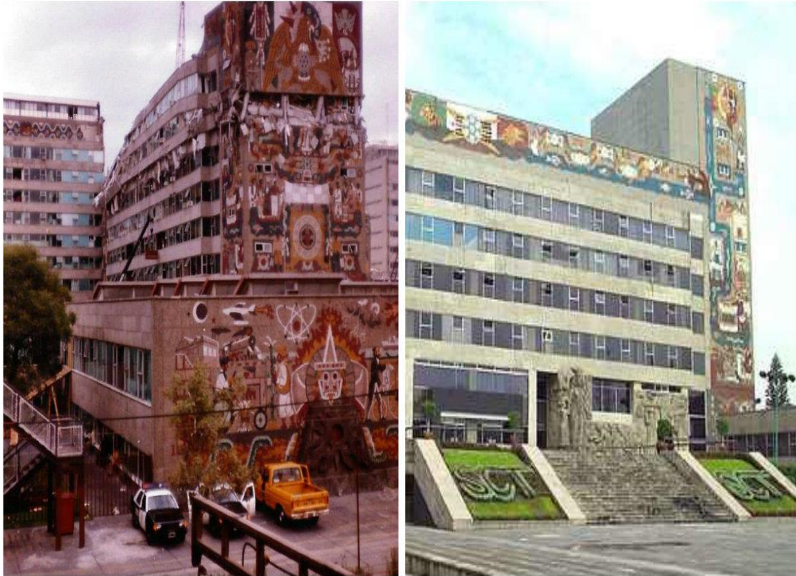
Foto: Antes y después. Así luce actualmente la Secretaría de Comunicaciones y Transportes.