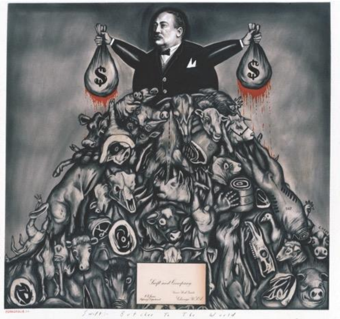
Ilustración 4 Sue Coe, Butcher to the world, 1986, BOMB Magazine, disponible en: http://bombmagazine.org/article/6696/