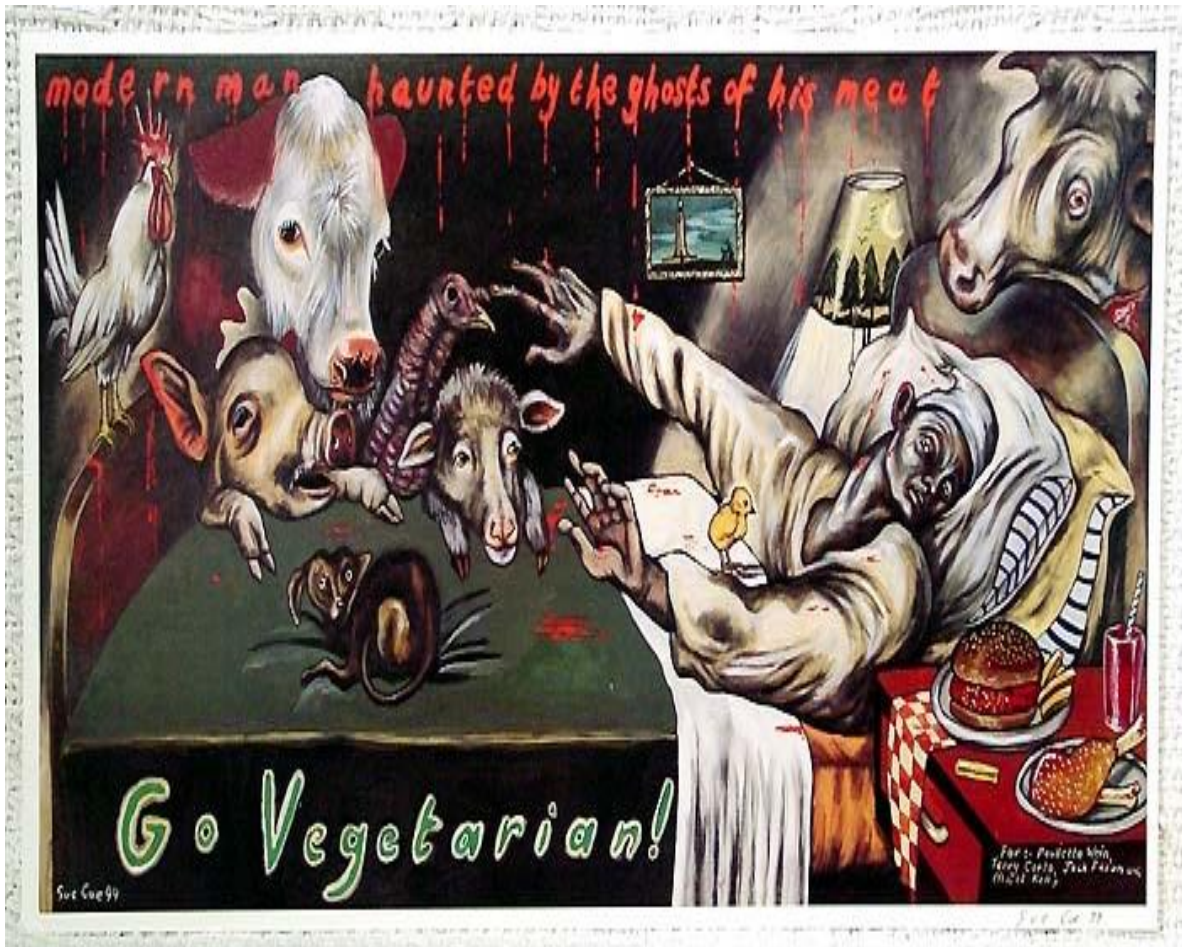
Ilustración 2 Sue, Coe, Go Vegetarian!, 1999, The Trout Gallery, Disponible en: http://www.troutgallery.org/exhibitions/detail/15 .