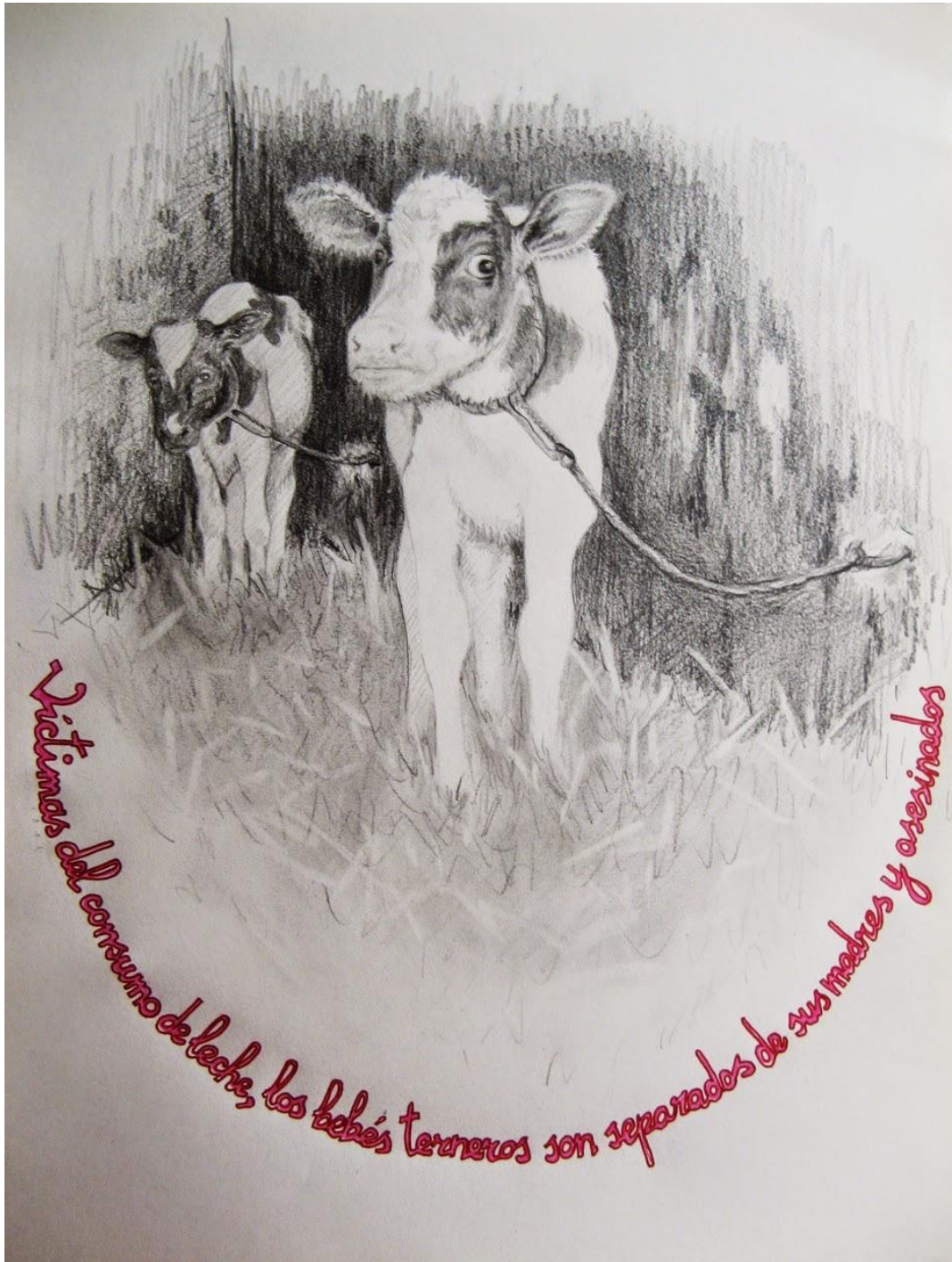
Ilustración 5 Por un sabor, 2010, Roma Velarde, disponible en: http://roma-velarde.blogspot.mx/p/dibujos-drawing.html