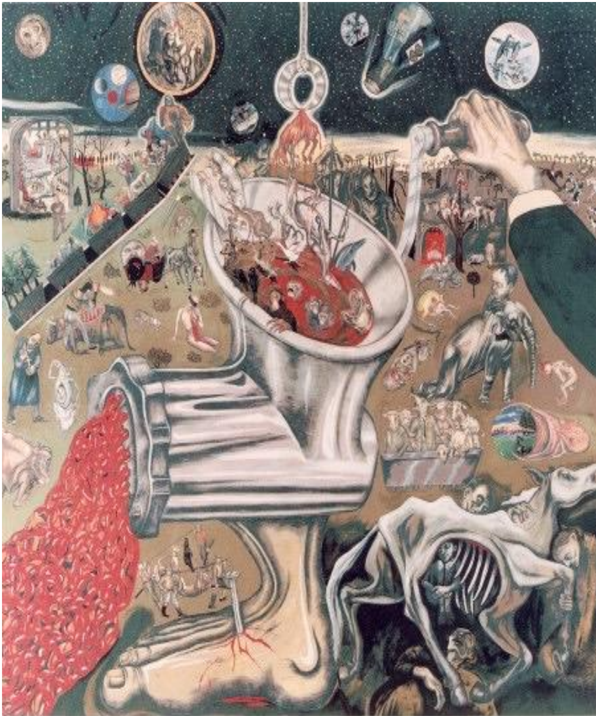
Ilustración 2. Sue, Coe. Second Millenium , Abril 9 2010, National Museum of Woman in the Arts. Disponible en: http://broadstrokes.org/2010/04/09/from-nmwas-vault-sue-coe/ . Se sugiere ver la obra desde el sitio web del museo en pantalla completa para una mejor visualización de los elementos.