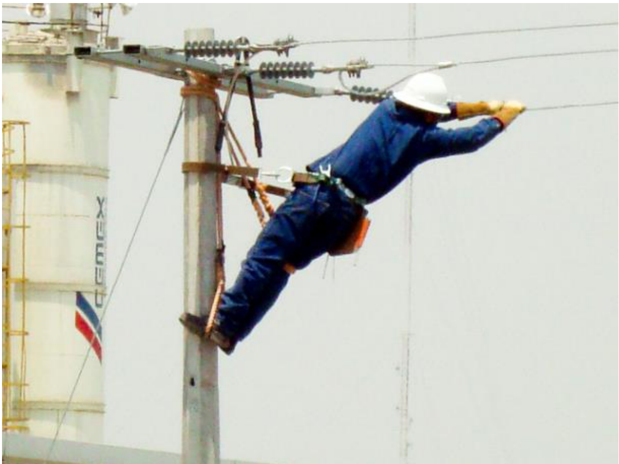
EN EL POSTE.

El Centro de Capacitación de Ermita diseñó un campo de entrenamiento especializado en redes subterráneas, simulando en escenario en el que tendrán que desarrollarse más adelante; este campo esta desenergizado