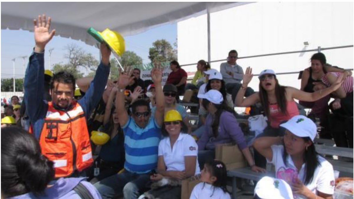
LOS FAMILIARES APOYANDO

La familia tiene un papel muy importante en estas competencias, se instalan gradas al pie del campo de entrenamiento para que puedan apoyar a su familiar durante la maniobra.