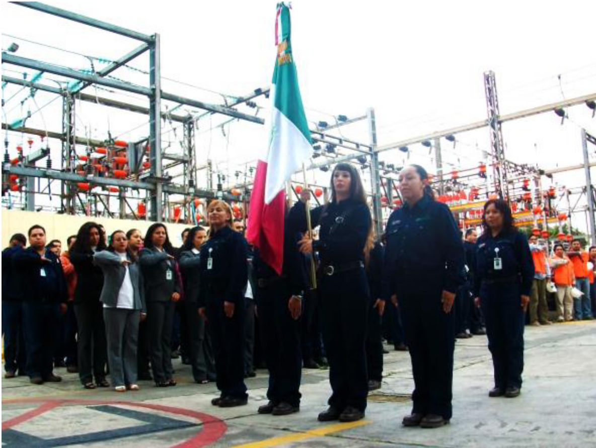
HONORES A LA BANDERA.

La mañana del martes 13 de septiembre del 2011 comienza una nueva etapa para la Comisión Federal de Electricidad con un evento que marcaría a todos en la ciudad de México: la graduación de una generación de linieros de la División de Distribución Valle de México Sur, en el campo de entrenamiento de Ermita.