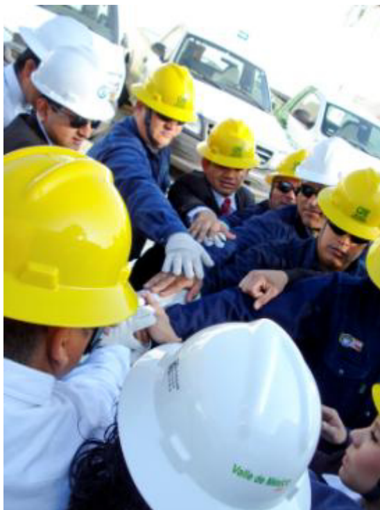
LA UNIÓN HACE LA FUERZA..

Por supuesto también está preocupado por su seguridad y por eso antes de realizar una maniobra vuelve a revisar el procedimiento junto con su pareja (compañero de trabajo) para evitar errores que pudieran provocar un accidente mortal.