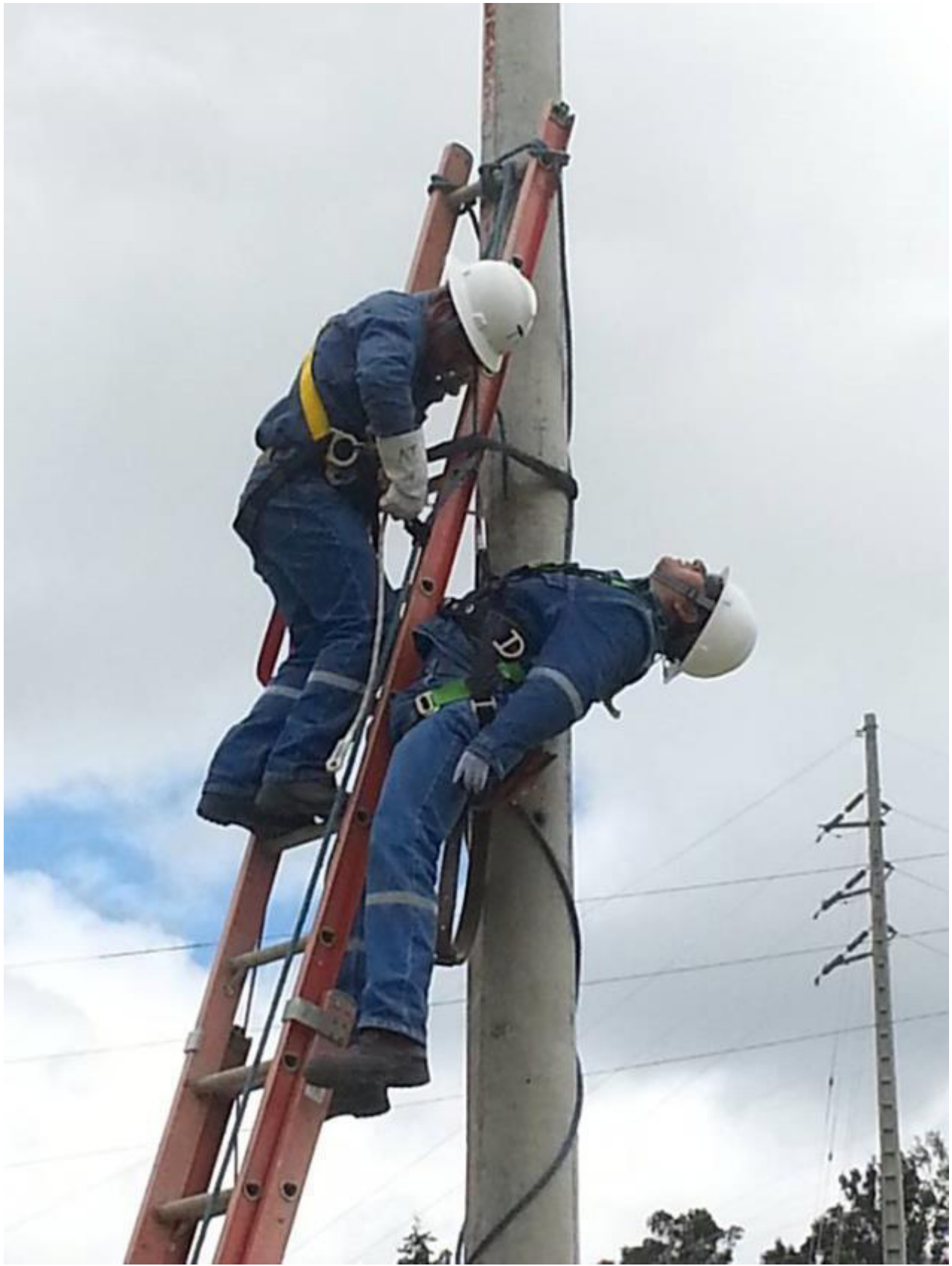
RECREACIÓN RESCATE DE UN LINIERO.