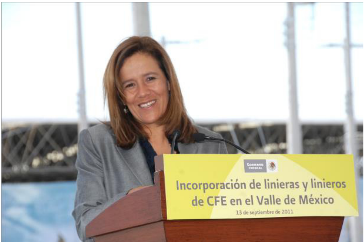
LIC. MARGARITA ZAVALA.

Esta ceremonia fue encabezada por la Lic. Margarita Zavala Gómez del Campo, la entonces primera dama del gobierno mexicano, quien expresó su alegría y orgullo por estas mujeres que iniciaban su carrera laboral en CFE dentro de un ambiente competitivo. Ésta también fue una muestra muy importante de la equidad de género, al menos dentro de la comisión.