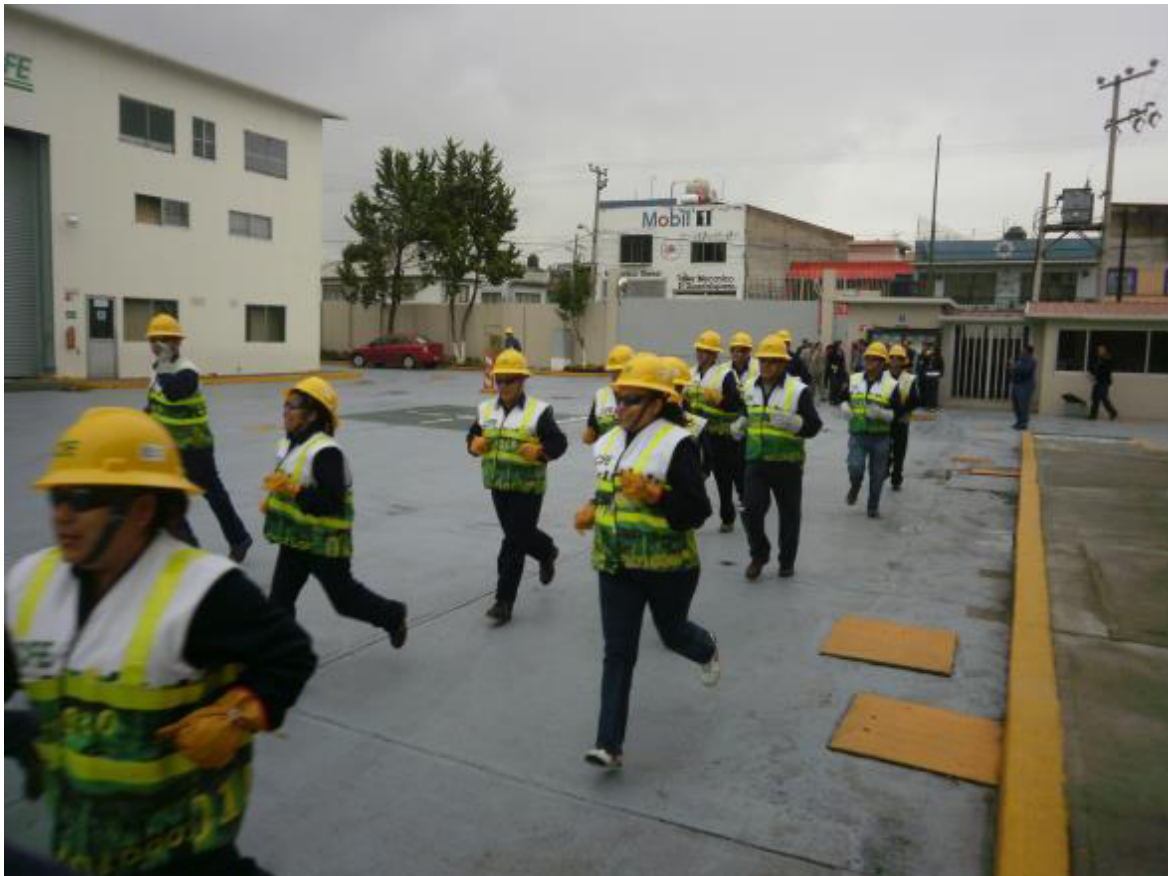
DEMOSTRACIÓN DE ENTRENAMIENTO.

En esta ocasión se entrevistó con el contador de una importante agencia de automóviles para regularizar su adeudo, la suma alcanzaba los tres millones de pesos, ella sabía lo importante que era recuperar esta cantidad exorbitante de dinero y el reconocimiento que obtendría de sus compañeras, compañeros y superiores, pero sobretodo, sentiría una gran satisfacción de lograrlo.