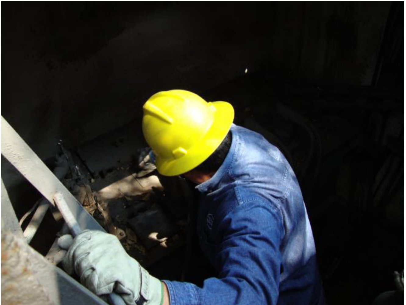
LLEGANDO A LA SUBESTACIÓN SUBTERRÁNEA.

Pero todavía existen otros tipos de linieros: los que realizan la instalación de mufas y de medidores, los cuales le ayudan a CFE a saber el consumo de energía. Estos linieros están igualmente capacitados para tomar lectura mensual y bimensual de los medidores y en caso de encontrar alguna falla poder repararla.