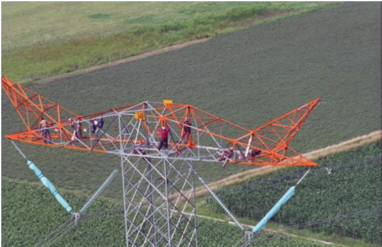
PINTANDO DESDE LAS ALTURAS

Dentro del gran mundo de la CFE existe otra gran vertiente de linieros que se encarga de tomar lecturas, cortes y reconexiones de energía eléctrica, instalación y mantenimientos de medidores y el restablecimiento del servicio.