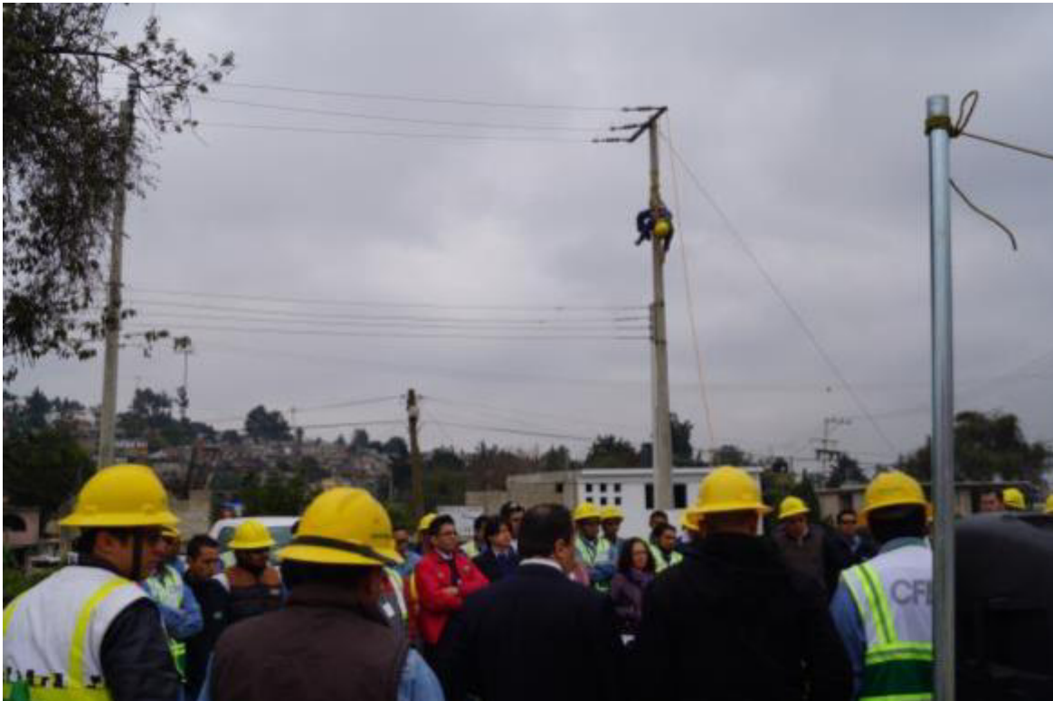
DEMOSTRACION LINIERO ACCIDENTADO

Estos son consejos que solo una persona que las ha vivido podrá dar con la certeza de que son efectivos. Siempre es importante escuchar a aquellos que llevan tiempo en esta profesión y que por lo mismo se han enfrentado a buenas y malas experiencias. La seguridad de estos hombres es algo que no puede perderse de vista ni un solo segundo.