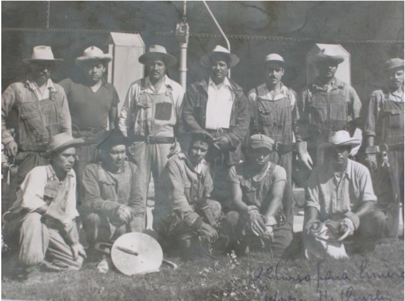
EL INICIO.

La generación de energía eléctrica inició en México a fines del siglo XIX.