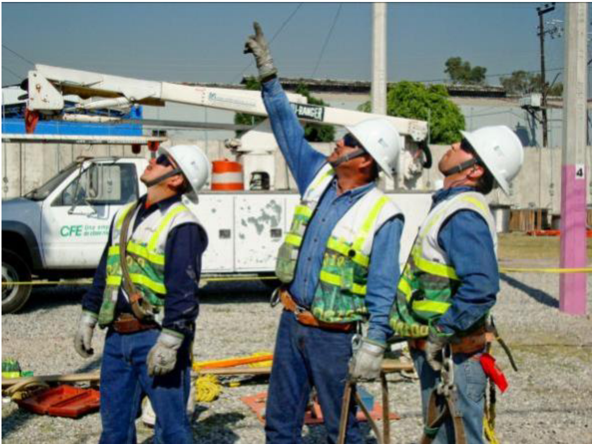
ENSEÑANDO LA LECCIÓN.

Los aspirantes a linieros observan cómo instalar un poste además del ascenso y descenso del mismo, electricidad básica, historia y valores de la empresa y el SUTERM, calidad en el servicio y principios de física; para su formación es necesario que conozcan todas las herramientas que necesitan para el trabajo cotidiano y las normas de seguridad ya que lo más valioso en su vida y va sobre cualquier indicador o productividad.