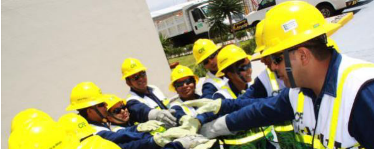
SIEMPRE EN EQUIPO.

Al llegar los policías la señora no tuvo otra opción más que permitir que le quitaran la luz y se dirigiera al centro más cercano a pagar su adeudo.