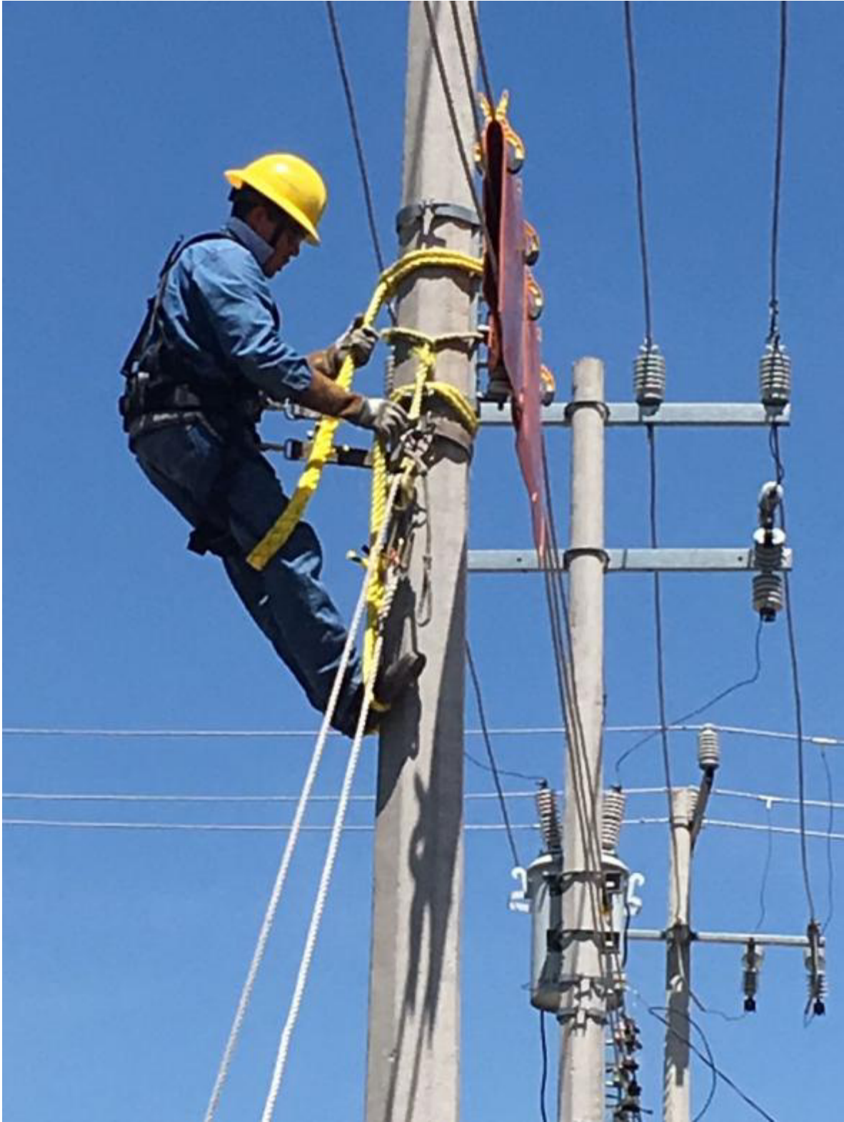
VENCENDO EL MIEDO.