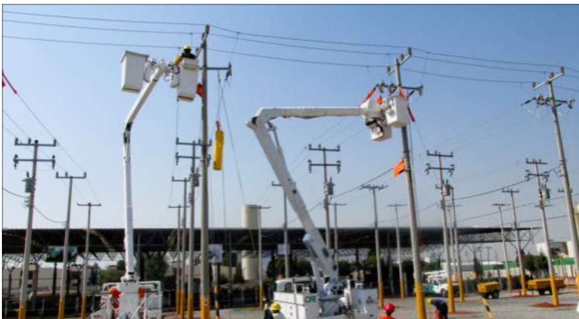
USANDO LA GRÚA.

Una vez que terminaron y aprobaron su formación básica de línea viva son canalizados según sus aptitudes al siguiente proceso de formación "curso de línea viva." Durante esta etapa deben analizar las maniobras o trabajo que van a realizar con un grado de complejidad mayor y también con una nueva responsabilidad.