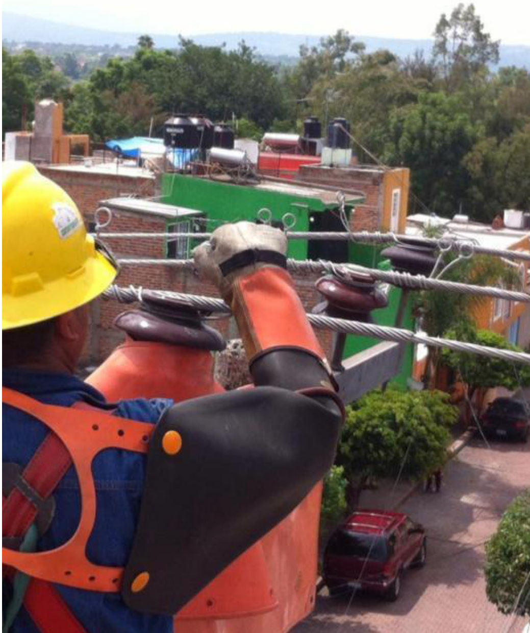
LUZ PARA EL MAÑANA.

Las fotos reflejaron mucho más que las palabras y es por ello que esta investigación estuvo acompañada de una serie de imágenes que hablaron por sí solas.