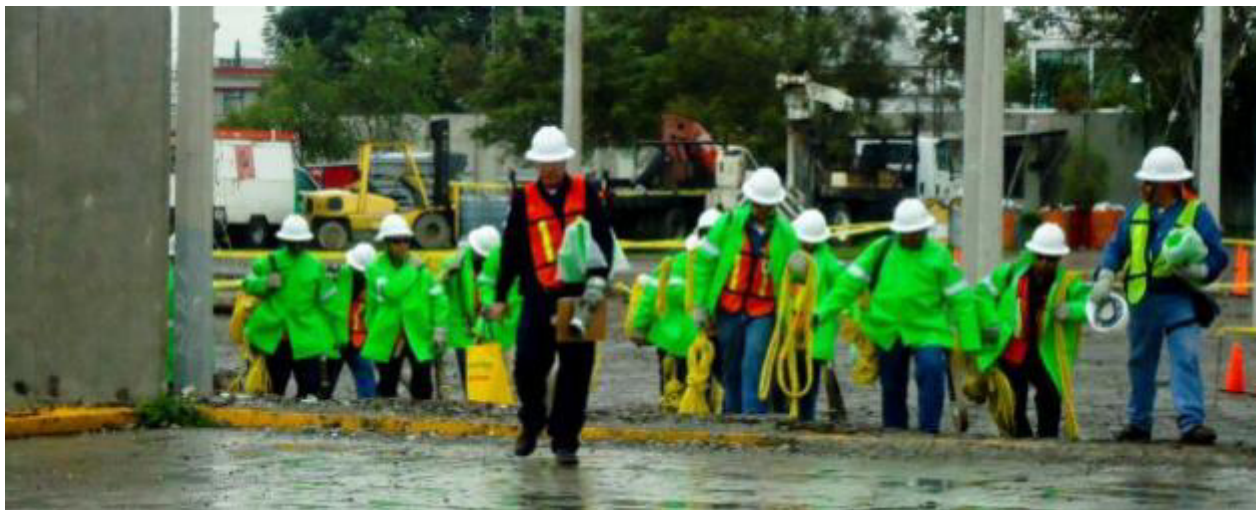
INICIANDO LA JORNADA.