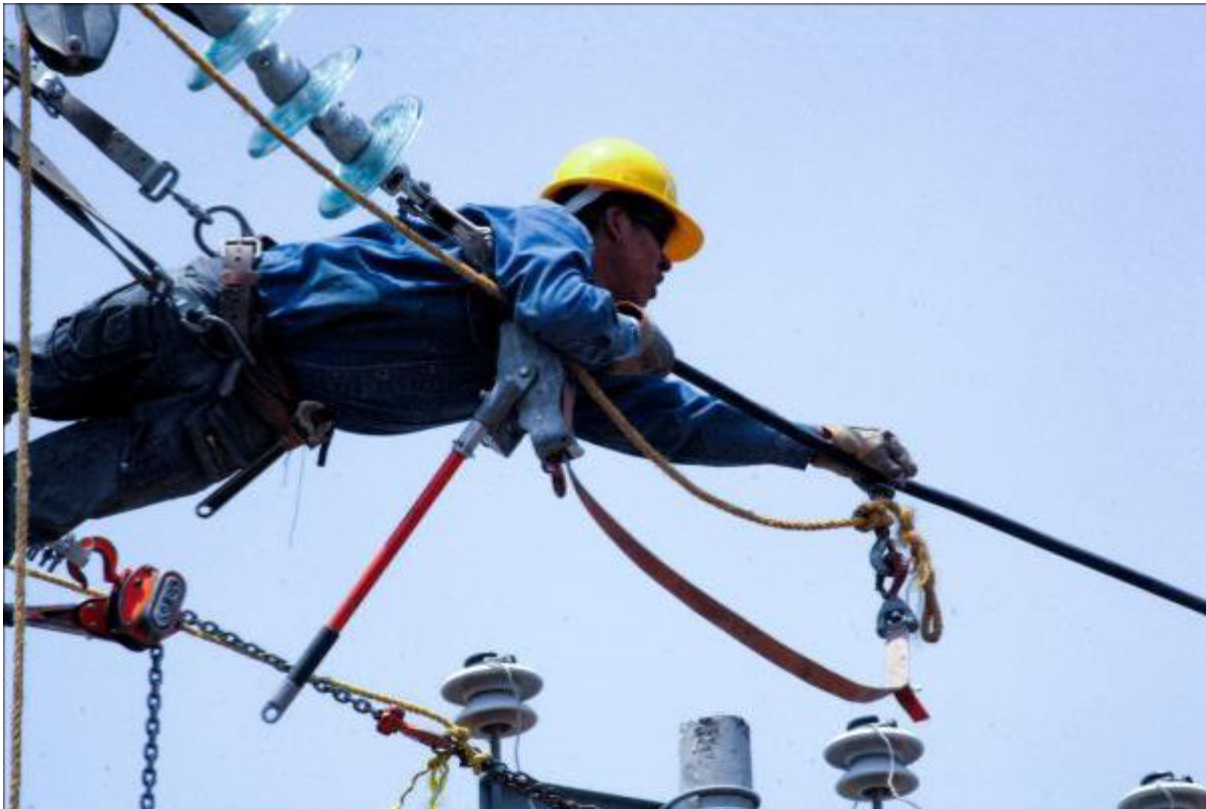
EN LA MANIOBRA.

¿Qué es lo que sucede cuando se te va la luz? En esos casos se reporta la falta de luz al 071, después se crea un reporte que se manda a la oficina de despacho, trabaja las 24 horas los 365 días del año, y ahí se asigna una cuadrilla de linieros utilizando el geoposicionamiento, usualmente la que esté más cerca del lugar va a revisar el problema y restablecer el servicio eléctrico.