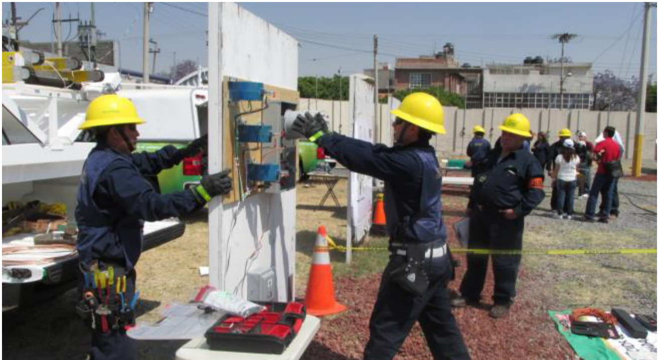
EN EL TORNEO DE LINIEROS

No todo debe ser siempre seriedad, y con la intención de crear un ambiente sano y competitivo, CFE organiza un torneo de linieros en el que pone en marcha todas sus capacidades, habilidades, conocimientos y aptitudes para desarrollar algunas de las maniobras que realizan todos los días. Esto en compañía de su familia y amigos.