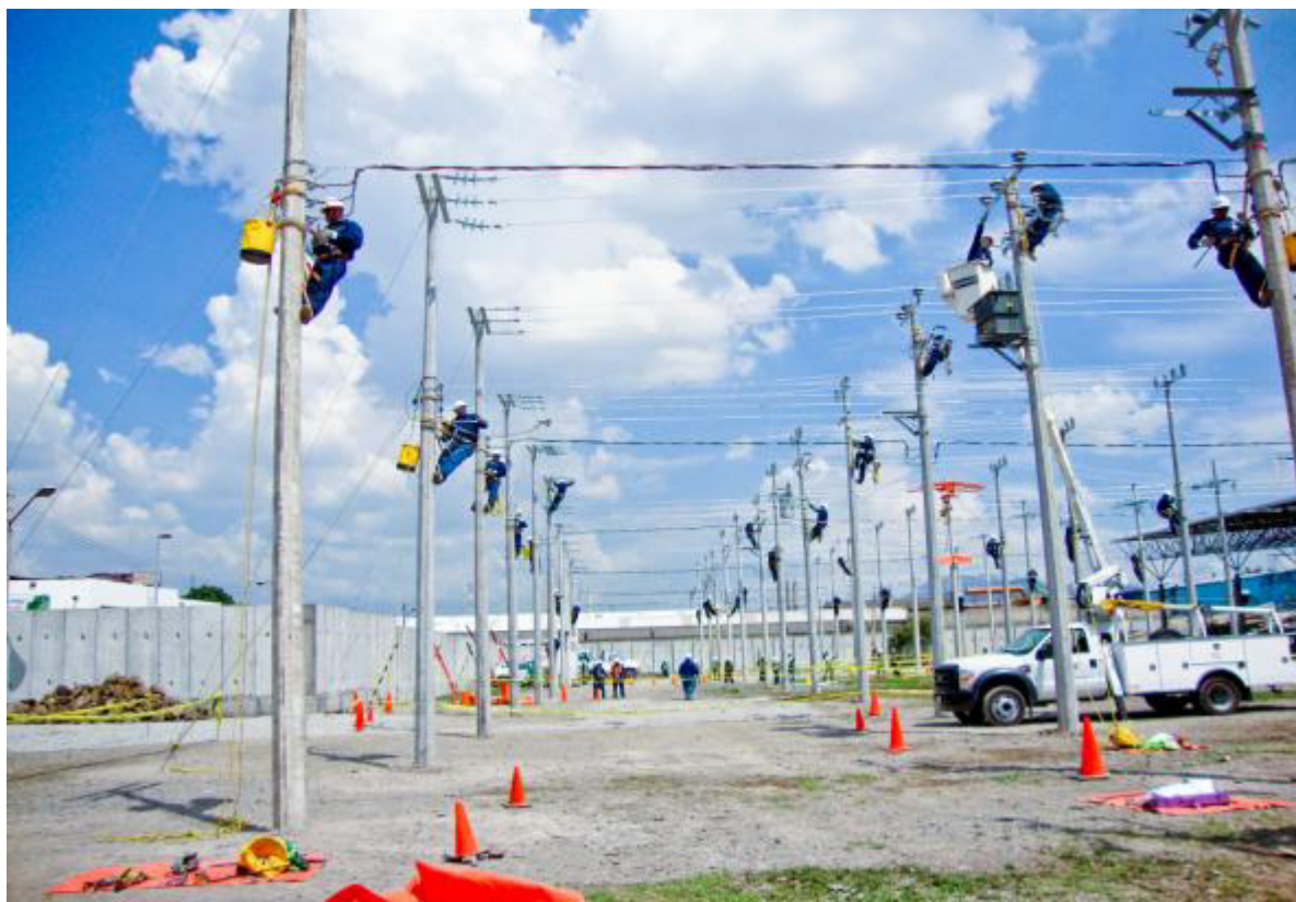
CAPACITACIÓN EN BAJA TENSIÓN.