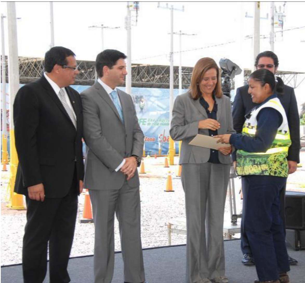
RECIBIENDO EL RECONOMIENTO

Se dice fácil pero no lo es: se les encomendaron trabajos en donde no se respetan horarios; pueden trabajar de lunes a domingo a cualquier hora. Ellas iniciaron en el Centro de Servicio al Cliente, donde las jornadas