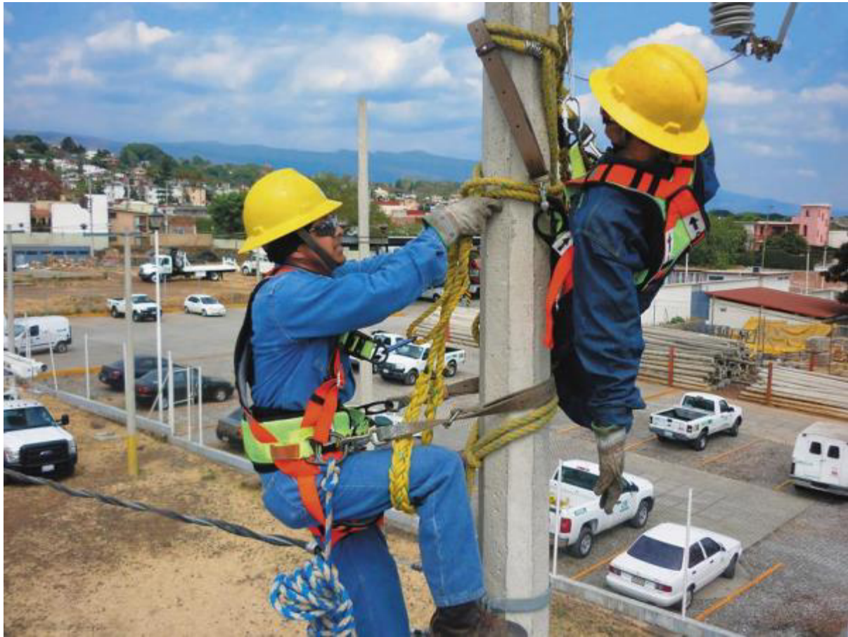
RESCATE DE LINIERO ACCIDENTADO MANIQUI