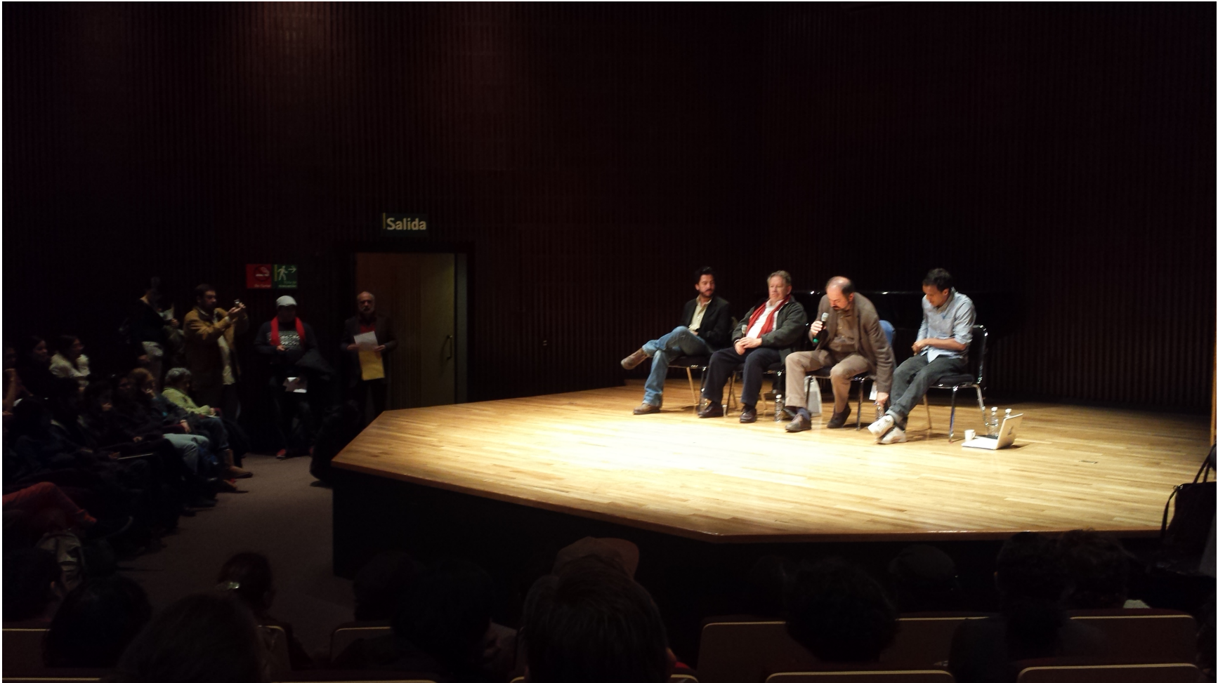
"Coloquio. Tradición e Innovación en el Teatro". 14 de noviembre de 2013. Centro Cultural Universitario UNAM. Sala Carlos Chávez. Ciudad de México. Imagen 1