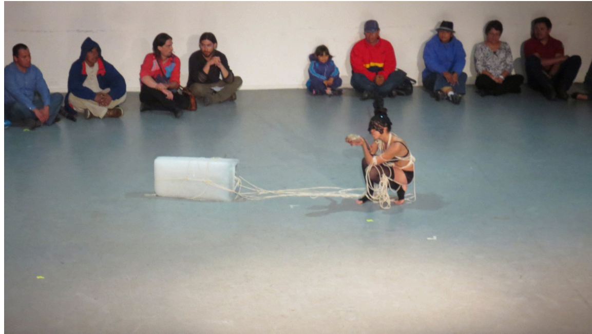
Fotografía: Ulises Ortega. "Lengua de Vaca". Exploración Actos Teatrales y Performativos. 29 de abril de 2015. On-Off Circuito de Arte del Movimiento. Día Internacional de la Danza. Teatro de la Ciudad. Ciudad de Puebla. Imagen proporcionada por su titular bajo su permiso estricto. Imagen 10