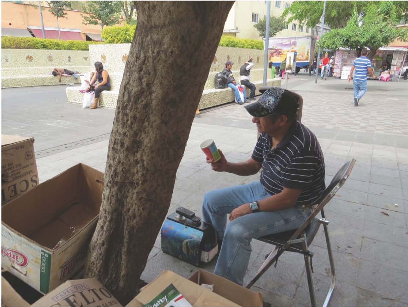
"Limpia Botas". 16 de octubre de 2014. Plaza de la Aguilita. Ciudad de México. Imagen 6