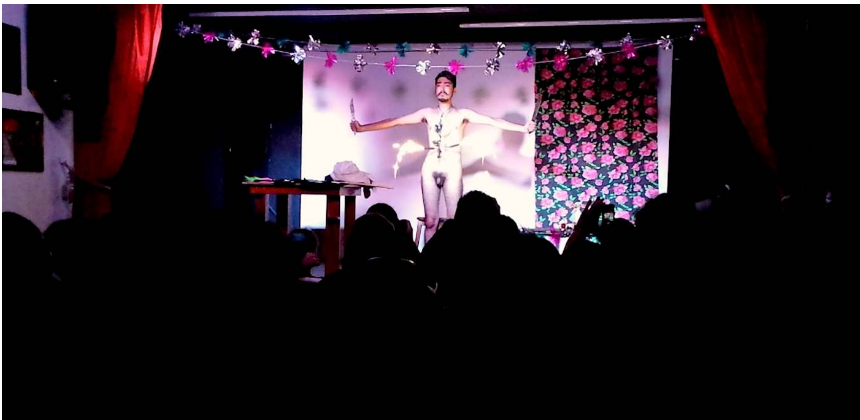
Fotografía: Gabriel Bonilla. Performance "Pensamiento Puñal" de Felipe Osornio Panini. 26 de septiembre de 2013. EXTRA. 3ra. edición Festival Internacional de Performance . Sala del Centro Cultural Xavier Villurrutia. Ciudad de México. (Archivo personal del autor). Imagen 5