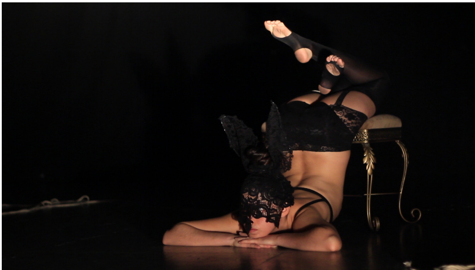
Fotografía: Sara González. "Lengua de Vaca". Exploración Actos Teatrales y Performativos. 28 de julio de 2015. Teatro de la Ciudad. Ciudad de Puebla. Imagen proporcionada por su titular bajo su permiso estricto. Imagen 11