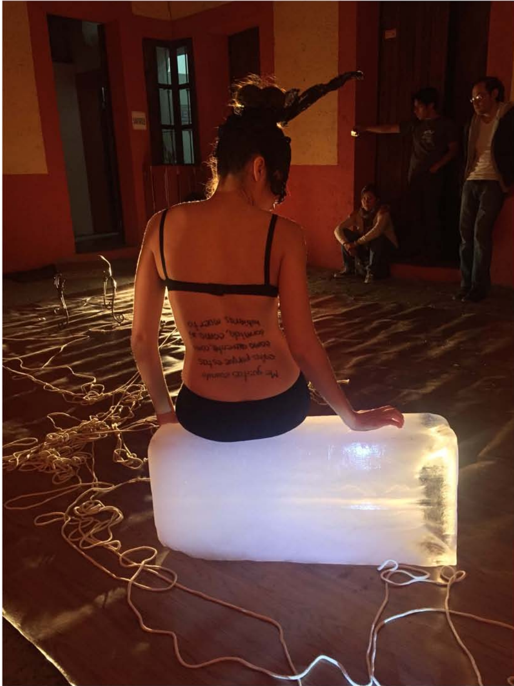
Fotografía: Gerardo Jiménez. "Lengua de Vaca". Exploración Actos Teatrales y Performativos. 22 de octubre de 2016. Digresión: Noches de Performance . Galería D'Los. Ciudad de Puebla. Imagen proporcionada por su titular bajo su permiso estricto. Imagen 12