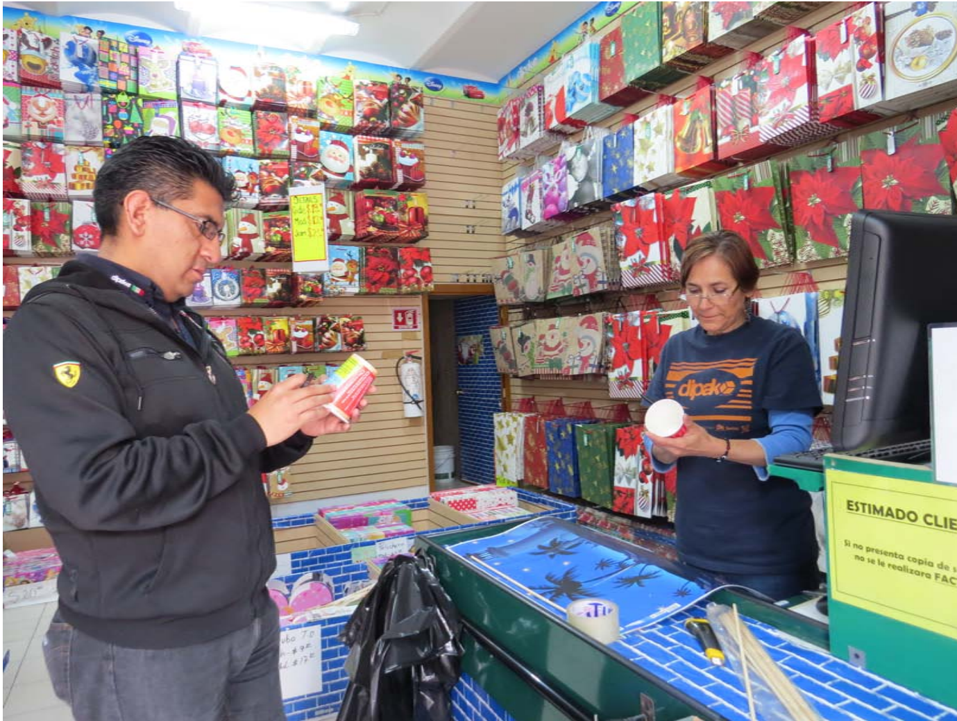
"Locataria y Comprador". 23 de octubre de 2014. Plaza de la Aguilita. Ciudad de México. Imagen 7