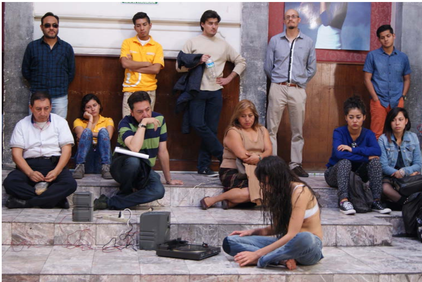
Fotografía: Gabriel Bonilla. "Lengua de Vaca". Exploración Actos Teatrales y Performativos. 2 de febrero de 2015. Centro Cultural Espacio 1900. Ciudad de Puebla. (Archivo personal del autor). Imagen 9