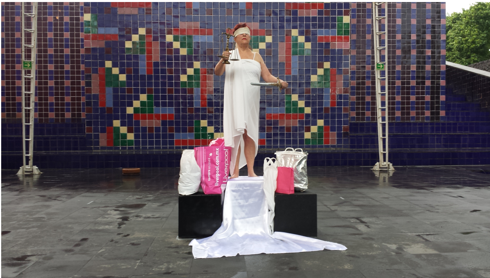
Performance "La Justicia" de María Eugenia Chellet. 27 de mayo de 2015. Encuentro Internacional Poética de la Acción. Centro Nacional de las Artes. Ciudad de México. Imagen 4