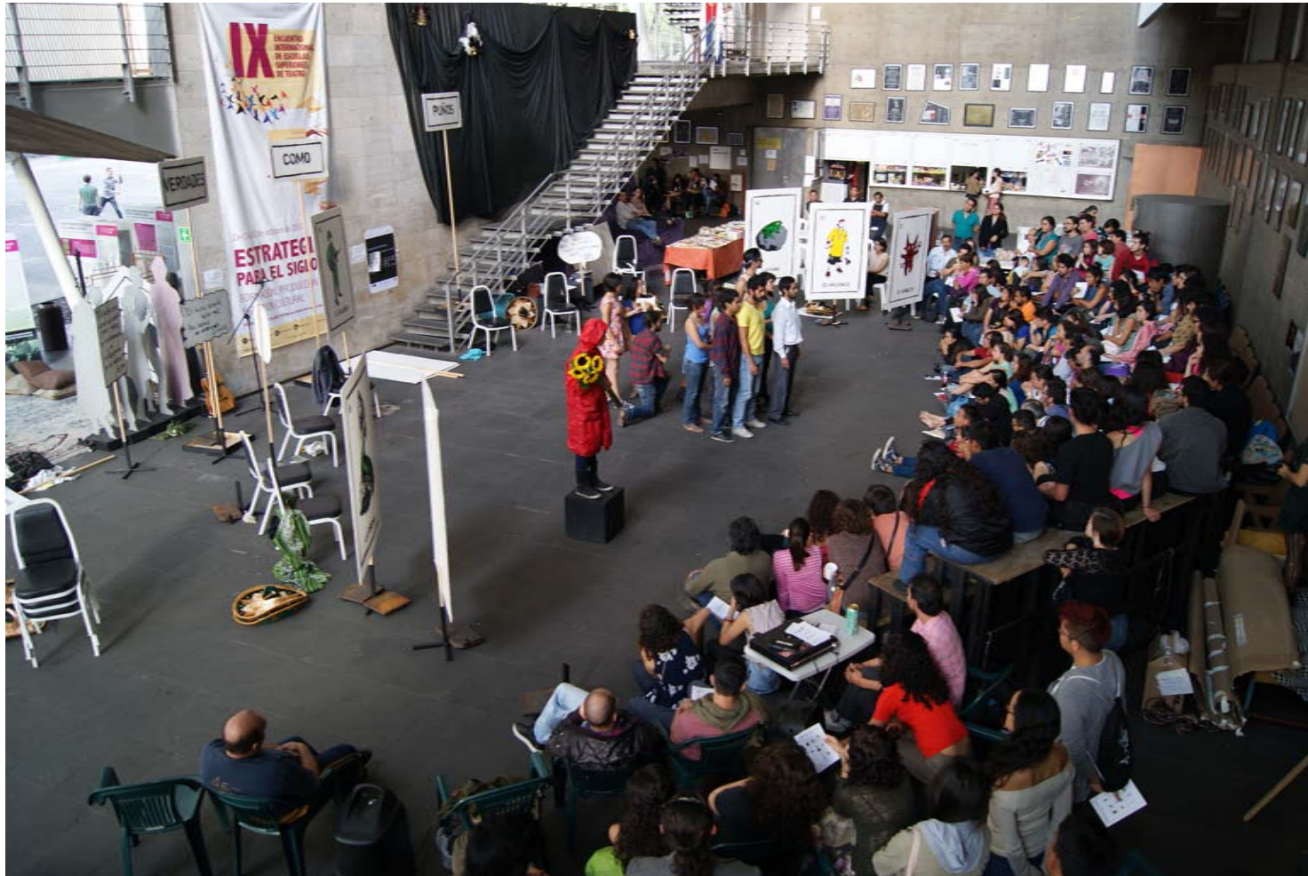
Fotografía: Gabriel Bonilla. Obra: Verdades como Puños. 12 de octubre de 2013. "IX Encuentro Internacional de Escuelas Superiores de Teatro". Escuela Nacional de Arte Teatral. Centro Nacional de las Artes. Ciudad de México. (Archivo personal del autor). Imagen 2