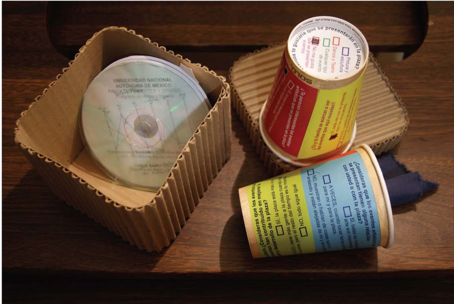
"Caja de Tendencias". 29 de noviembre de 2014. Ciudad de México. Imagen 8