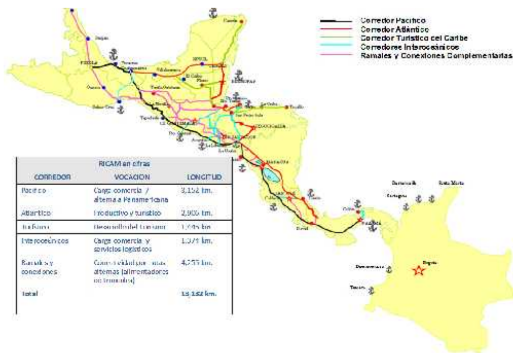
Mapa 3 Corredores viales de la Red Internacional de Carreteras mesoamericanas (RICAM)