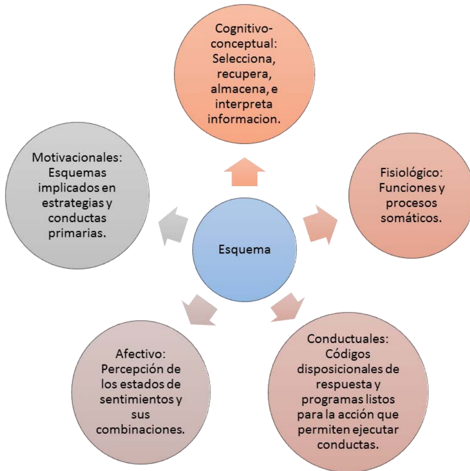
Figura 3: Tipo principales de esquemas (Clark, Beck y Alford, 1999, citado en Gabalda 2009).

van forman desde las experiencias de la infancia. La persona aprende a evaluarse a sí mismo y al ambiente, mediante la interacción con las otras personas significativas y a construir la realidad a través de la experiencia persona.