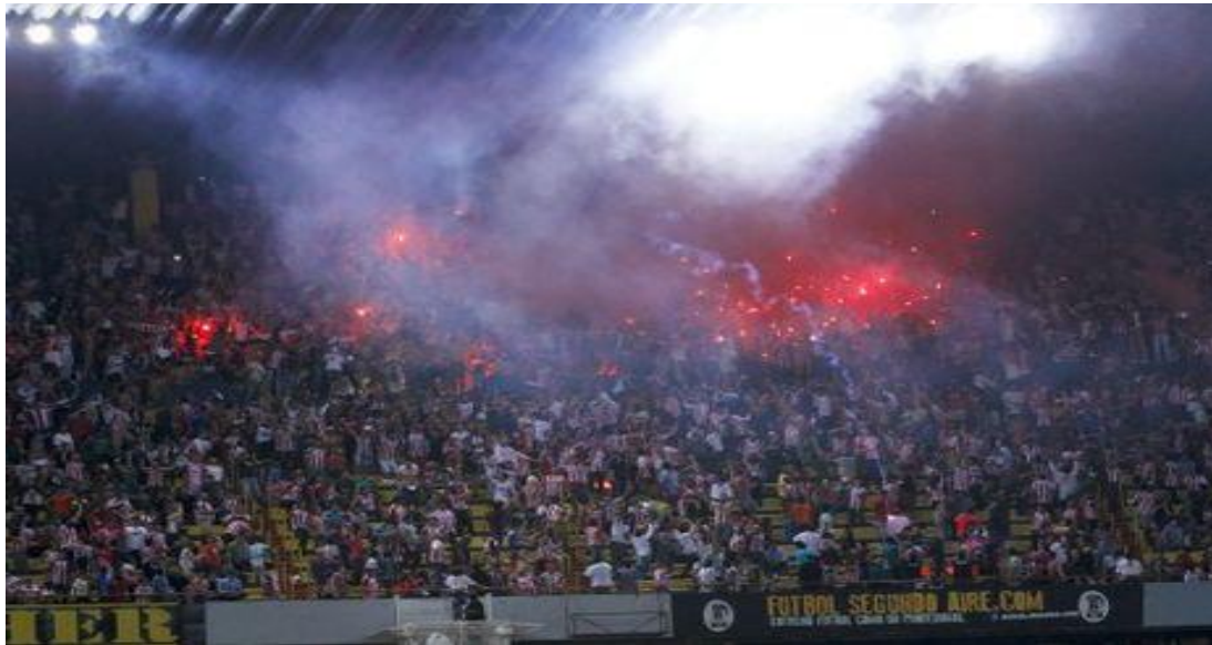
Barra de Chivas hizo uso de las bengalas durante el partido.

policías heridos gravemente y tan sólo 7 detenidos. Ni la muerte nos va a separar, desde el cielo te voy a alentar.