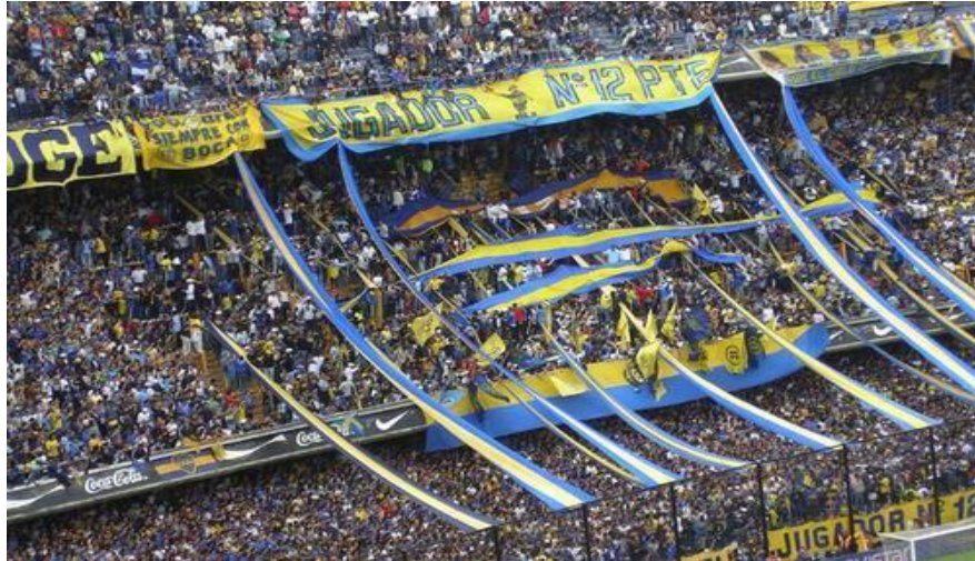
La Doce, una de las barras bravas con más poder en el fútbol argentino.

“La Rebel”, como otras barras en México, trató de igualar la decoración en las tribunas de los estadios con estos lienzos. Sin embargo, desde la prohibición a los estadios, en el 2010, por parte del ex secretario de la FMF, Decio de María, quien fue puesto como Presidente de la Federación Mexicana de Fútbol el pasado 1 de agosto, las barras tomaron otras opciones de poner el colorido en las tribunas, como los mosaicos. La barra de Tigres, conocida como los “Libres y Lokos”, en la edición 105 del Clásico Regio, donde los Tigres vencieron 3-1 a Monterrey, partido correspondiente a la jornada 9 del Apertura 2015, la barra formó una U con pancartas alusivas a los colores del equipo. El resultado, fue el siguiente: