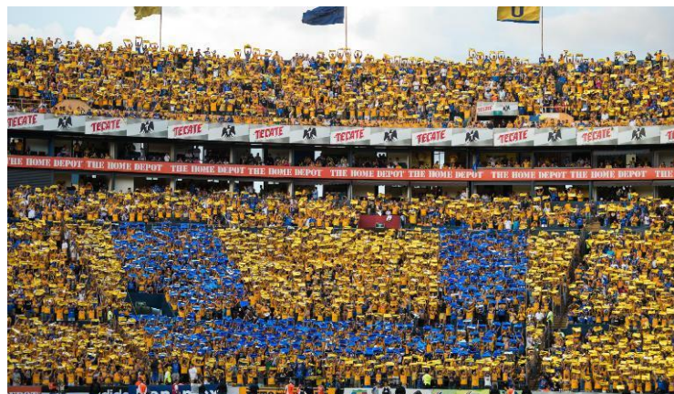
Mosaico de La U, de los Libres y Lokos, en la edición 105 del Clásico Regio.