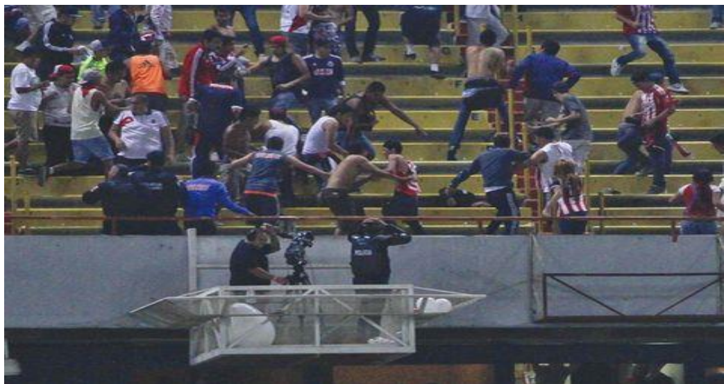
Durante la pelea contra policías en el estadio Jalisco.