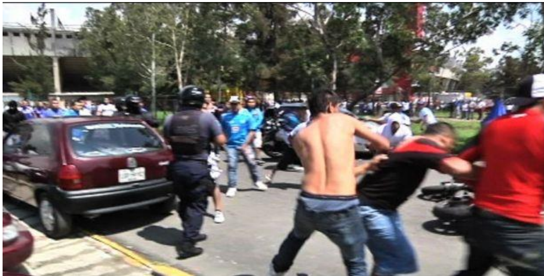
Barristas de Cruz Azul y Neza se enfrentaron previo al partido de Copa MX.

1 de agosto del 2012. Cruz Azul visita el estadio Neza, partido correspondiente a la Copa MX. Minutos antes de que inicie el encuentro, “La Sangre Azul” se encuentra a la barra del equipo Toros Neza, “La Mancha de Neza”, y se enfrascan en una riña en la puerta 1 del estadio. Autoridades señalan que la escena no pasó a mayores. Ni la muerte nos va a separar, desde el cielo te voy a alentar.