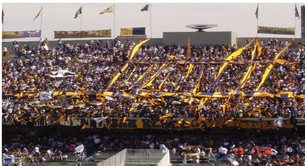
La Rebel se asimila a La Doce del club Boca Juniors de Argentina.

Tercera línea: El grupo de aficionados que sirve para combatir.