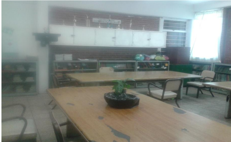
Sala de maestros

En el otro costado del edificio están los lockers de los maestros los cuales son muchos y casi no hay cabida para tantos. Está el área de contraloría donde se encargan de resguardar el material que se va a utilizar para el mantenimiento de la escuela. Subiendo la escalera está la dirección del plantel tanto del turno matutino como del turno vespertino, son oficinas por separado, el área destinada para la mañana están las secretarías que son seis una por cada grupo, el espacio para subdirección y la oficina del director quien también cuenta con su secretaria.