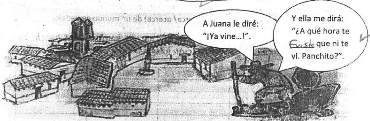
Ilustración 1. Español de México.

1.- A CONTINUACIÓN, SUBRAYA LA CORRECTA FORMA DE ESCRIBIR LOS VERBOS Y COMPLETA LA PREGUNTA: JUITES Y VINITES / FUISTE Y VINISTE / FUISTES Y VINISTES.