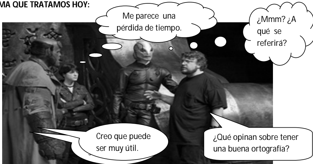
Ilustración 2. Imagen extraída del tráiler de la película: HellBoy II.

4.- FÍJATE EN LA SIGUIENTE IMAGEN Y COMPLETA LOS ESPACIOS EN BLANCO, DE ACUERDO AL TEMA QUE TRATAMOS HOY: