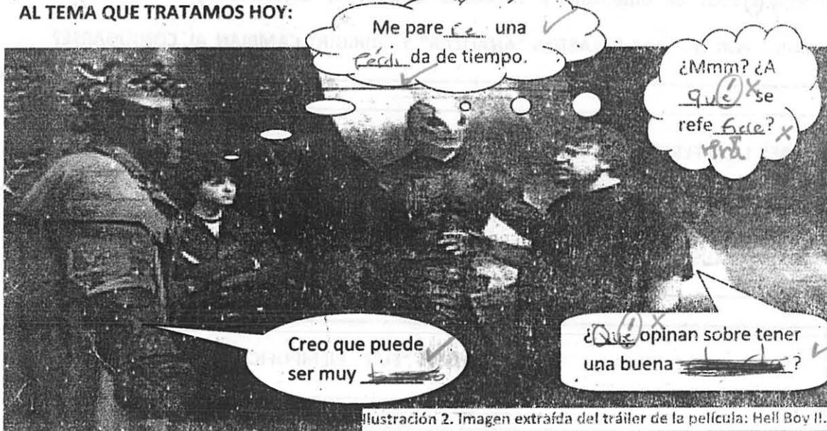
Ilustración 2. Imagen extraída del tráiler de la película: Hell Boy II.

4.- FÍJATE EN LA SIGUIENTE IMAGEN Y COMPLETA LOS ESPACIOS EN BLANCO, DE ACUERDO AL TEMA QUE TRATAMOS HOY: