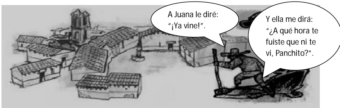
Ilustración 1. Español de México.

1.- A CONTINUACIÓN, SUBRAYA LA CORRECTA FORMA DE ESCRIBIR LOS VERBOS Y COMPLETA LA PREGUNTA: JUITES Y VINITES / FUISTE Y VINISTE / FUISTES Y VINISTES.