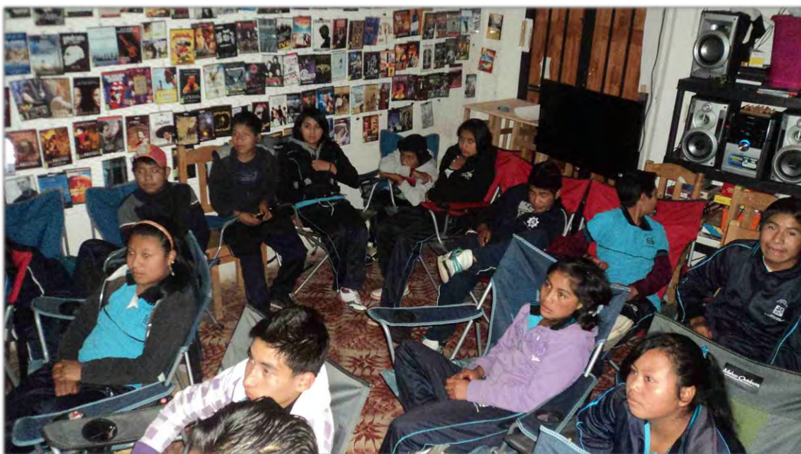
Cineclub con estudiantes de nivel medio superior.