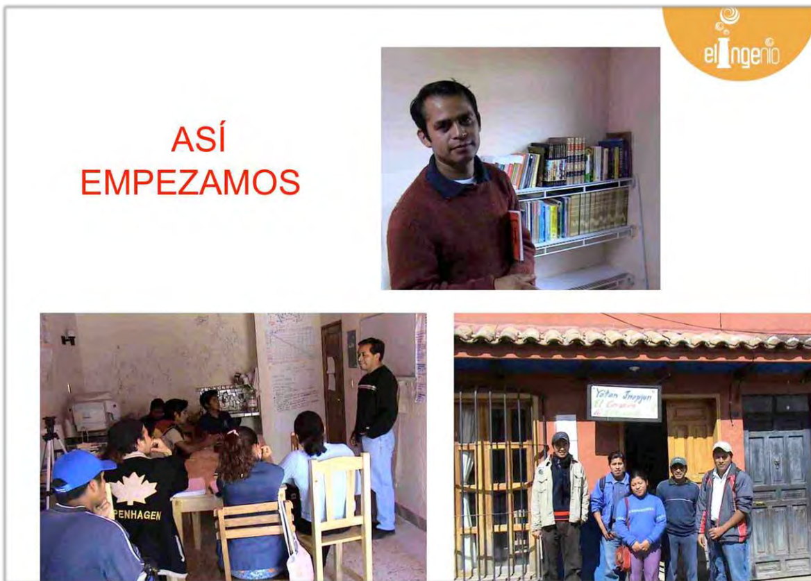
Inicios del proyecto Yo'tan Jnopjun del que deriva El Ingenio.