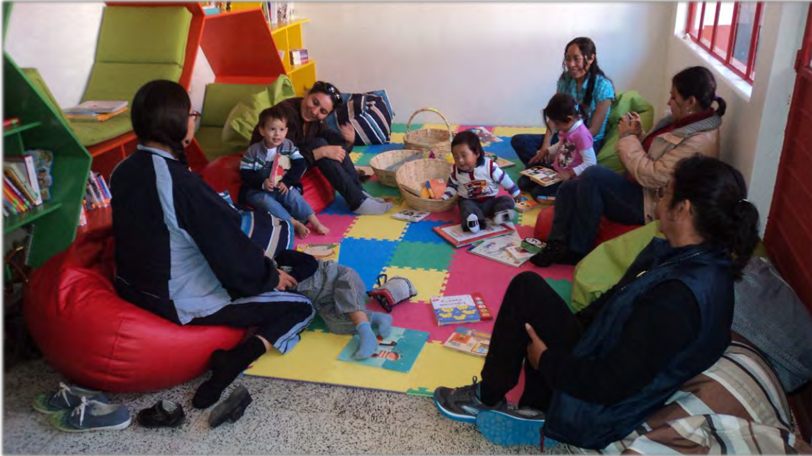
Bebeteca en San Cristóbal de las Casas. Espacio de descubrimiento de los libros con bebés, padres y madres de familia.