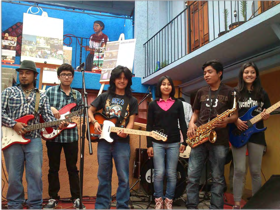
Presentación pública de ensamble musical en FOMMA A.C. (Fortaleza de la mujer maya)