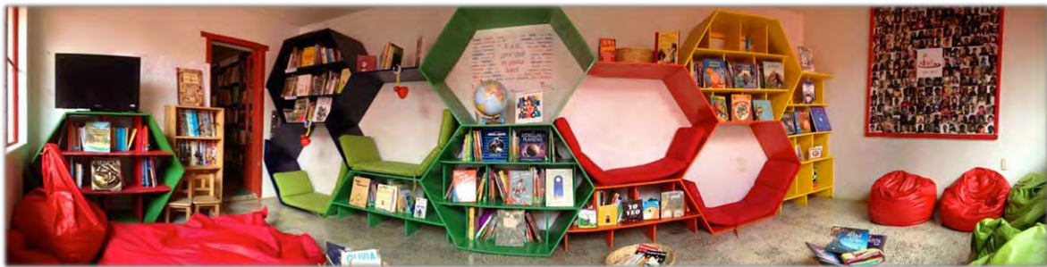
Colmenas de lectura. El Ingenio. San Cristóbal de las Casas, Chiapas.