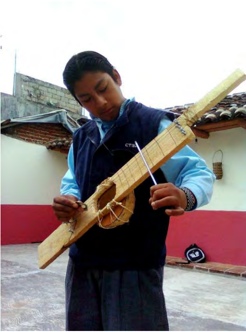
Cordófono, instrumento construido por jóvenes.