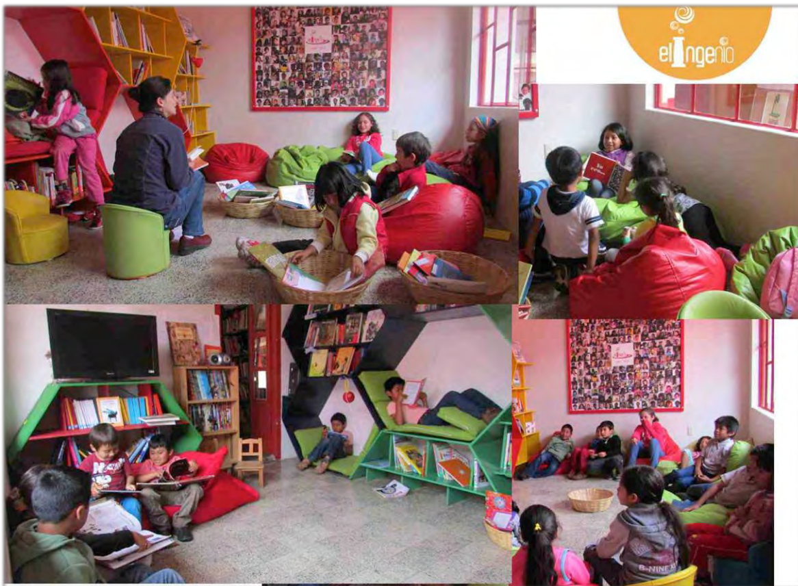
Actividades de animación de lectura en las Colmenas de lectura. San Cristóbal de las Casas, Chiapas.