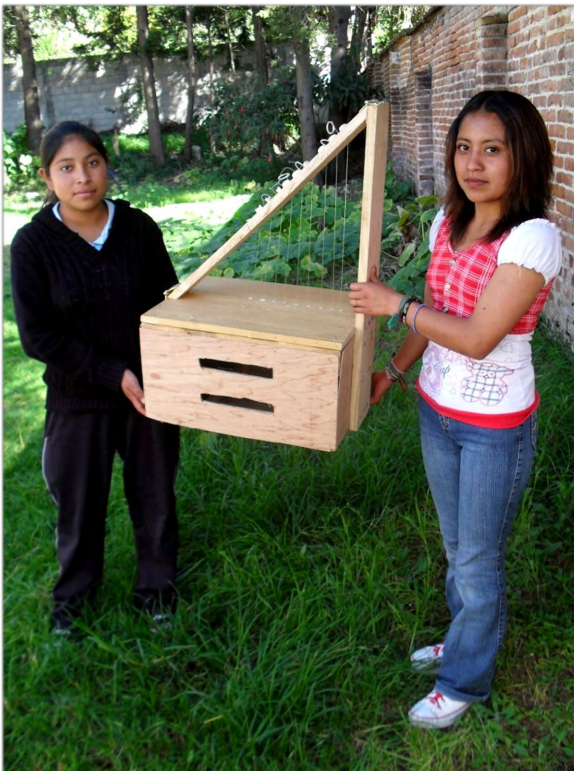
Arpa-huacal, instrumento construido por jóvenes.