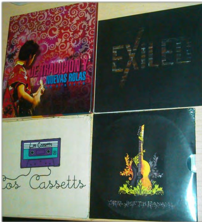
Discos producidos en El Ingenio.