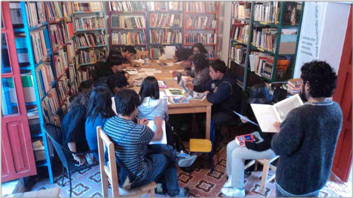
Taller de Creación literaria.