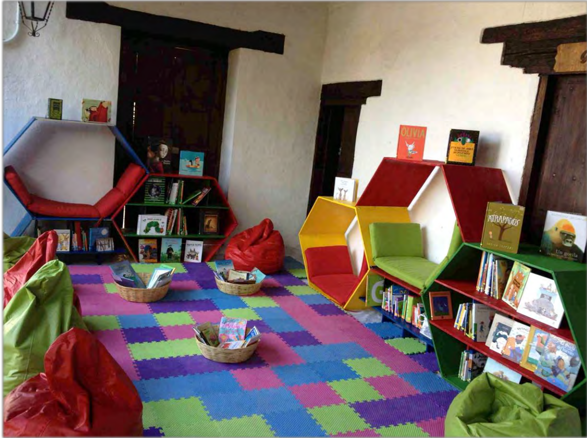
Colmenas de lectura Feria del Libro. San Cristóbal de las Casas, Chiapas.