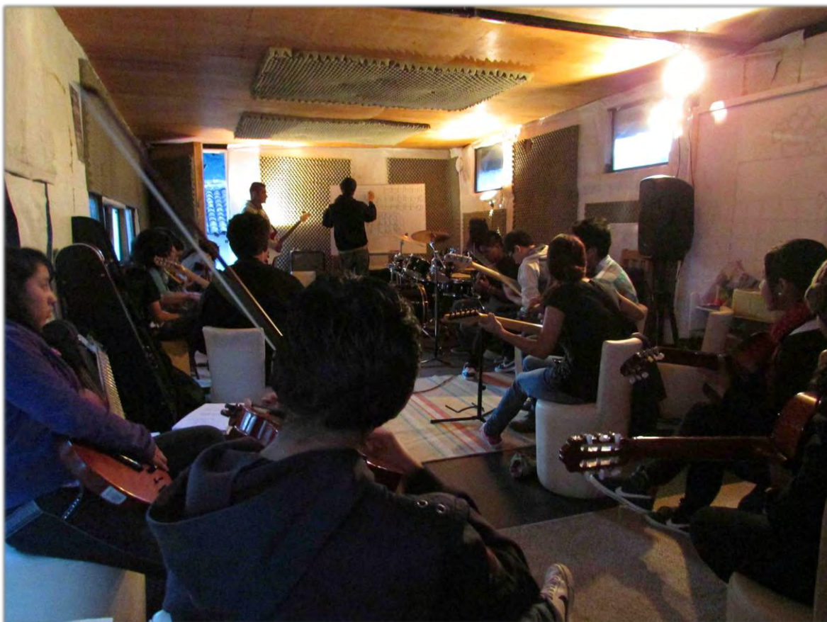
Sesión de composición colectiva y ensamble musical. El Ingenio.