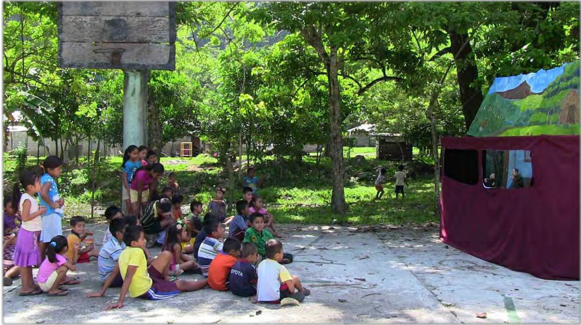
Programa de cultura de paz PNUD ONU. Títeres en lengua ch'ol, gira zona norte del estado de Chiapas.