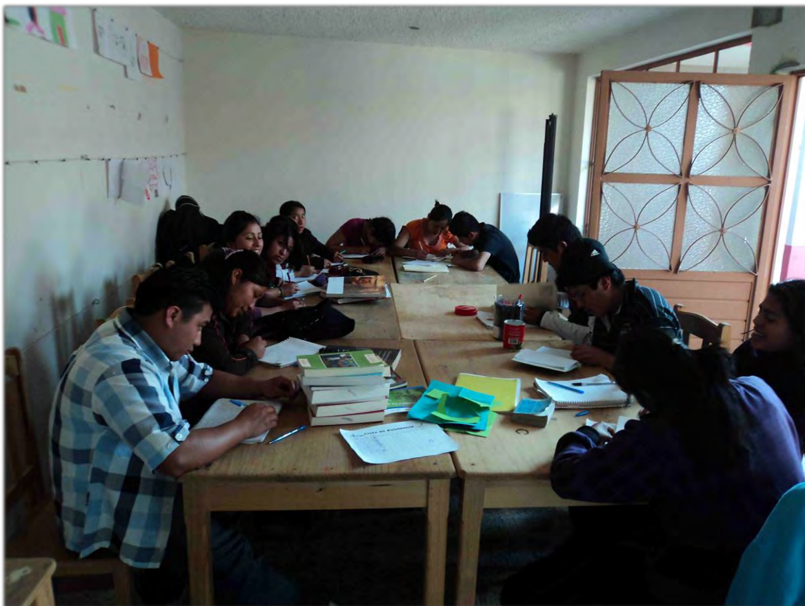
Taller de redacción y creación literaria.