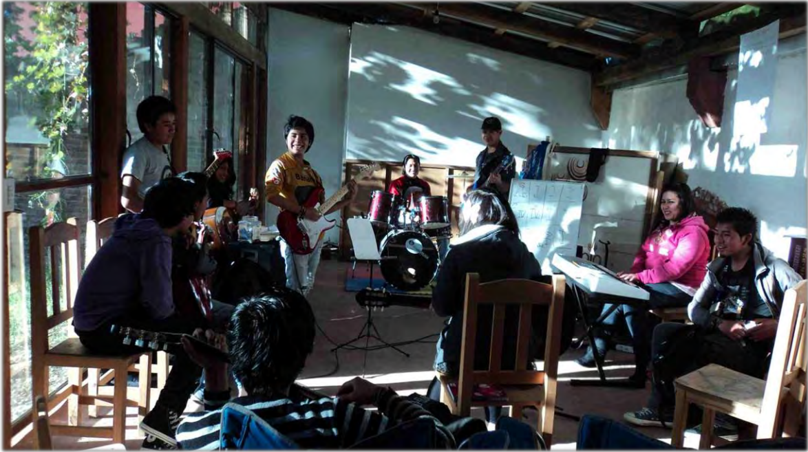
Composición lírica y musical colectiva.