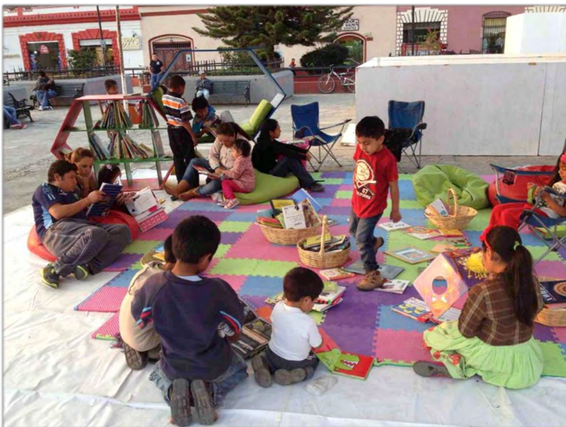
Espacios públicos de lectura. Plaza de la paz, San Cristóbal de las Casas, Chiapas.