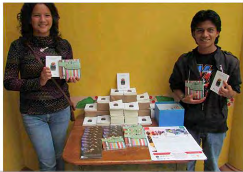
Presentación del libro El secreto de la simiente, colección de textos producidos por jóvenes en los talleres de Creación literaria. Muestra de discos y libros colectivos.