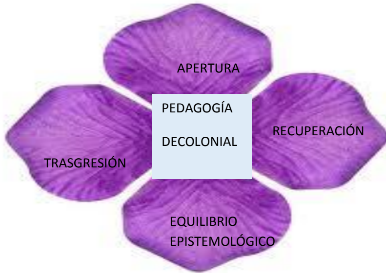
Figura 1 Flor pedagogía decolonial