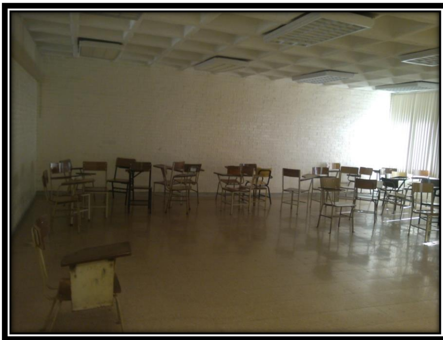
Figura 3 Salón del seminario de educación indígena.

El seminario de educación indígena está pensado para los estudiantes del séptimo semestre, como una unidad de conocimiento optativo, dentro de la línea eje de socio-pedagogía. La clase es de 3 horas, el salón asignado ha sido el 602, sin embargo, por cuestiones de salud del docente titular, se ha realizado un cambio reasignándose el salón 606 ubicado en la planta baja del edificio A-6, al final del pasillo. Es un salón amplio en espacio con respecto al salón anteriormente asignado.