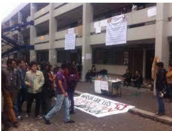
Figura 4 Explanada de la Facultad de Estudios Superiores Aragón.

Jueves 20 de noviembre son las 9:50 de la mañana, ingreso a la FES y camino dirección al edificio de pedagogía, al pasar por la explanada central se pueden ver pancartas que anuncian un paro activo de 48 horas, asimismo hay una jornada de información acerca de los 43 desaparecidos de Ayotzinapan