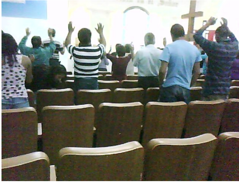
Durante la oración de sanación. Los fieles levantan las manos al cielo con la intención de recibir al Espíritu Santo.