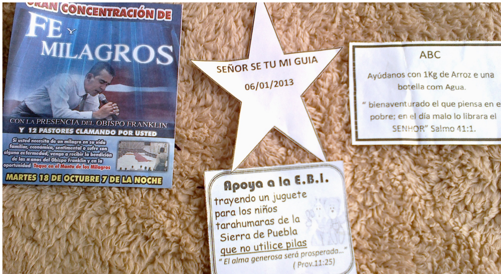
Panfletos informativos de servicios especiales y para apoyar a la iglesia en la ayuda a niños sin hogar.