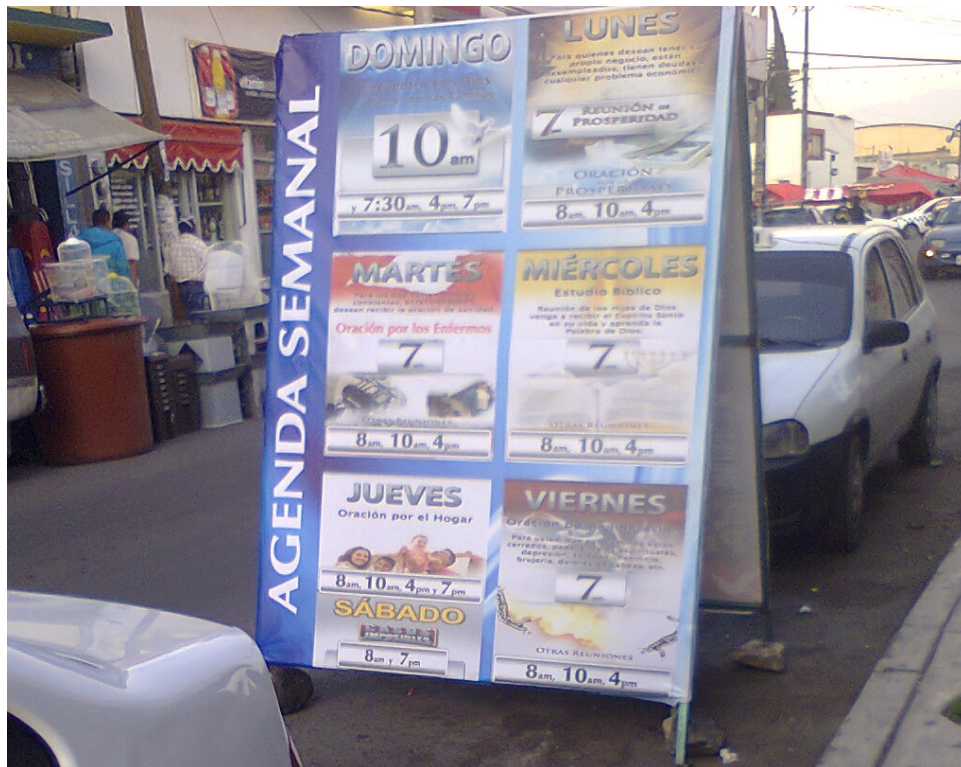
Frente a la iglesia, sobre la acera, se encuentra la lona informativa de los días de servicios, el propósito de estos y los horarios.