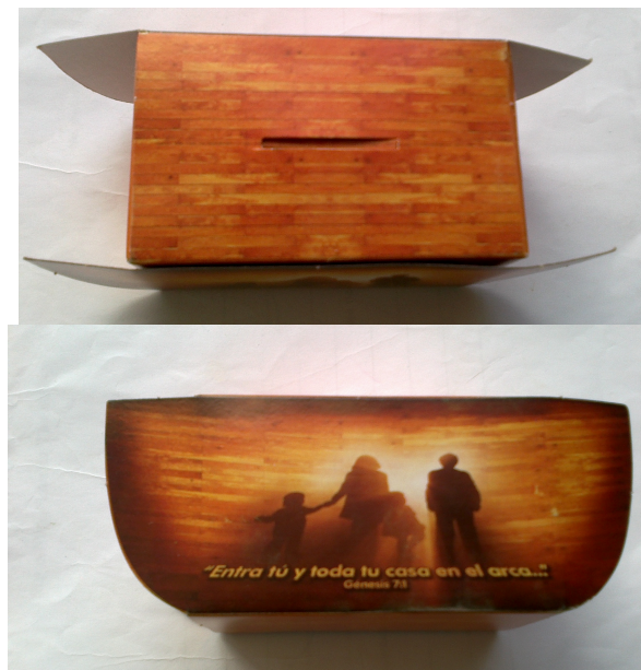
En esta arca se debían depositar 10 pesos diarios conforme se hacía una oración del libro de oraciones, una vez hechas todas las oraciones se llevaba a la iglesia y se depositaba en un arca de madera muy grande. Esto para protección de la familia.