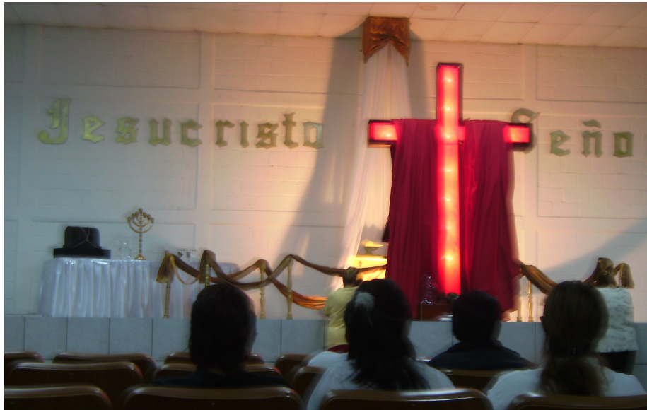
Altar de la Iglesia Universal del Reino de Dios