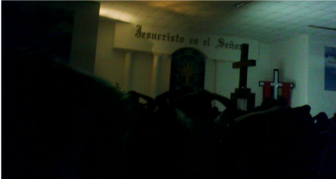
Los fieles ponen sus manos sobre su cabeza para después expulsar el mal.