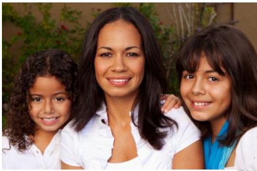
Ilustración 3 Mujer beneficiada

Todo esto comenzó en el 2010, y el año pasado contaba ya con 26 mil mujeres beneficiadas con un crédito. Podemos progresar, a diferencia de un banco, no cuenta con sucursales sino con Centros Comunitarios, uno ubicado en Nicolás Romero y otro en Atizapán de Zaragoza, Estado de México. Se han enfocado en estos municipios principalmente porque es ahí donde se concentra un número importante de habitantes con el perfil de su mercado meta, que son las mujeres con nivel socioeconómico D+, de 2 a 3