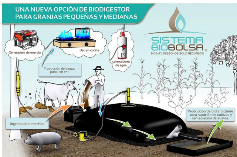
Ilustración 5 Explicación de cómo funciona Sistema Biobolsa

Sistema Biobolsa es una empresa social mexicana creada en el año 2010 que distribuye, instala y da servicio de Sistema Biobolsa. El fundador de esta empresa es Alex Eaton, un