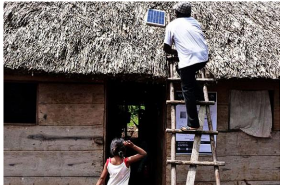
Ilustración2 Panel solar en una vivienda

Actualmente siguen desarrollando el proyecto iluminando cada día más y más viviendas en todo México. Han beneficiado a 20 mil personas con más de 3,800 sistemas instalados, así como a 18 escuelas en 11 estados del país. Los estados donde Iluméxico tiene presencia son: Baja California, Campeche, Estado de México, Guerrero, Hidalgo, Oaxaca, Puebla, Querétaro, Quintana Roo, Tabasco y Veracruz. Han instalado 135 kw de potencia y han desplazado 2,100 toneladas de dióxido de carbono. Su modelo autosustentable e incluyente la ha convertido en una empresa que genera tanto retorno económico como impacto social.