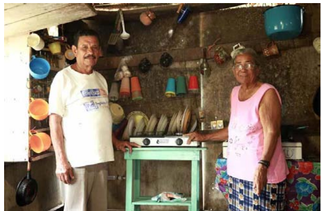
Ilustración 6 Personas beneficiadas con el Sistema Biobolsa

El estiércol producido por dos vacas o seis cerdos por día puede emitir un metro cúbico de biogás, lo que equivale a 2.2 kwh de electricidad. Después de un mes, mientras el sistema alcanza su plena capacidad productiva, la Biobolsa produce biogás y fertilizante a diario, siempre y cuando el agricultor siga poniendo estiércol y agua.