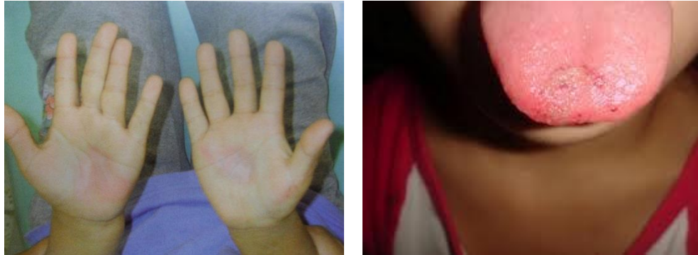
Fig. 2 6

Respecto a las mordeduras, estas presentan un área central de equimosis (contusión) causado por dos posibles fenómenos: