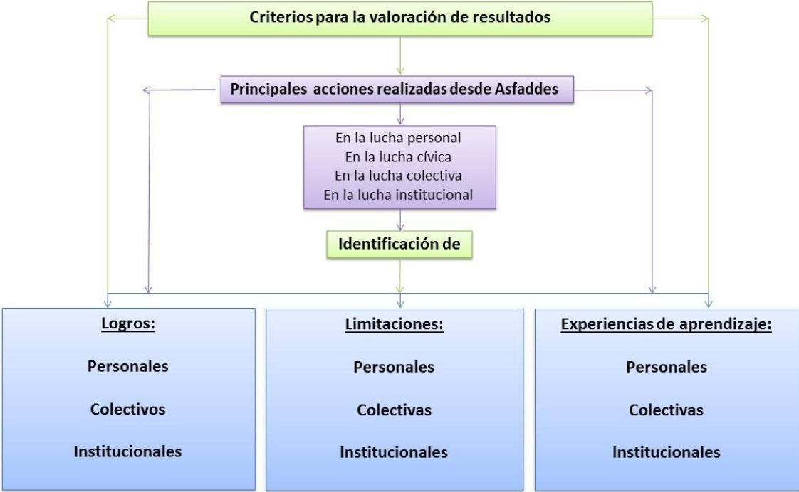
Figura 2: Criterios para la valoración de resultados

Los criterios para la valoración de resultados descritos, facilitarán el conocimiento a profundidad del caso de estudio, desde la subjetividad de los miembros de la asociación, y brindarán las herramientas necesarias para responder a los objetivos, las preguntas y las hipótesis de la investigación.