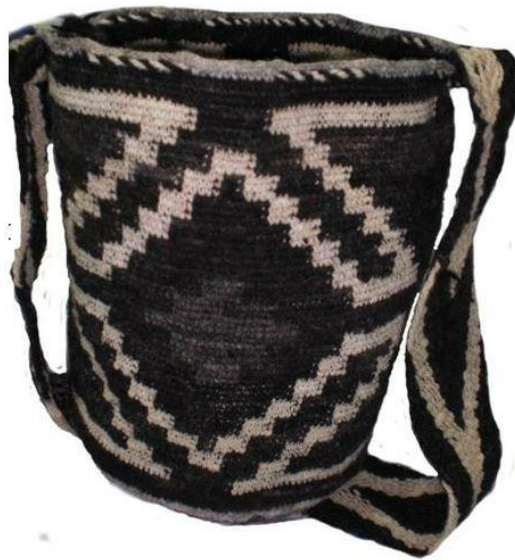
Figura 3. Mochila caucana

La manera simbólica como representa el Tejido de Comunicación su forma organizativa responde a una construcción conjunta de unidad para enfrentarse al plan de muerte del capitalismo y de sus estrategias. Por ello hablan de los hilos, nudos y huecos que lo conforman, tal como se teje una mochila o jigra que desde su significación para diferentes comunidades indígenas es la contendora de vida. En el Cauca las mochilas son generalmente elaboradas con lana de ovejo, hilo o con cabuya. El tejer en diferentes espacios une conocimientos y aclara pensamientos.