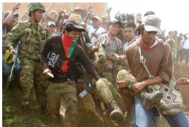
Figura 6. Fotografías comparativas