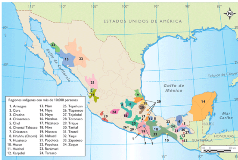
Figura 2. Mapa Pueblos indígenas en México

Estos rasgos de resistencia son también defendidos por las comunidades indígenas neozapatistas en México, desde su carácter antisistémico y anticapitalista. Según el censo del Instituto Nacional de Estadística y Geografía (INEGI) de 2005, Chiapas tiene 4.293.459 habitantes, siendo el séptimo de los Estados más poblados de México. Según el INEGI (2005), 957.255 personas pertenecen a un pueblo indígena en Chiapas. La mayoría de la población indígena se concentra en tres regiones: los Altos, el Norte y la Selva y se agrupan en los pueblos Tzeltal (37,9% de la población indígena total), Tzotzil (33,5%), Chol (16,9%), Zoque (4,6%), Tojolabal (4,5%) y Mame, Chuj, Kanjobal, Jacalteco, Lacandón, Kakchikel, Mochó (Motozintleco), Quiché e Ixil que juntos conforman el 2,7% de la población indígena del Estado, quienes en su mayoría son neozapatistas, reivindican las trece demandas organizados a través de los cinco Caracoles y sus respectivas Juntas de Buen Gobierno. El siguiente mapa muestra 34 de los 64 pueblos indígenas existentes en México, por cuanto éste sólo refiere a regiones indígenas con más de 10.000 habitantes.