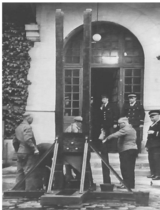
Imagen 4. Asistentes del Verdugo desmantelando una guillotina dentro de la prisión Santé, luego de la ejecución de Marcel Petiot, La vie étonnante de la guillotine , France siècle, URL: http://guillotine.voila.net/Histoire.html (consultado el 27 de mayo de 2015).