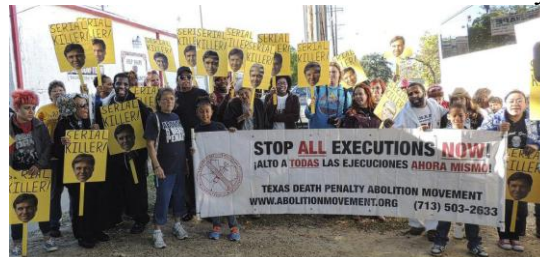
Imagen 7. Rubac, Gloria, “Death row survivors, families & activists march for abolition”, Workers World , Estados Unidos, 10 de noviembre 2013, URL: http://www.workers.org/articles/2013/11/10/death-row-survivors-families-activists-march-abolition/ (consultado el 27 de mayo de 2015).