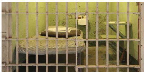
Imagen 6. Getty Images, “Cárceles” CNN México , “adn político”, México, 2014, URL: http://www.adnpolitico.com/ciudadanos/2014/04/09/a-10-anos-del-caso-avena-en-espera-ejecucion-de-mexicano , (consultado 27 de mayo 2015).