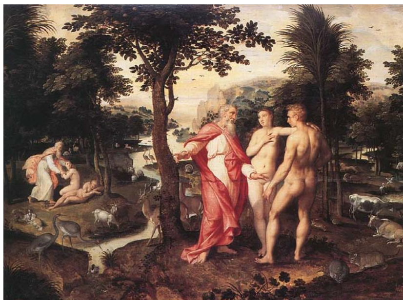
Imagen 1. Jardín del Edén de Jacob de Backer.