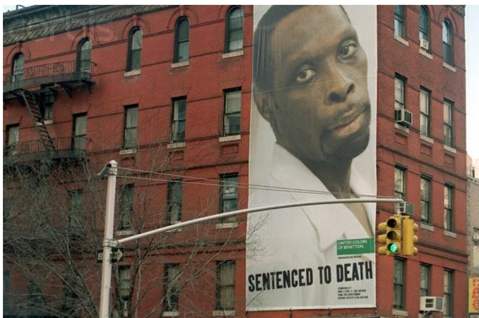
Figura 10. Oliverio Toscani, campaña publicitaria de Benetton “We On Death Row” 2000, URL: http://www.olivierotoscanistudio.com/it/portfolio.htm (consultada 27 de mayo de 2015).

El tema de los Derechos Humanos a favor de la abolición a la pena de muerte, se hace presente cada vez más, no sólo desde las familias o abogados de los condenados, sino también desde las mismas tribunas judiciales, desde las organizaciones no gubernamentales, desde las diferentes instituciones estatales, desde las universidades, y desde toda aquella racionalidad que se precie de darle una oportunidad a la vida, pero sobretodo a una educación internacional a fondo de los Derechos Humanos, que pueda hacer más fehaciente nuestro compromiso con el otro , aquel que comparte nuestro planeta.