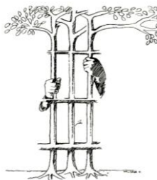
Imagen 3. Valeria V. Artículo de Cruz Castro, Fernando, “Vigencia y Supresión de la pena capital. La polémica de ayer y hoy (Argumentos, prejuicios y realidades)”, ILANUD , Vol. 7, núm. 20, San José de Costa Rica, 1988, pp. 30-50.

Ahora bien, si esta abolición conlleva la aparición de las instituciones carcelarias, cuyo objetivo es el de disciplinar, y por tanto, conseguir los comportamientos que el Estado desee; no creemos que esta opción sea totalmente válida, puesto que se ponen en juego los derechos del individuo, en caso de inocencia. La prevención es la etapa en la que el Estado debe centrar su atención, la respuesta al delito, ya sea la pena de muerte o la cadena perpetua, es el reflejo de la incapacidad del Estado, que desgraciadamente recae sobre la vida y la libertad del delincuente.