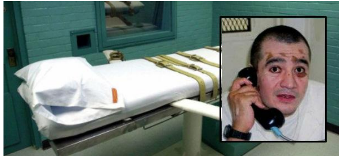
Imagen 9. Édgar Tamayo Arias, originario de Miaatlán Morelos, diagnosticado en 2008 con una discapacidad mental leve, es ejecutado el 22 de enero de 2014, por inyección letal en Texas, debido a una sentencia a pena capital por la muerte del policía Guy P. Gaddys, “¿Quién fue Édgar Tamayo y por qué fue ejecutado?”, Excelsior, especiales , 22 de enero de 2014, URL: http://www.excelsior.com.mx/nacional/2014/01/22/939589 (consultado el 27 de mayo de 2015).

éstas, de que cada vez más los Derechos Humanos son garantes de una civilización más justa.