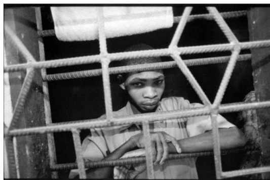
Imagen 5. Vogt Gilbert, Prisión en Lomé, Togo, 1996, “La situation das le monde”, Enfants en conflit et en contact avec la loi , Institut International des droits de l’enfant, 2015, URL: http://www.childsrights.org/documents/sensibilisation/themes-principaux/justice_juvenile.pdf (consultado el 27 de mayo de 2015).