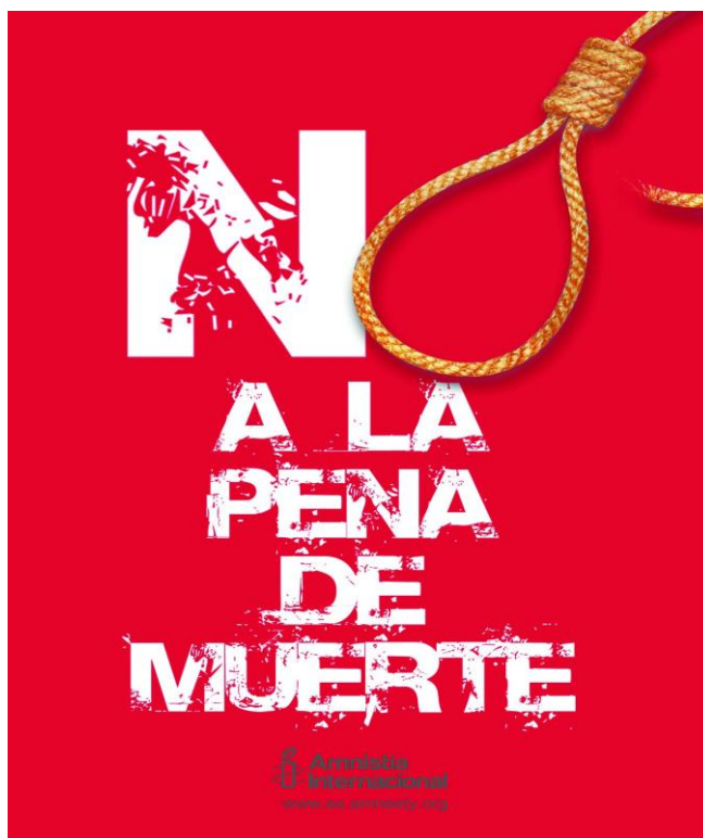
Imagen 2. Amnistía Internacional, elmundo.es , Madrid, 2006. URL: http://www.elmundo.es/elmundo/2006/10/10/solidaridad/1160474272.html , (consultado el 29 de mayo de 2015).