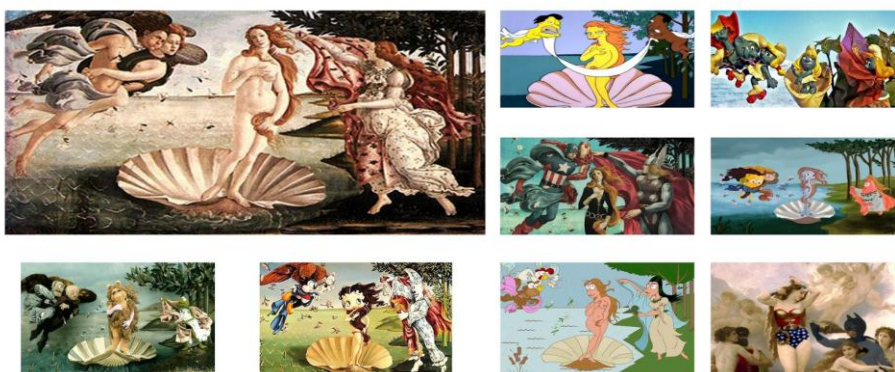
El Nacimiento de Venus (1484) - Sandro Botticelli 117

Un ejemplo de lo anterior se puede observar en las siguientes imágenes: