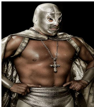
El Santo 119

El primer ejemplo es de una parodia realizada de un personaje que cuenta con una reserva de derechos como es el caso del famoso luchador “El Santo”, personaje humano de caracterización, y su parodia “El Santos”, mostrados en las siguientes imágenes: