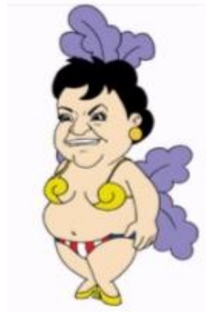
Carmen (programa “Descontrol” de TV Azteca, 2005)

Son claras las semejanzas que hay con la persona a la cual se parodia, aunado a que dicha parodia toma elementos de la vida y trabajo de la persona parodiada, es bien sabido que Carmen Salinas es seguidora de las chivas, de ahí los colores de su ropa interior y el atuendo en general hace alusión a la obra que produce, “Aventurera”.