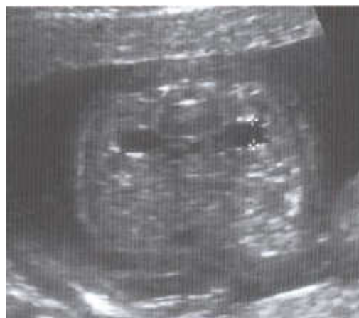
Figura 1 Corte axial donde se realiza medición del DAP de las pelvis renales.

Se determinará la correlación existente interobservador analizando los datos obtenidos con el método Bland-altman, para poder estimar la diferencia sistemática existente entre