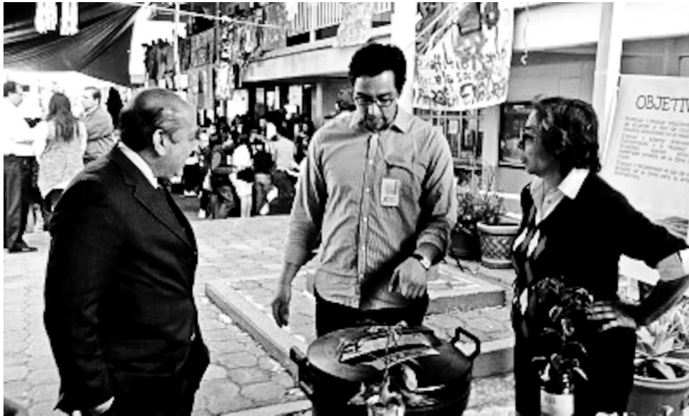
Imagen 4. Participación de los alumnos en el Proyecto Plamacolors, en diferentes técnicas de graffiti.