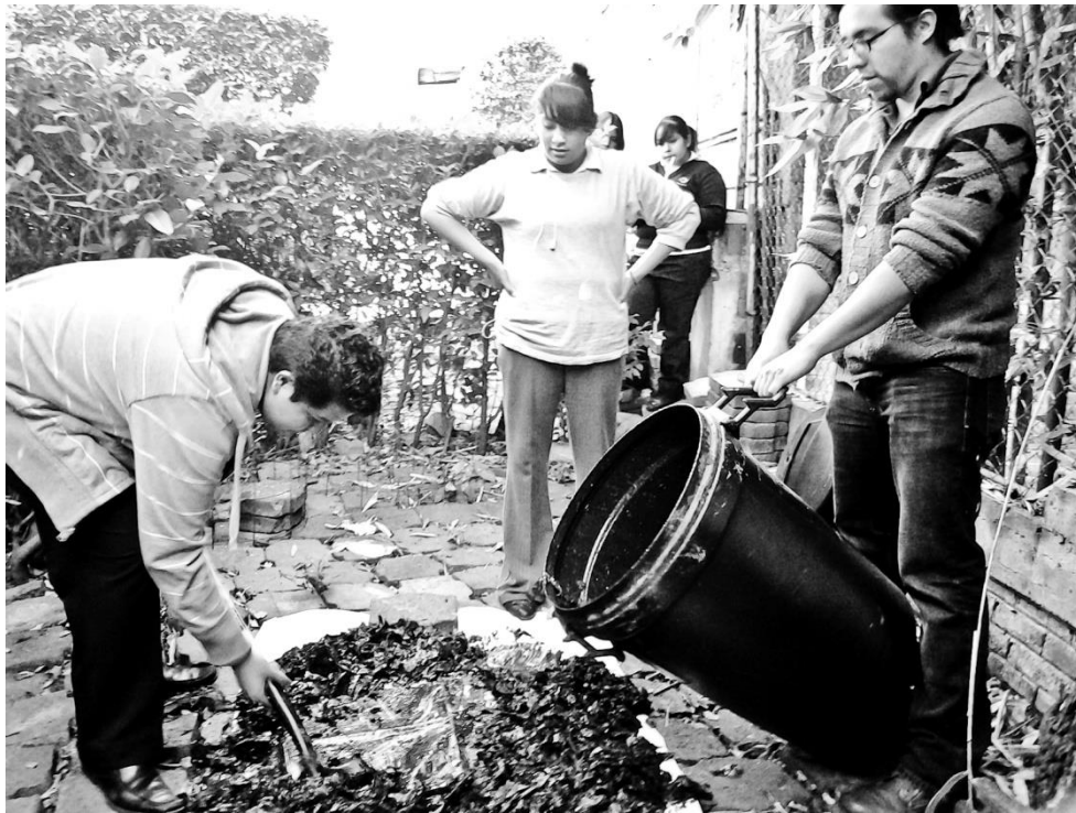
Imagen 2. Entusiasmo en la elaboración de Bokashi.