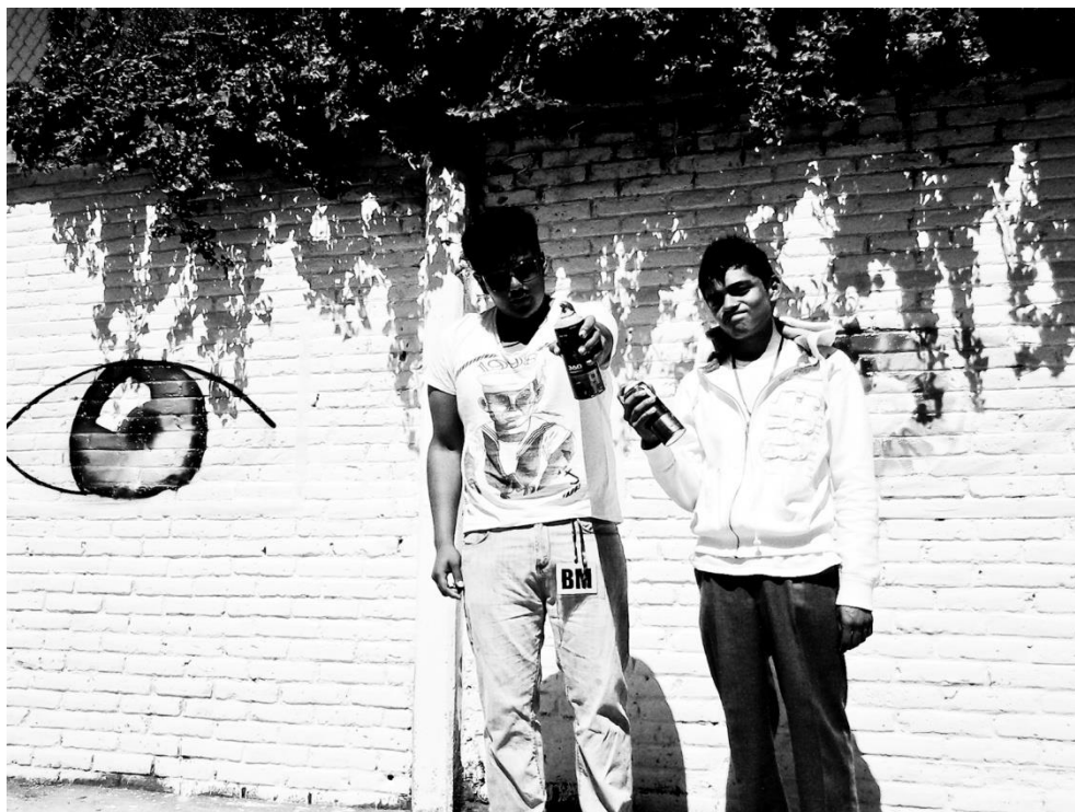
Imagen 6. Participantes del Proyecto Juvenil: Plamacolors.