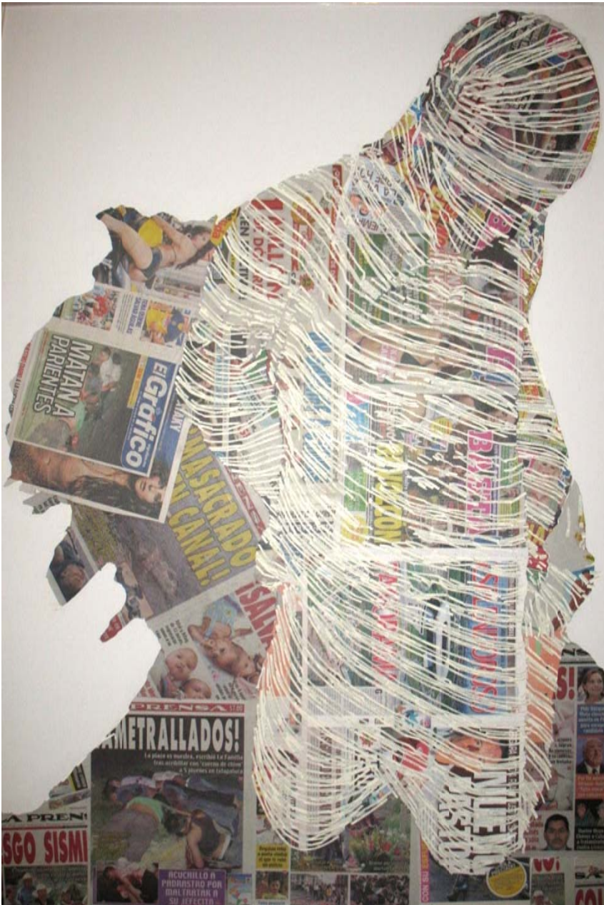
“In-formando IV”. 160x110cm. Collage. 2011

Tiene cinco tipos de publicaciones periódicas, dos de nota roja (La Prensa y El Gráfico), una de espectáculos (Basta), una de deportes (Esto), utilicé de todas ellas las primeras planas, junto con textos de la Biblia. Con