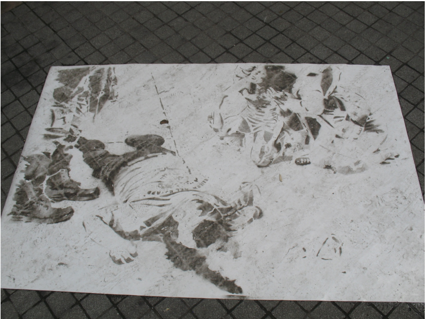
Intervención Liminares. Medidas variables. Pegamento y polvo sobre plástico. 2011

mundo, la colocación de la pieza en ese lugar fue un signo de un aspecto no asumido oficialmente como consecuencia de las prácticas económicas salvajes.