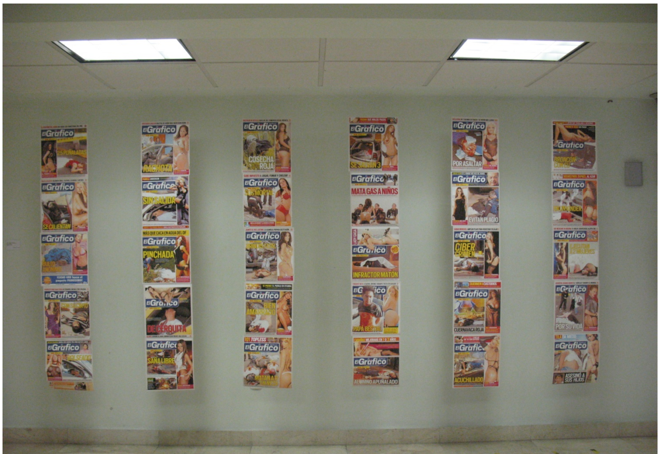
Pulsionales. Medidas variables. 45 portadas de periódico de 32x30cm. c/u. Impresión digital sobre papel fotográfico. 2012. Fragmento.

A partir de estas reflexiones es necesario cuestionar el funcionamiento y lógica de los operadores de estas dinámicas sociales. Para mi sorpresa el 50% del equipo editorial de esta publicación está compuesta por mujeres. ¿El contenido es un acto total o parcialmente inconsciente por parte de sus creadores y estrategas? Sin duda el paso siguiente será la irrupción en algún nivel de creación y distribución de estas publicaciones, pero por el momento esa etapa está en gestación.