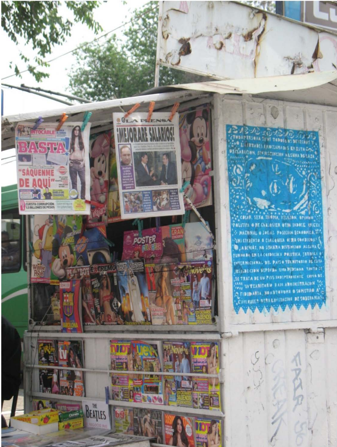
Intervención "Derechos divinos I" "Derechos divinos I". 74x50.5cm. Papel picado. 2012