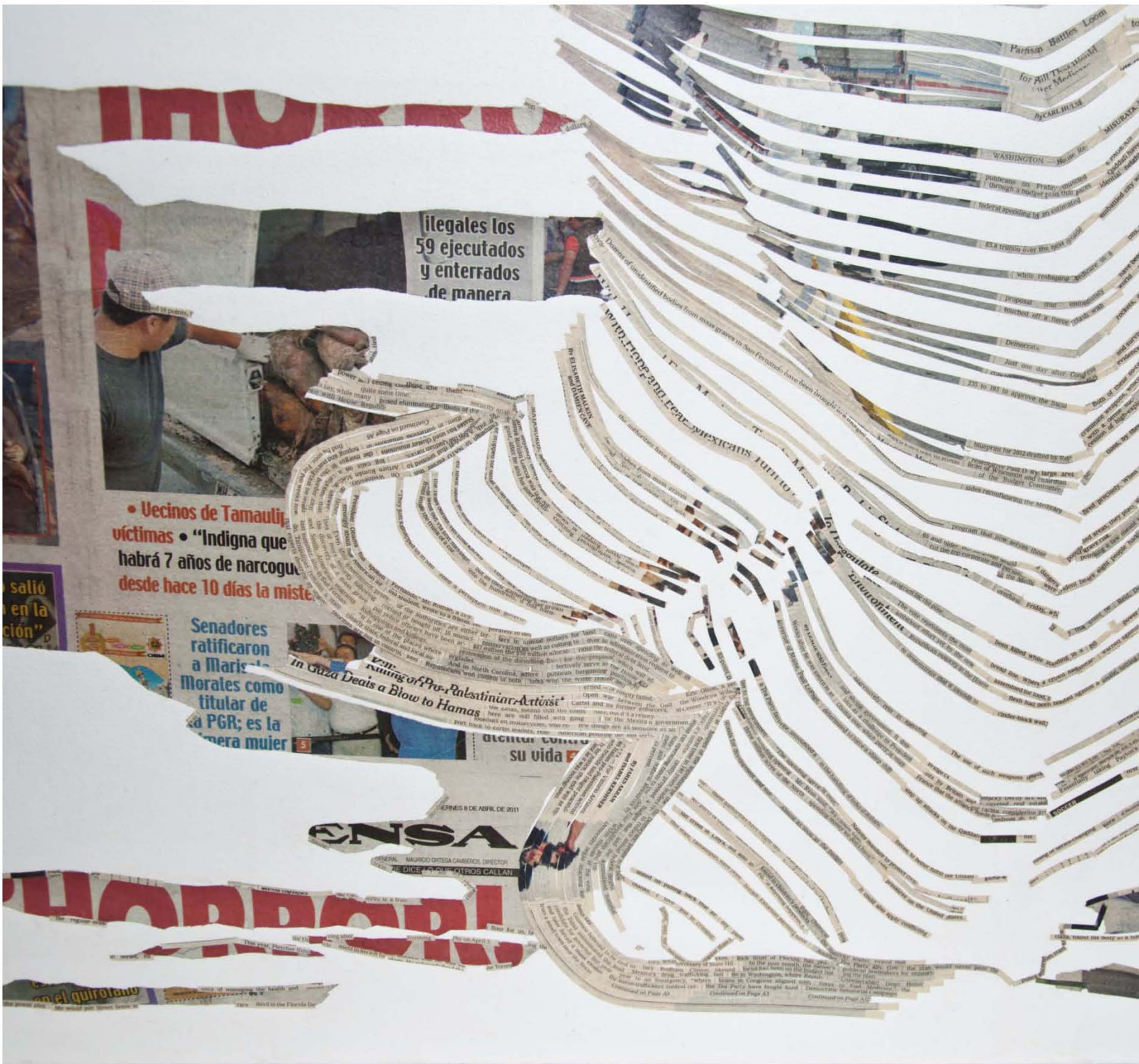
"In-formando V". 180x120cm. Collage. 2011. Fragmento.