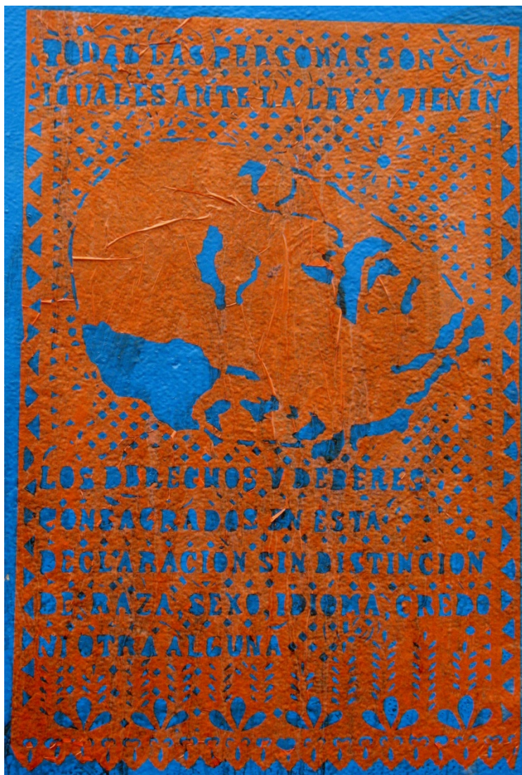
Intervención "Derechos divinos I" "Derechos divinos I". 74x50.5cm. Papel picado. 2012

La obra forma parte de la serie Derechos divinos que se caracteriza por estar realizada en papel china picado, es elaborado en bloques y puede ser reproducido innumerable cantidad de veces, la repetición y la ausencia de un original son particularidades importantes en la formulación del proyecto, la seriación semejante a la del grabado, y al cartel por su tamaño y aspecto físico, pero con una técnica que proviene del ámbito popular, que se coloca en la