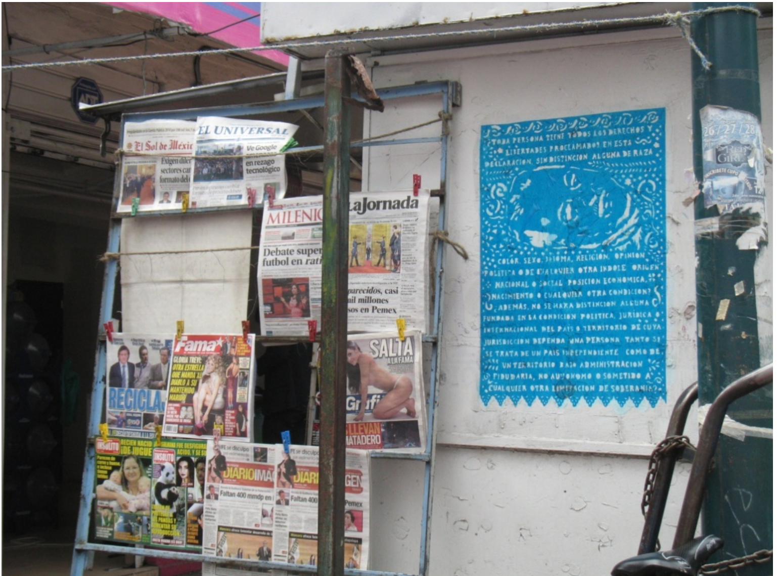
Intervención "Derechos divinos I" "Derechos divinos I". 74x50.5cm. Papel picado. 2012

La intervención Derechos Divinos coloca simbólicamente en conjunto varias partes que componen estas contradicciones del planteamiento de los derechos humanos, y la igualdad con los magnates representantes del poderío económico en