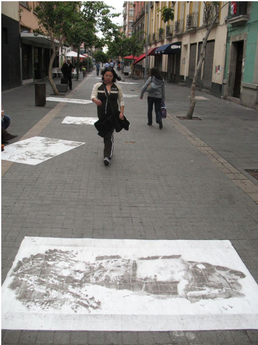
Intervención Liminares. Medidas variables. Pegamento y polvo sobre plástico. 2011

La similitud del dibujo con lo reales un componente imprescindible para el funcionamiento de la intervención, es necesario hacer reconocible la forma correspondiente con el contenido que surge.