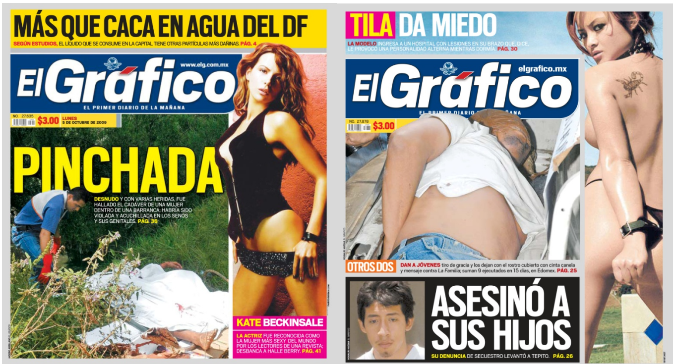
Pulsionales. Medidas variables. 45 portadas de periódico de 32x30cm. c/u. Impresión digital sobre papel fotográfico. 2012. Fragmento.

como una agonía psíquica, producto de la maquinaria cultural homogeneizantemente perversa. La mezcla de ambas imágenes es siniestra, misógina , pero el tono aumenta cuando la figura femenina de objeto libidinal se acompaña de una muerte femenina, llegando a un límite crítico cuando ésta última es producida por el impulso incontrolable del macho cabrío, que insatisfecho descarga la energía de su frustración hasta producir la muerte. Es la representación visual de formas de segregación desarrolladas históricamente, la marginalidad de género y de clase. Condiciones sociales producidas en el contexto en el que son generadas, revitalizadas y difundidas diariamente.