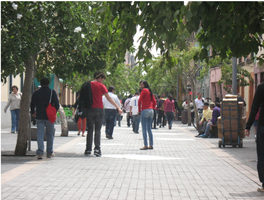
Intervención Liminares. Medidas variables. Pegamento y polvo sobre plástico. 2011

Por otro lado, las relaciones también se tejen desde el lugar en el que surgen las imágenes, su implicación contextual como fenómeno mediático que llega a la población, y como consecuencia deviene en implicaciones políticas. El momento político, económico y social que vivimos es el caldo de cultivo para la gestación de la intervención. Las implicaciones que tiene la pieza compone una red que rebasa el puro campo de las artes, para incluir el