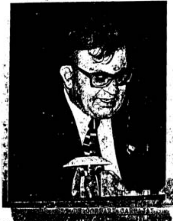
Imagen 2. Documentos de la Dirección Federal de Seguridad Versión publica Eli de Gortari, caja 13, legajo 1. Foja 203.