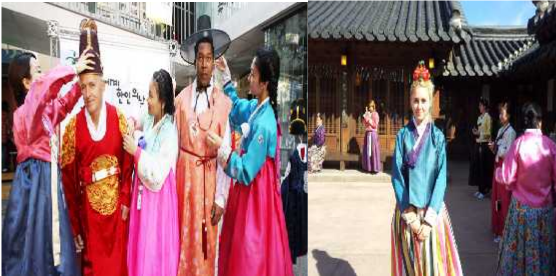
Anexo 8. Extranjeros londinenses utilizando trajes típicos de Corea.

http://spanish.korea.net/AboutKorea/Korea-at-a-Glance/Society