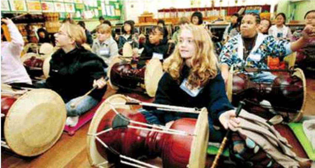
Anexo 7. Estudiantes extranjeros practicando Janggu.