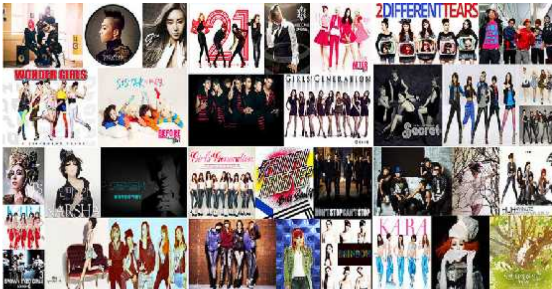
Anexo 16. Algunos de los grupos y cantantes más representativos de la música pop coreana

http://alualuna.wordpress.com/2012/10/16/what-weve-all-been-waiting-for-the-london-korean-film-festival/