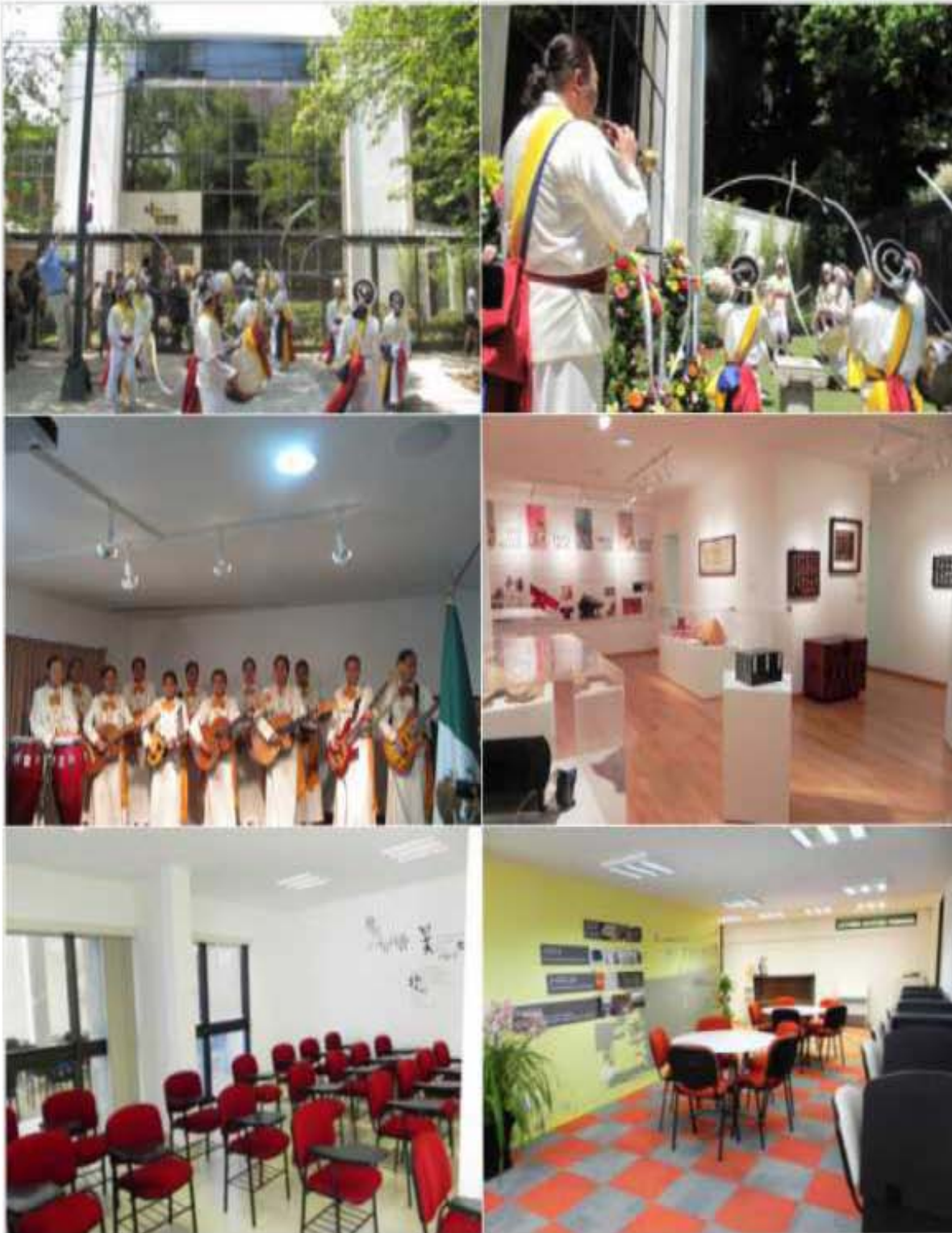
Anexo 17. Instalaciones del Centro Cultural Coreano en México. (Arriba) fachada y jardín, (centro) auditorio y sala de exposiciones, (abajo) salón de clases y biblioteca.

http://spanish.korea.net/Events/Overseas/view?articleId=1242