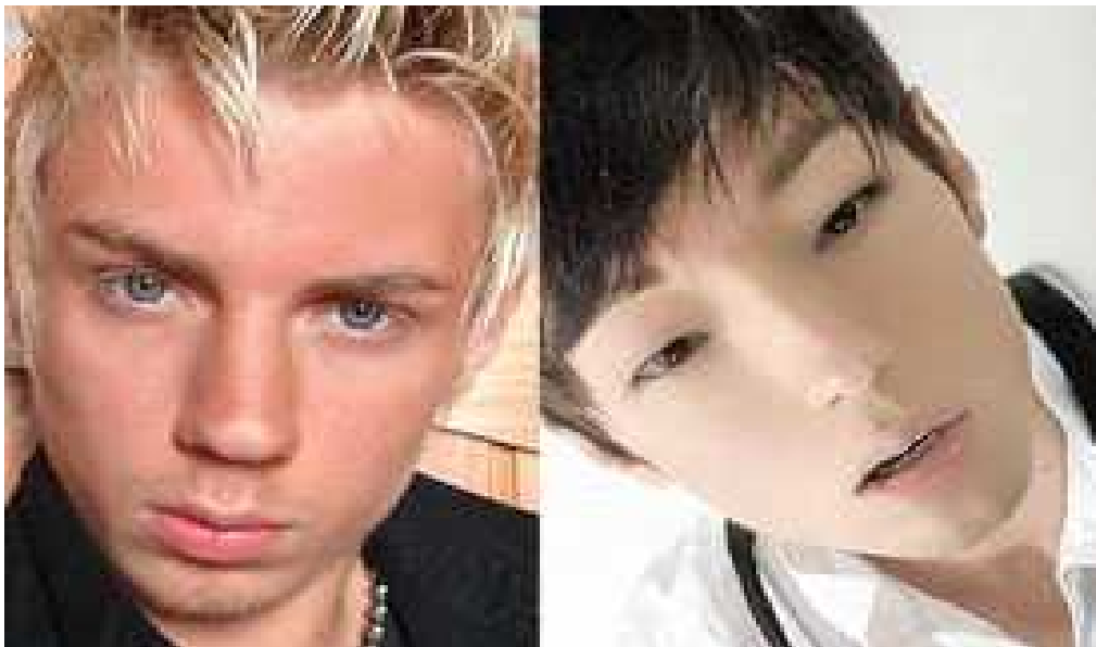
Anexo 12. Joven brasileño que se sometió a más de 10 intervenciones quirúrgicas para cambiar su apariencia y parecer asiático.

http://www.tinmoi.vn/hallyu-mon-qua-cua-chu-nghia-lang-man-the-ky-21-011148400.html