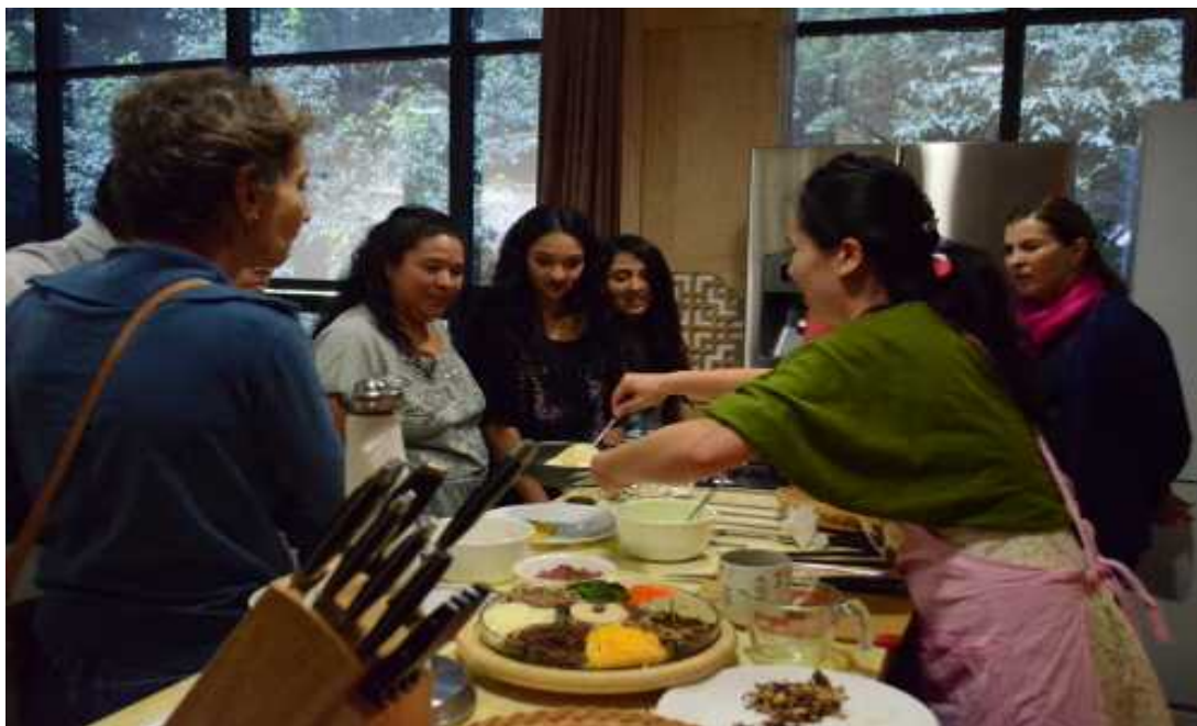
Anexo 21. Clase de cocina en el Centro Cultural Coreano en México.

http://spanish.visitkorea.or.kr/spa/CU/CU_SP_8_2_5.jsp