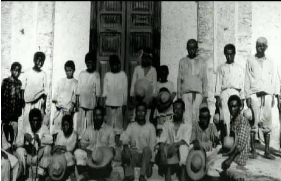
Anexo 1. Primera generación de inmigrantes coreanos en México.

http://www.taringa.net/posts/info/15879724/Inmigracion-coreana-en-Mexico.html