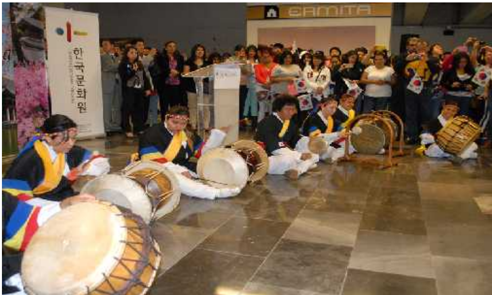
Anexo 19. Muestra musical por parte del grupo mexicano de Samulnori “Saewoolim” en la inauguración de la exposición fotográfica: “La belleza de Corea y sus Palacios”, en el metro ermita de la línea 12.

http://mexico.korean-culture.org/navigator.do?menuCode=201310250036&action=VIEW&seq=54527