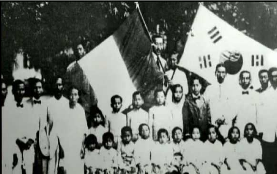
Anexo 4. Primera escuela coreana fundada en Mérida

http://www.antropologia.uady.mx/libros/libro_haciendas.php