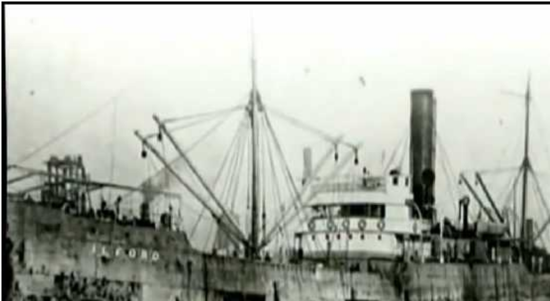
Anexo 2. Barco Ilford que zarpó de Incheón, rumbo al Puerto de Salina Cruz en 1905.

http://www.taringa.net/posts/info/15879724/Inmigracion-coreana-en-Mexico.html