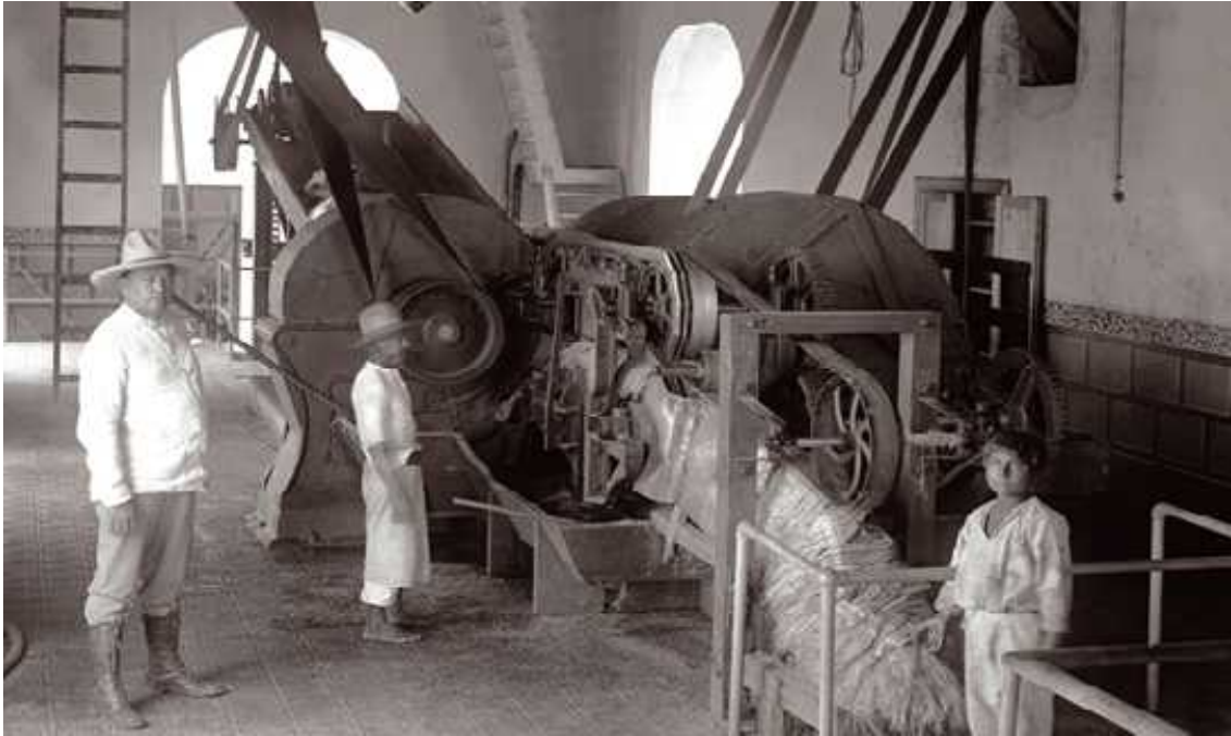
Anexo 3. Haciendas Henequeneras de Yucatán.

http://www.antropologia.uady.mx/libros/libro_haciendas.php