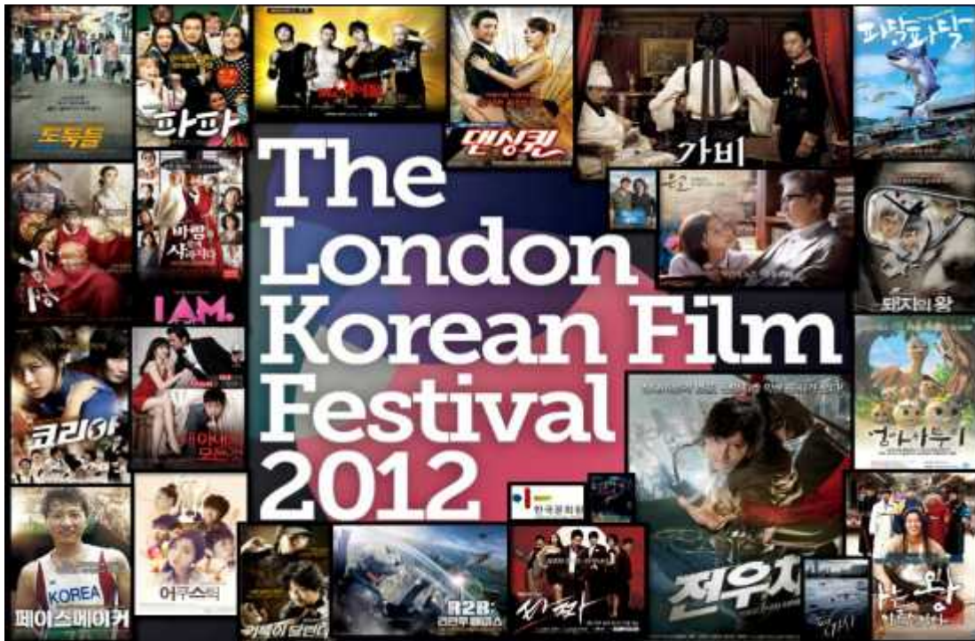
Anexo 15. Uno de los muchos festivales que se han dedicado a las películas de ese país tras su gran popularidad.

http://alualuna.wordpress.com/2012/10/16/what-weve-all-been-waiting-for-the-london-korean-film-festival/