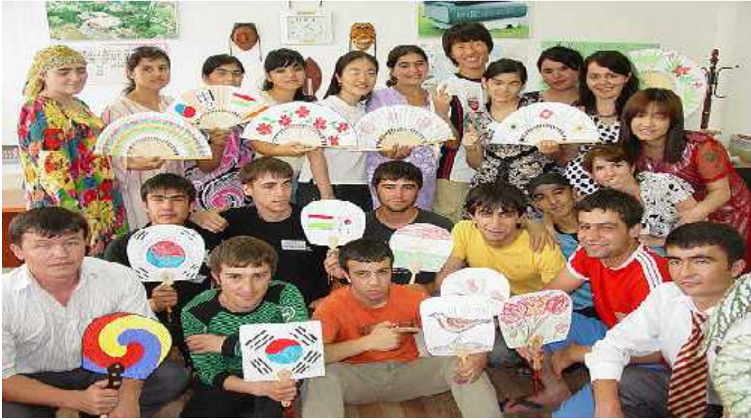
Anexo 9. Estudiantes del Instituto Rey Sejong en Dushanbe, Tayikistán, participan en el campamento de verano del idioma coreano 2011.