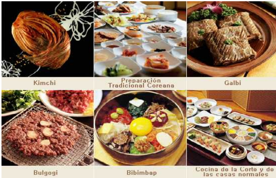
Anexo 20. Algunos de los platillos más representativos de la cocina Coreana.

http://spanish.visitkorea.or.kr/spa/CU/CU_SP_8_2_5.jsp