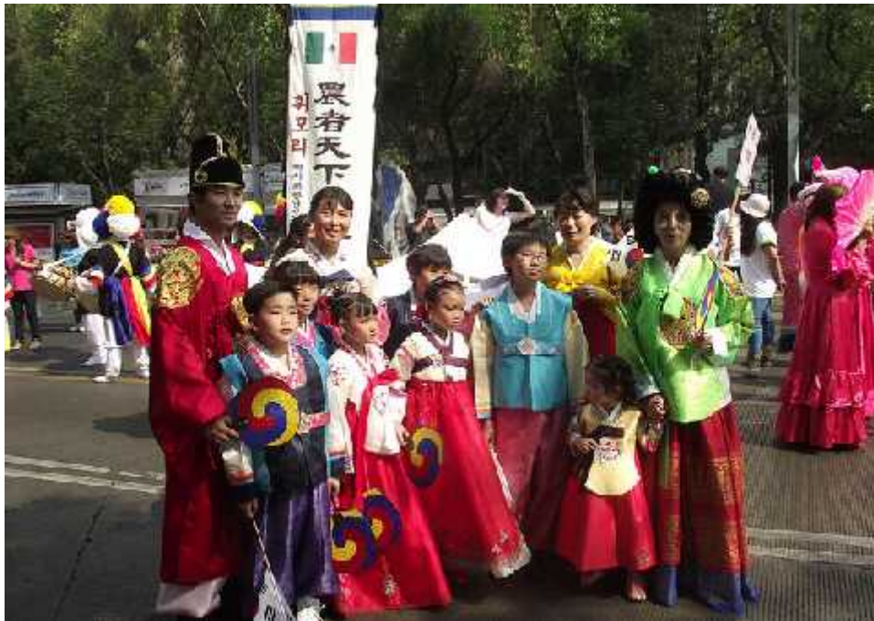
Anexo 10. Algunos integrantes de la comunidad coreana en México, desfilando por avenida Reforma, en la Feria de las Culturas Amigas 2012.

http://m.korea.net/spanish/NewsFocus/Society/view?articleId=98540