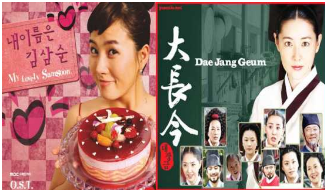
Anexo 14. Dos de las telenovelas más exitosas que dieron a conocer Corea del Sur.

http://fashion.taiwan.cn/topimg/201405/t20140521_6188110.htm