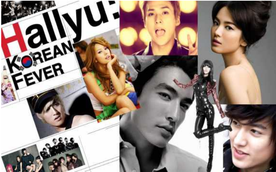
Anexo 11. Hallyu, la fiebre Coreana

http://www.tinmoi.vn/hallyu-mon-qua-cua-chu-nghia-lang-man-the-ky-21-011148400.html