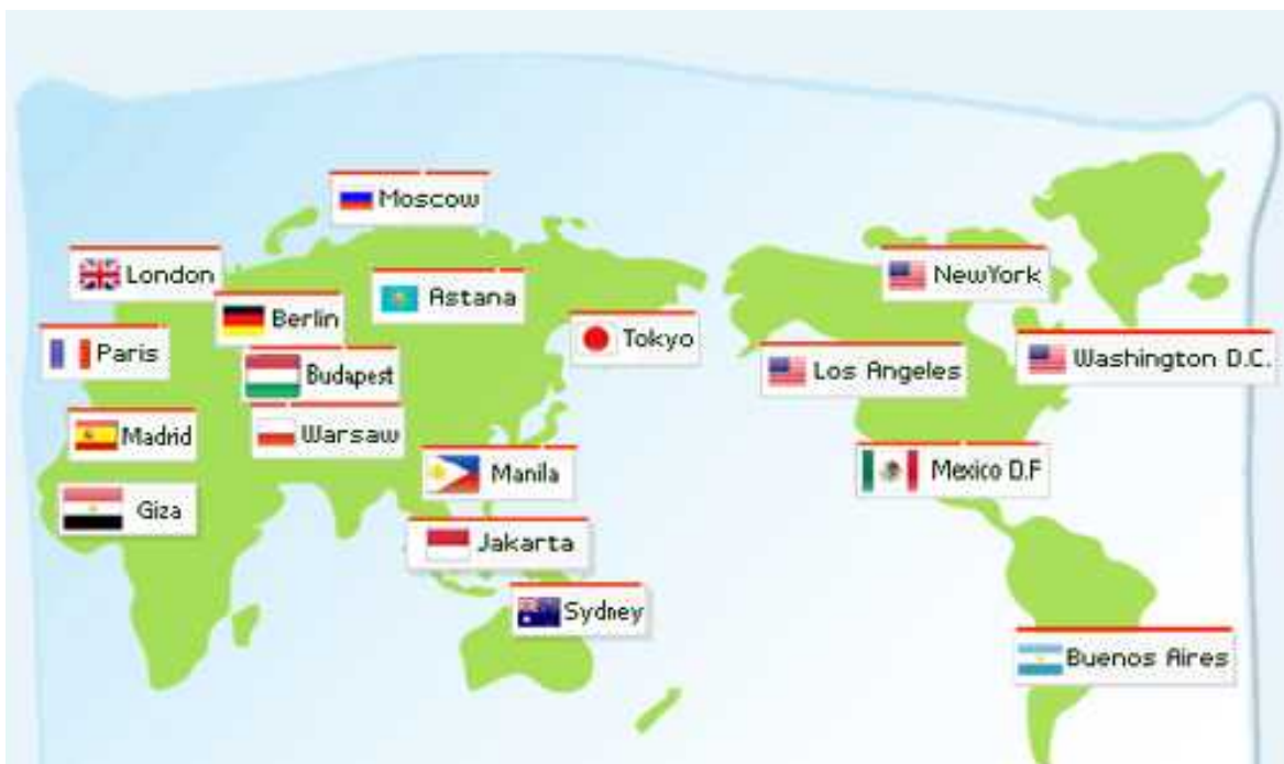
Anexo 5. Mapa de Centros Culturales Coreanos establecidos en las principales ciudades del mundo.