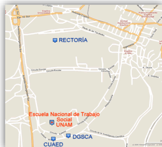
Imagen 1 Croquis de Ubicación de la Escuela Nacional de Trabajo Social, UNAM

La Escuela (ENTS) se encuentra en Ciudad Universitaria (Avenida Universidad, Número 3000, Ciudad Universitaria, Coyoacán, C.P. 04510, Ciudad de México, D.F.) en el Circuito exterior a un costado de la Facultad de Contaduría y Administración y de la avenida Insurgentes Sur. Es importante conocer la ubicación de la Escuela para situar las vías de acceso y la infraestructura que existe a su alrededor, que permite o impide la accesibilidad para llegar a ella y de esta forma saber las necesidades en cuestión de acceso de los alumnos con discapacidad de la ENTS.