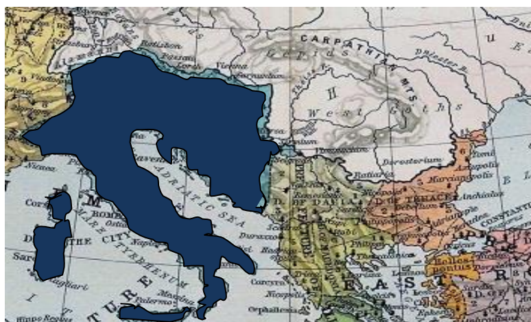
Mapa 1. En oscuro: Imperio Romano de Occidente.

Los primeros grupos de eslavos llegaron a la península balcánica entre los siglos VI y VII, en ese entonces experimentaron su primera división geopolítica y religiosa: “cuando los serbios y croatas aparecieron... hacia mediados del siglo VII eran tribus emparentadas que hablaban varios dialectos de la misma lengua, pero, dado que fueron a establecerse a cada bando de la línea Valentiniano – Valente que dividía a los Imperios romano occidental y oriental, evolucionaron hacia orientaciones diferentes, los croatas hacia Roma y el Catolicismo y los serbios hacia Constantinopla y la Ortodoxia” . 13 En la actualidad esta línea divisoria iría de la ciudad Serbia de Severín, en el río Danubio, hasta la ciudad de Montenegro de Kotor en el Mar Adriático. (Ver Mapa 1 ).