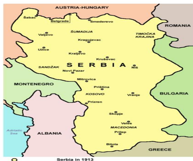
Mapa 3. Serbia..

De esta manera Serbia se formó un gran prestigio entre los pueblos eslavos; el sueño de la Gran Serbia, nuevamente despertaba expectativas, al tiempo que receló al Imperio Austro – Húngaro, y justo es este antagonismo entre ambos lo que llevaría al estallido de la I Guerra Mundial.