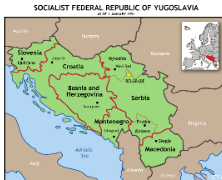
Mapa: 5.

La República Federal Socialista de Yugoslavia contaba con una superficie de 255.804 km 2 , se ubicaba en la península mediterránea del sur europeo, en el territorio denominado de los “Balcanes”; al norte limitaba con Italia, Austria y Hungría; al este con Rumania y Bulgaria; al sudeste y sur con Grecia, Albania y el mar Egeo; al oeste con el Mar Adriático y Jónico. Estaba constituida por las repúblicas socialistas de Bosnia-Herzegovina, Croacia, Macedonia, Montenegro, Serbia (incluidas las provincias de Voivodina y Kosovo) y Eslovenia. Ver mapa 5.