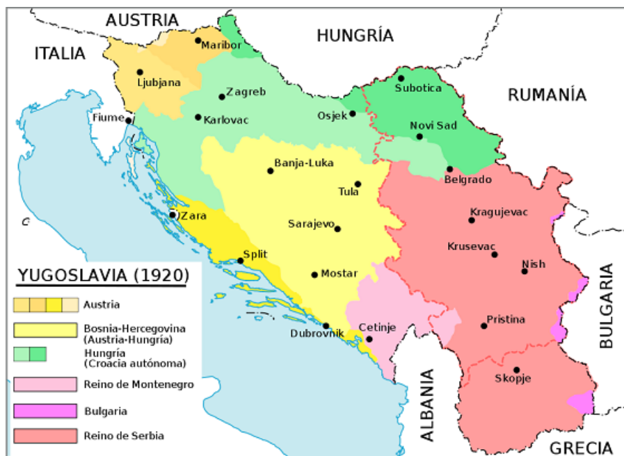
(Mapa 4).

Nuevamente se concreta un cambio en el mapa balcánico y sus fronteras, los cuatro grandes imperios europeos desaparecen; y se forman, extienden y consolidan nuevos Estados Independientes, se forma el Reino Servo-Croata-Esloveno, con territorios de Austria – Hungría, de Montenegro, y partes de Bulgaria y Macedonia. (Ver mapa 4).