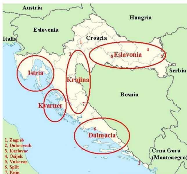
MAPA CROACIA (AREA DE ESLAVONIA –Incluye Vukovar).

una relativa paz en la zona hasta el verano del 95. El Consejo de Seguridad de la ONU aprobó por unanimidad, el 21 de febrero de 1992, el envío a Croacia del primer contingente de UNPROFOR, compuesto por 14.000 hombres.