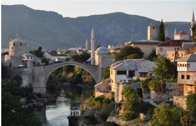
“Puente de Mostar” del siglo XVII. En la ciudad del mismo nombre; sobre el río Neretva, en Bosnia – Herzegovina. Patrimonio de la humanidad desde 1995 y símbolo del conflicto entre 1992 y 1995.

(Autor: Silvan Rehfeld. Fuente: http://whc.unesco.org/en/list/946/gallery/ Consulta: 21 de octubre de 2014. 18:30)